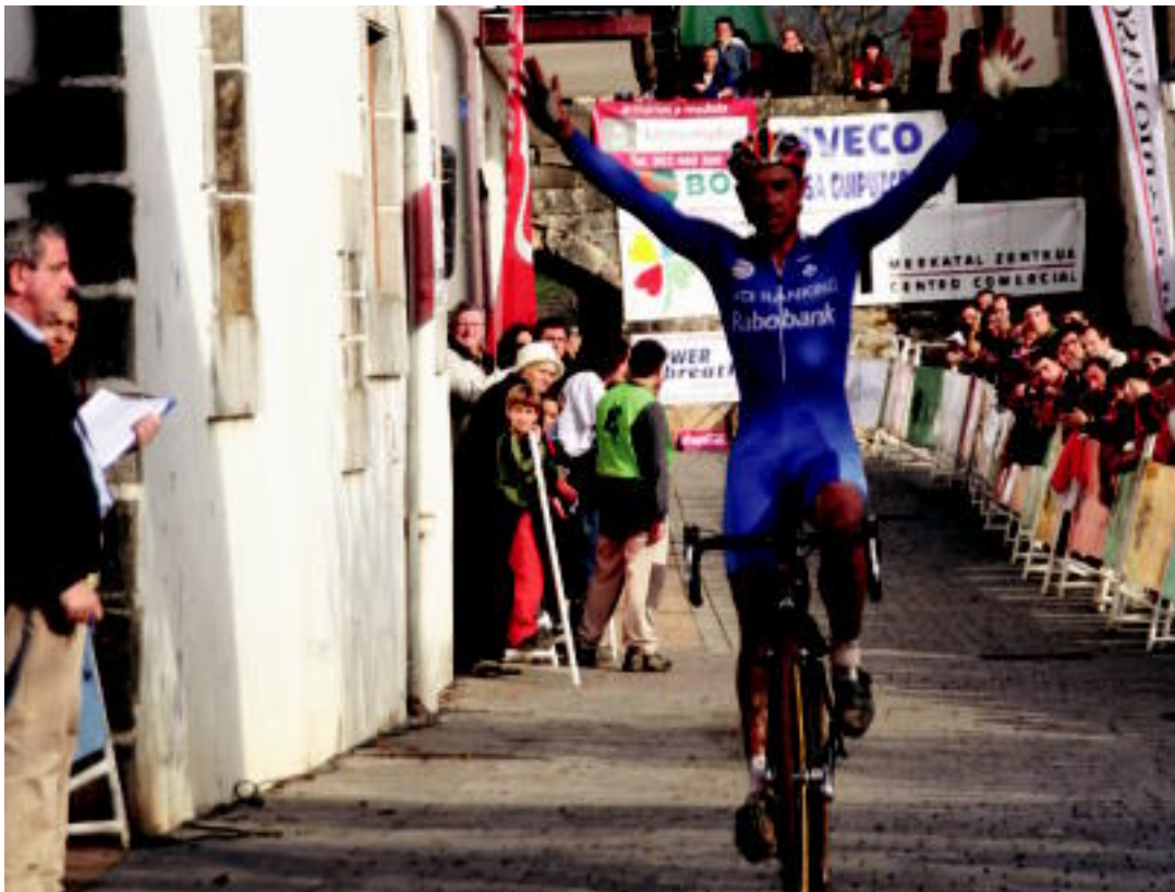
Sven Nys flandestarra izan da garaile Asteasuko IX. Nazioarteko Ziklokrosean.