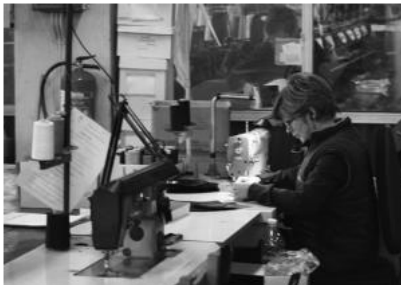
Gaur egun oraindik txapelak egiteko prozesu gehiena eskuz egiten jarraitzen dute. HARRIET BELLOSO

Ohitura aldatetak ere kontuan eduki behar dira. Duela 50 urte, txapelaren erabilpena oso hedatua zegoen. Lehen ileak erortzen hasten zirenean burua estaltzeko erabiltzen zen. Egun, ordea, oso jende gutxi ikusten da txapelarekin, eta ikusten direnak oso helduak dira.