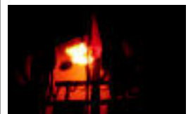
Herenegun erre zuten. HITZA

TOLOSALDEA Pasa den hilean ekitaldi ugari egin zituzten Tolosaldea institutukoek 2