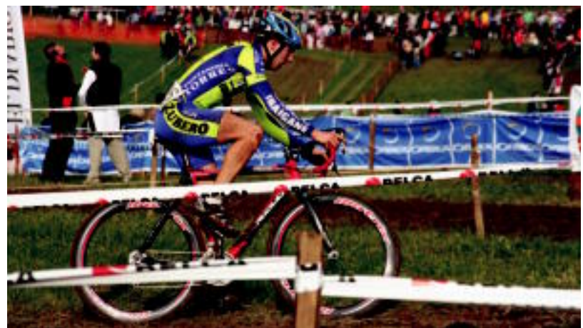
Joan den urteko ibilbide bera egin behar izan zuten txirrindulariek, antolatzaileak gustura agertu ziren honekin. E. EZEIZA