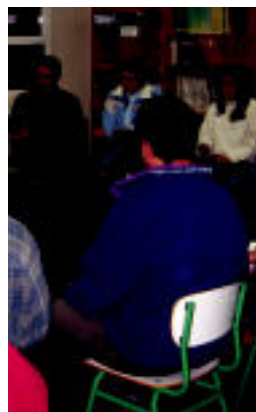
Gurasoak ikastaro batean. M. SOROA

Izen-ematea Tolosako udaletxeko osasun eta gizarte zerbitzuetan egin daitezke 10:00etatik 13:00era bitartean astelehenetik ostiralera, ostegunetan izan ezik. Bestela, 943 69 74 60 telefono zenbakira deituta ere egin daitezke. Izena emateko epea hilaren 21ean bukatuko da. Hau egiteko garaian kontu korronteko zenbakiak eman behar-