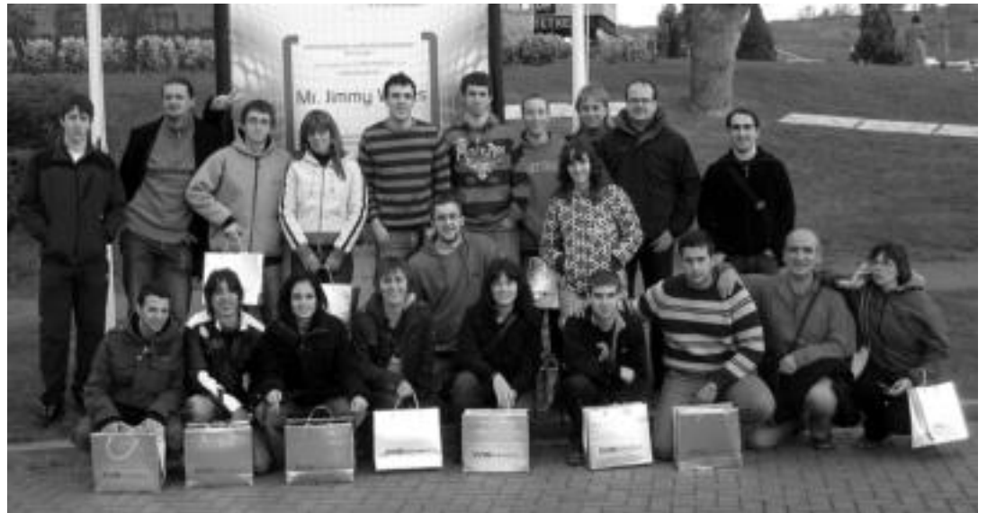
Tolosaldeko Institutuko Sistema Informatikoen Administrazioako zikloko ikasleak Jimmy Walesek Gasteizen eskaini zuen hitzaldian.