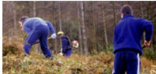
Goian, Espainiako bandera sutan. Beheran, amezketarrak auzolanean. HITZA

hau bidali nahi izan diete: «Hau ez da Espainia, ez eta Frantzia ere. Hau Euskal Herria da. Zuen banderak arrotzak dira hemen. Herri honek erabakiko du zein ikur eta bandera jarri».