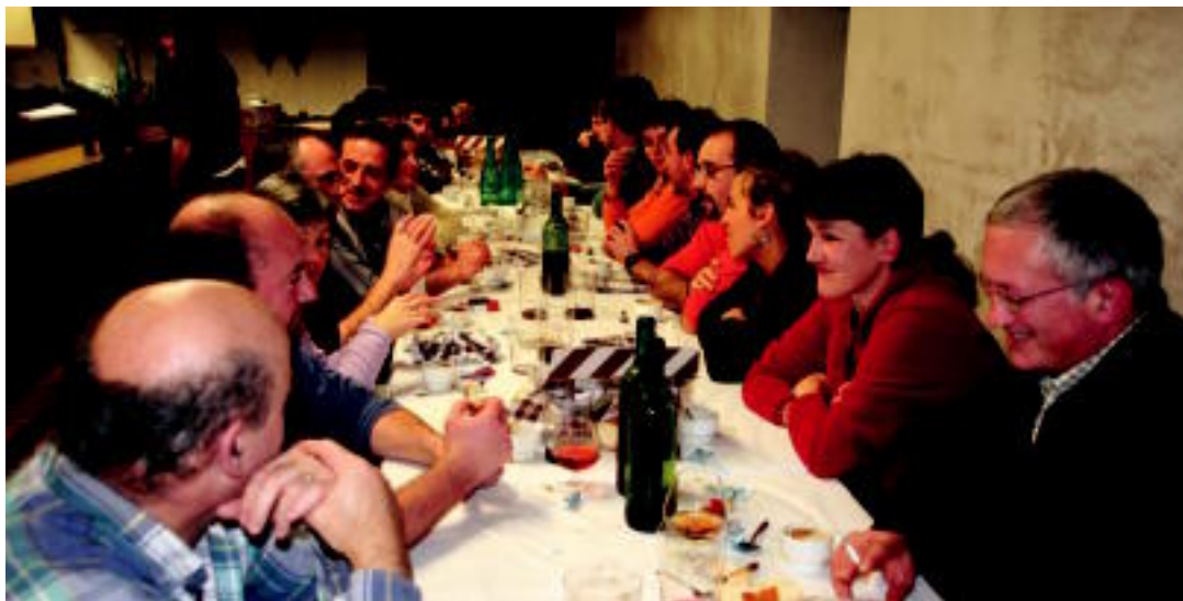
Babarrunak, aza, odolkia, mondejua, orkatza eta postrerako kafea pastekin izan zituzten. 30 bat lagun bildu ziren Zazpi-Iturri elkartearen. N. URBIZU

HITZAK ez du bere gain hartzen egunkariaren adierazitako esaneri eta iritzien erantzunkizunik.