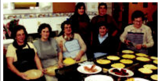
Taloak egiten jardun zuen taldea. KARLOS IRAZU

Ostiralean hasi zen Kultur Astea eta haurrak izan ziren protagonista. Merienda egin zuten eta tribial moduko jolasa, tardean Larrauli buruzko galderekin. «Haurrak gustura hartu zuten jolasa», azaldu du Mujikak. Gau partean bertso