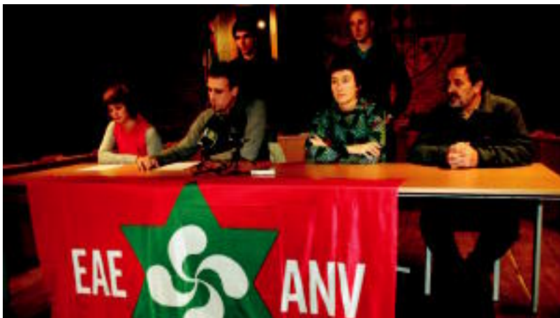
EAEren Tolosako ordezkariak, herenegun eginiko prentsaurrekoan. ESTI EZBIZA

AURKARIAK Faboritoak, besteak beste, Vanthourenhout eta Heule izango ditu aurrez aurre biharko proban >4