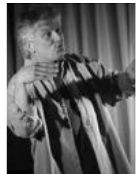
Amestoy ipuin kontalaria. HITZA

Euskal Herrian, gainera, azken urteetan hainbat artistekin lan egiteko aukera ere izan du, hala nola