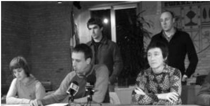
Eusko Abertzale Ekintzako Tolosako ordezkariak herenegun egindako agerraldian. E. EZEIZA