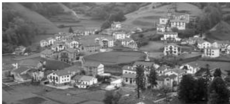
Mendialdeko herrien etorkizuna erakitzekeo herrien eta herritarren gaur egungo egoera aztertzen ari dira. J. ASTIBIA