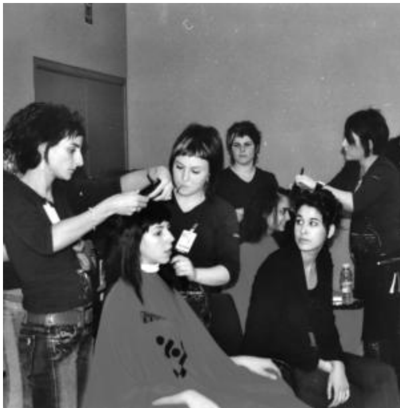
Honekin ileapaindegiko lankideak desfilean parte hartu zuten modeloekin lanean.

Egun moda munduan berrikuntza asko agertzen ari dira. Orain, esate baterako, bolumen handiak, orrazkerak gaineratuak, ile hedapenak eta tamaina handiko kopetileak eramaten dira. Diseinatzaileak eta ile-apaintzaileak momentuan oinarritzen dira beraien lan berrietarako. Koloreetan, ilea mozteko eratan eta jantzien disenuetan etengabe ematen dira aldaketak. Mundu honetan lan egiten duten profesionalak beste lanetik asko ikasten dute, eta askotan, inspirazio moduan erabiltzen dituzte beraien eskaintza berrietarako.