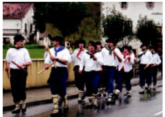
Talai dantzariak. NEREA URBIZU

ALBIZTUR 37 urte zituen eta Albizturko Herria plataformakoa zen; gaur elizkizunak izango dira eta herriak omenaldi xumea egingo dio aurretik >6