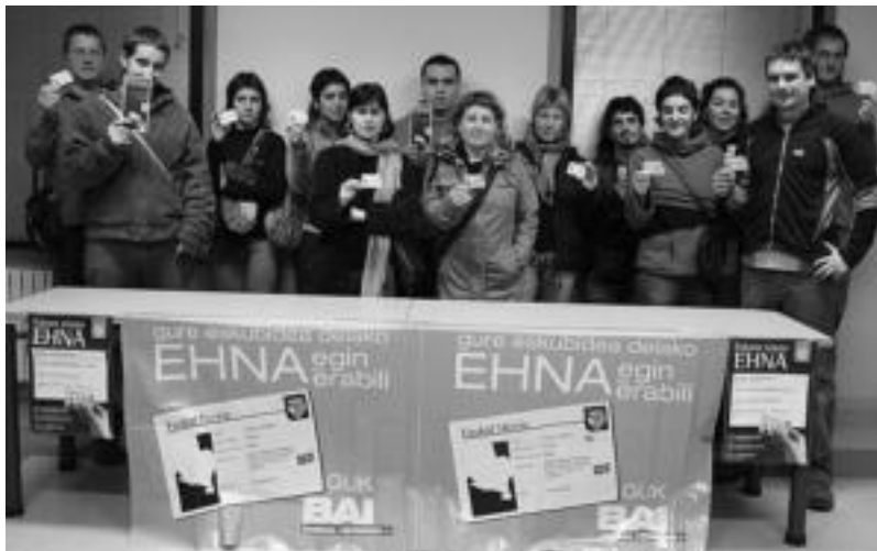
Ibarrako Bai Euskal Herriaririk hainbat herritar elkartu zituen EHNA eskuan pasa den astean Kultur Etxean. ASIER IMAZ

Ibarrako Bai Euskal Herriari mugimenduak, EHNA tramitatzeko aukera eskainiko du bihar, ostegunean, Ibarrako udaletxean. Tramitazioa egin nahi duenak, 11:00etatik 14:00etara udaletxeko ateak zabalik izango ditu. Arduradunek jakinarazi dutenez, «3 argazki, 15 euro eta errolda agiria eman beharko dira», azken hau, beti ere Ibarren erroldatutik ez daudenentzako baldintza izango da. «Hemen bilduriko herritarrek,