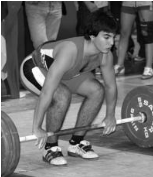
Sasiainek hiru domina lortu zituen Espainiako 17 urte azpiko txapelketan. HITZA