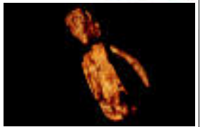
24.000 urte ditu Txobxongo taldeak zuten txobxongilo hauek...

Nahiko indartsu dagoela esango nuke. Duela hiru hilabete inguru Txobxongilo eguna osatu zen Getxon eta 14 talde bildu ginen. Horietako batzuk hasiberriak ziren, besteak urteak zeramatzanak, baina hor gurtu da, izan ere, hore ere mu bat geratu da non ez diren ez