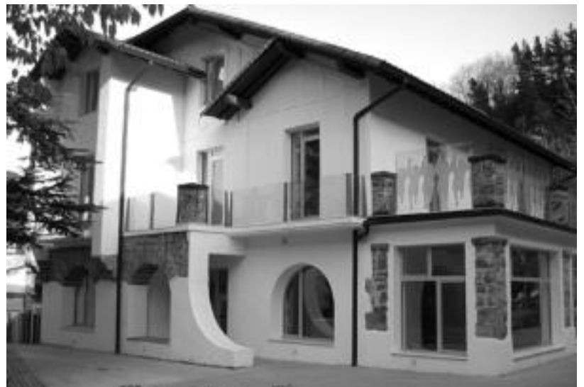
Urdapilleta etxea eraberritu dute Seaska Haurreskolaren egoitza izateko. I. GARCIA