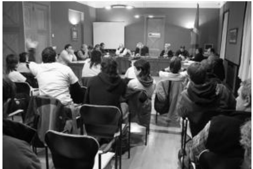
Herenegun burutu zen udalbatza osoaren ohiko bilkura irudia: Korporazioa, EAEko kideak eta Udal langileak. A. IMAZ

Azkenik, «informazioa ezkutatzeko eta herritarren iritzia aintzartatzeko hartzen ez dituztenak salatzearekin batera, herri mugimendu eta herritarren eskuetatik datozen informazio kanpainak zein galdeketa txalotzekoak direla» aipatu zuten Tolosaldeko ezker abertzaleko kideek.