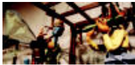
Etzaxetis sugu jantziak, 1937. urtekoak dira txobxongilo hauek...