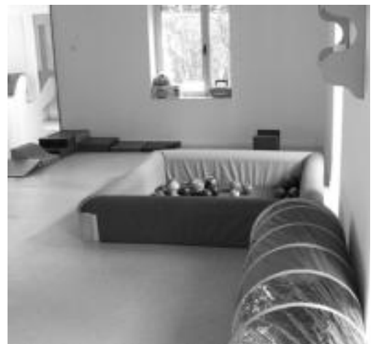
Psikomotrizitate gela lehenengo solairuan dago. I. GARCIA

Seaska Haurreskola, hiru 0-1 urte tarterako eta beste hiru 1-2 urte tarterako. Beharregatik, baina, 0-1 urteentzako lau gela atondu dituzte. Etxearen kanpoan igogailua eraiki dute eta parke bat egin dute haurrak kanpora atera eta bertan jolastu ahal izateko.