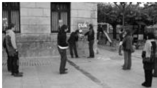
Ibarren ANV-EAEren kartelak eta eskuorriak banatu eta jarri zituzten.