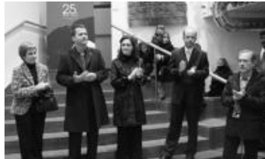
Antolatzaileak eta erakundeetako ordezkariak, atzo, inaugurazioan. I.T.

Erakusketaz gain, gaur ere izango dira ikuski zunak, hain zuzen ere, bost herriko txoko desberdinetan.