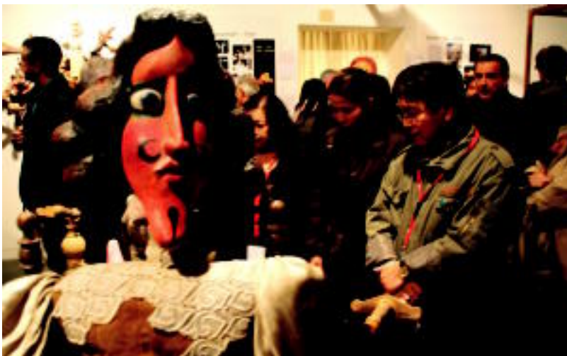
Aranburu jauregian Txekiar Txotxongiloen Leihoa erakusketa inauguratu zuten. I. TERRADILLOS

GAUR Herriko bost txokotan ikuskizunak izango dira, arratsaldean; Aranburuko erakusketa ere ikusgai dago 10