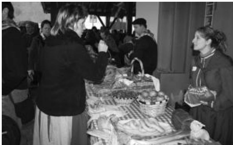
Zanpantzarrak atsedean hartzen, kupeletik ez oso urrun badaezpada, atzo ospatu zen Ikaztegietakako Euskal Jaian.