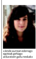
«Jende aurrean ederrago egoteak gehiago arduratzen gaitu neska»