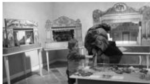
Gaztetxoek ere ederki pasa zuten txotxongiloak ikusiz. I.T.