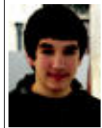
«Orohar, neskek garrantzi gehiago ematen diote iburari»