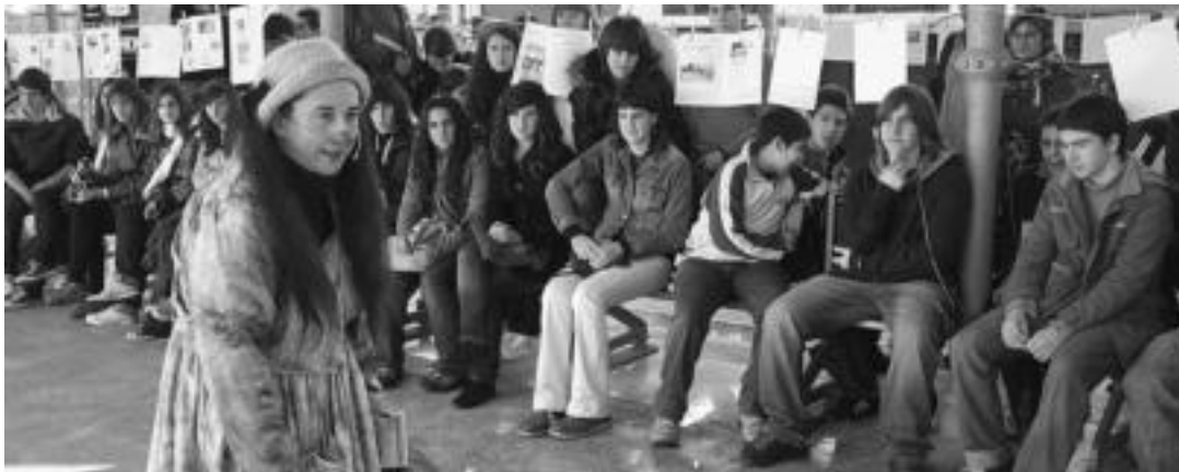
Emakumeenganako Indarkeriaren Aurkako Egurenaren harira hainbat ekintza gauzatu dituzte aste honetan, gazteak sentsibilizatzeko asmoz. IMANOL GARCIA