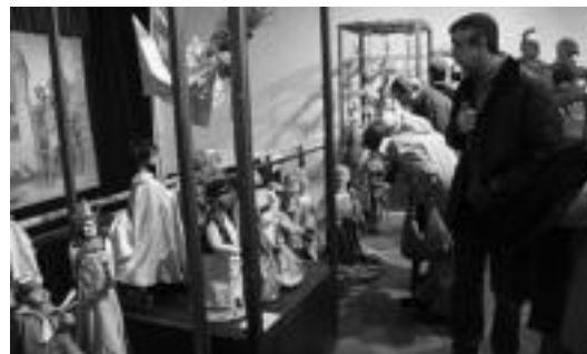
Jende ugari gerturatu zen Aranburura. Guztiak txundituta geratu ziren. I.T.