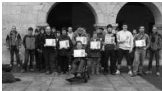
Amezketan, Aldarria eskuetan, Independentzia Eguna ospatu zuten. A. IMAZ