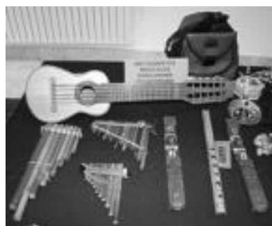
Ekuadorreko gune batetako instrumentu musikalak. A. I.

Kultura eta ezagutza elkartu dira egun hauetan Ibarren. Biak uztarririk doazen hitzak dira eta hitz hauen esanahien saltsa herriko Kultur Etxean aurki genezake azaroaren 30a bitarte.