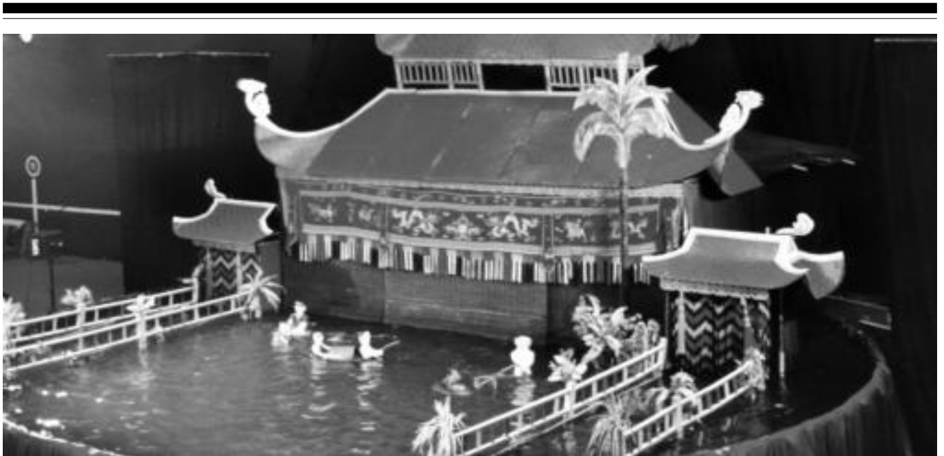
Cia. Nal de Hanoi txotxongilo taldearen (Vietnam) Marionetas sobre el agua obrako uneetako bat; hauen emanaldiak Beotibarren izango dira. HITZA