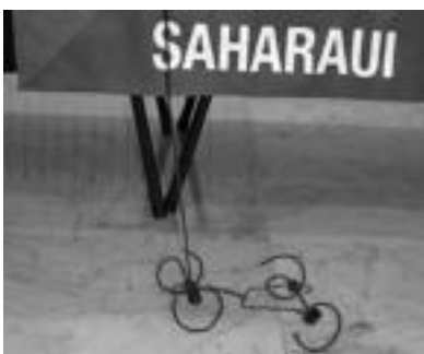
Saharako haurrek jolasteko ibiltzen duten autoa. A. IMAZ