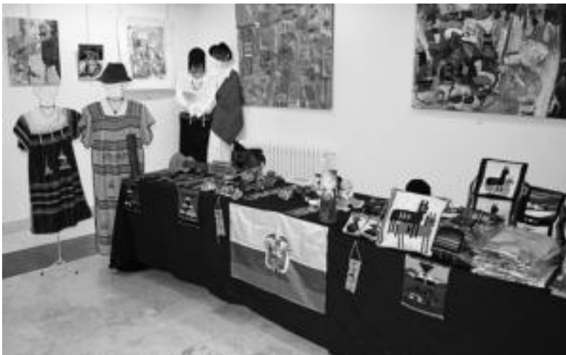
Jantziak, musika instrumentuak, giltziak, poltxak... aurki daitezke Ekuadorreko mahaiairen gainean. A. IMAZ