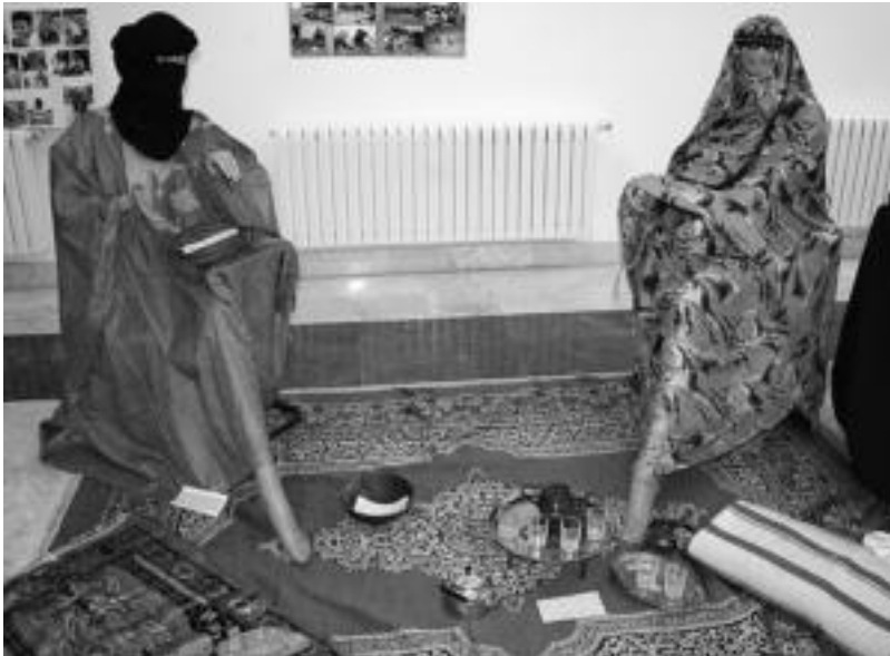
Jazkerak, ohiturak, koloreak... Saharako herritarren islada ikus daiteke Benito Izagirre kultur etxean. A. IMAZ