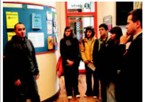
Udal ordezkariak eta herriko gazte batzuk atzo bulego berrian. I. TERRADILLOS

IBARRA Kultur Truke Hamabostaldiaren baitan, Ekuador eta Sahara gertutik ezagutzeko erakusketa jarri dute Kultur Etxean 6