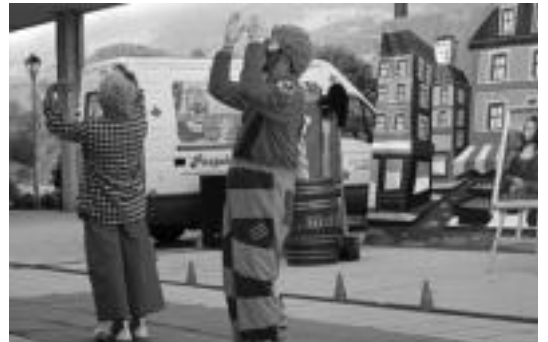
Poxpolok eta Mokolok Bidegoianen egindako emanaldia. ESTI EZBIZA

Urtero ez dute produktu berri bat ateratzeko eskualdeko pailazo