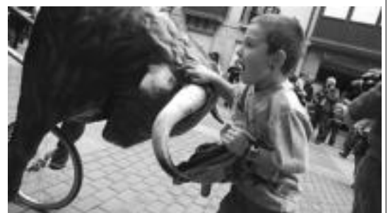
Entziero txiki egingo dute ondoren, kareta eta guzti. E. EZEIZA

Bihar Baliarraingo Kultur Elejiraren baitan haurrentzako tailer erakargarriak daude kultur gelan. 17:00etan txapak, lepokoak, pitxiak eta entziero txiki egingo dituzte Ani Martinezekin.