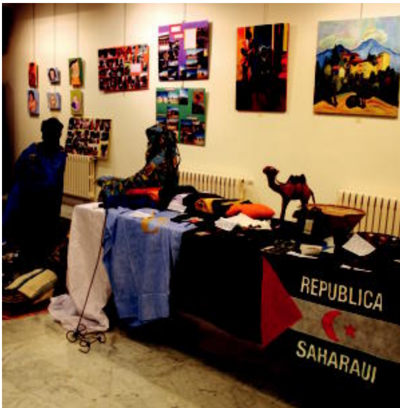
Jazkerak, ohiturak, koloreak,... Saharako herritarren islada ikus daiteke erakusketan. A. IMAZ

LEIHOA Aurtengo sail berezian, Europan tradizio sendoa duen herrialdea omenduko dute, txekiar errepublika 2-3