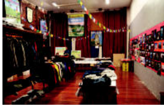
Mendi material ugari topa daiteke Oargin: arropa, botak, ... I. TERRADILLOS

Tolosa » Jende asko bisitatu du jada Oargik antolatu duen mendira; igandera arte azokako eta igandera arte egongo da zabalik