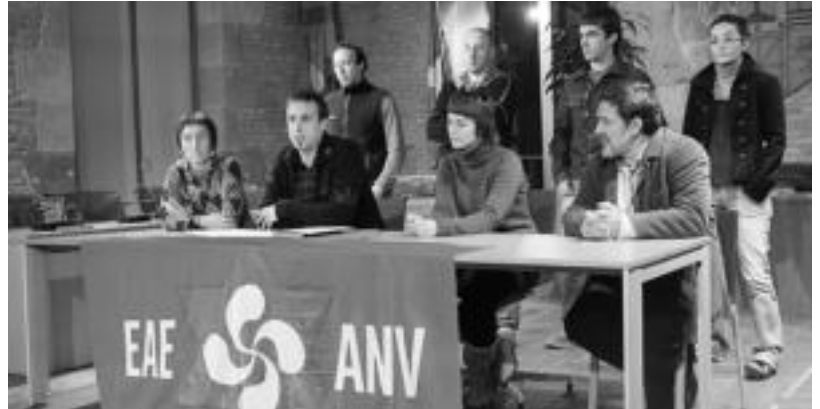
Tolosako EAE-ANV-ko ordezkariak herenegun, Udaletxeko pleno aretoan egindako agerraldian. E. EZEIZA

Mozio hau, aurreko osoko bilkura baino lehen aurkeztu zuten EAE-ANVkoek. Hala, herenegun go agerraldian salatu zuten, batzorde horretan, Udal osatzen duten zinegotzi eta alkateak gai horren inguruan hitz egin bazuten ere, beraiek ez ziren deituak izan bilkurara. Horrez gain, «mozioa-