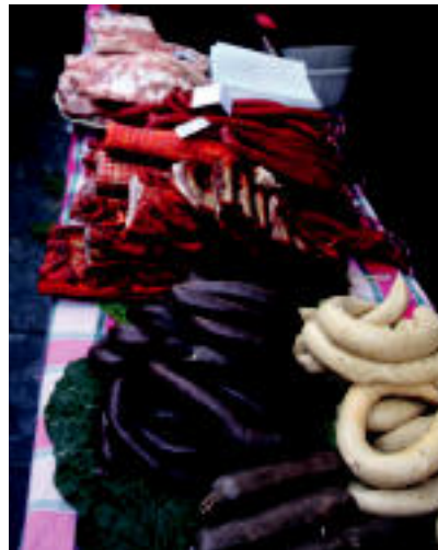
Ikaztegieta larunbateko azokan, besteak beste, animaliak eta garaiko produktuak izango dira.