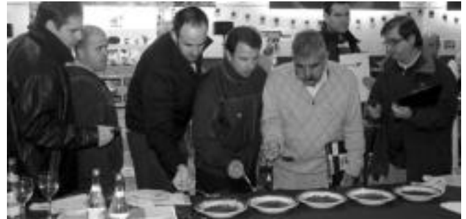
Ekzerrean eta behean ferialekuko bazkariko eta lehiaketako uneak. Goian, Zerkausiko bazkariko irudia, txarangaren doinuekin. HITZA