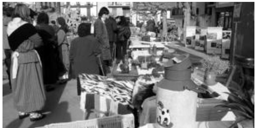
Amezketako feria arrakastatsua izan zen. Herritarren postuek plaza girotu zuten goizean zehar. ANDER OTEZABAL