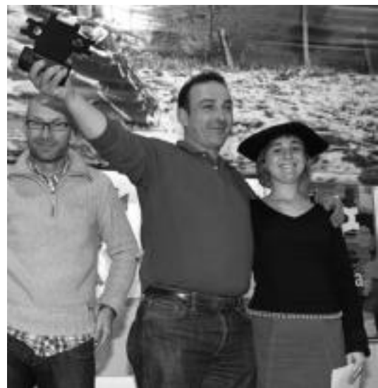
Lehiaketa Gastronomikoaren sari banaketaren une bat. HITZA

Ez, gero eta gutxiago. Gaur egun ez dauka jendeak hainbeste ordu sukaldian egoteko denbora. Horretaz gain, bitrozeramikarekin ere ez dira hain ondo egiten.