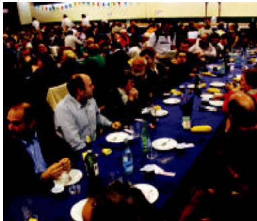
650 lagun inguru bildu ziren Ferialekuan eginiko herri bazkarian.