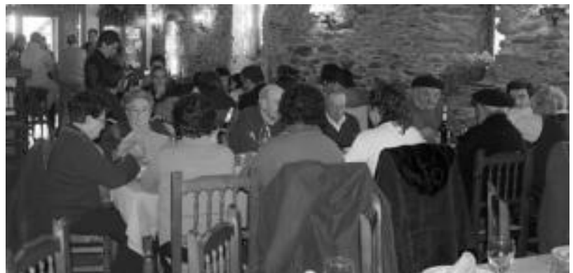
Baliarraingo Kultur Elejiraren baitan 12 jubilatuek elkartu ziren Zartagi jatetxean. ANDER OTEZABAL