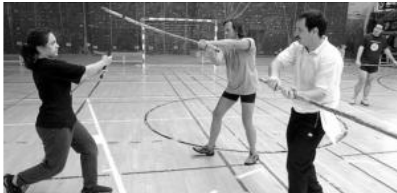
Donostian euskal makil borroka irakasten dute, eta hainbat herritan erakustaldiak ere egiten dituzte.