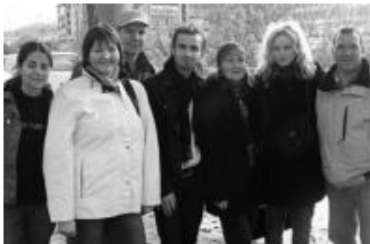
Lituaniako dantza eta antzerki taldekoak Tolosan dira jada. I. TERRADILLOS

Gaintitzen elkarteak antolatutako Sentsibilizazio Astearen baitan, Sacrificio ecologico izeneko laburmetraia eta antzerki emanaldia izango dira gaur Leidor zineman. Ekitaldia 21:30ean hasiko da. Bigarren saioan Gaiztan taldeak eta Lituaniako dantza eta aktore talde batek hartuko dute parte. Lituaniarrak herenegun iritsi ziren Tolosara eta egun hauetan zehar Tolosa bisitatzeko aukera izan dute.