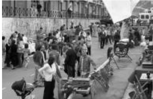
Zazpigarren urtez antolatu dute baserriar eta artisauren azoka. HITZA

Gaur egun osoan bisitatu ahalko dute interesatuek erakusketa eta asteburuan zehar plaza aldera gerturatuko dute. Bertan, AHTk Anoetan eta, oro har, Tolosaldean «mondik igaroko litzatekeen eta zehar kalte eragingo litzuzkeen» azaltzen dute. Infomazio iturria Eusko Jaurlaritzak 2003-04 artean udaletxeetara bidalitako oinarritzko proiektua izan da. Antolatzailerak aipatu dutenez, «orduz