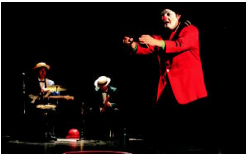
'Pantomimas Kutxo' mimo emanaldia izan zen herenegun Leidor antzokian ESTI EZEIZA

DATUAK 2004-07 artean 42 lagunek eskatu dute laguntza Udalean eta Ertzaintza 39 kasuren jarraipenarekin ari da 3