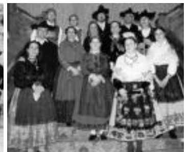
Goian, Kataluniako Esbart Jove de Gualba taldea, eta behean, Valladolideko Corrobla de Bailes y Costumbres taldeko kideak.