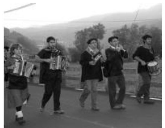
Ekitaldi ugari egingo dira asteburu honetan Amasan. M. SOROA

Larunbatean, 11:00etan, ume krosa egongo da 6. mailara arteko haurrentzat. Ondoren amasarrik gazteluarren aurka ariko dira aizkora, txingana, korrika eta bizikletan. 18:00etan afizionatuen arteko eskuzko pilota partida jokatu dute. Ibarguren-Artola Arretxe-Pinarren aurka ariko dira. 11:30etik aurrera DJ festa egongo da plazan