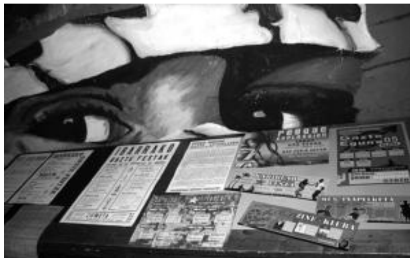
Ibarako Gaztetearen ormetan 1983. urtetik honako kartelak egongo dira erakusgai Kultur Astearen barnean. A. IMAZ

100 kartel inguruk osatzen dute erakusketak. Hauen garapena eta