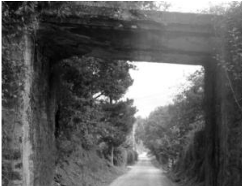
Europako 26 hautagaien artean aukeratu zuten Plazaola Partzuergoa HITZA