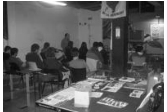
Gaztetxean egindako DVD emanaldian 25 lagun inguru izan ziren. HITZA

Hala ere, Udalak «proiektu honen aldeko apustuari» eusten dio, eta 33 Eremuan etxebizitzak eraikitzen hasteko behar diren dokumentu guztiak lortzeko ahaleginek egingo dituela azaldu du.