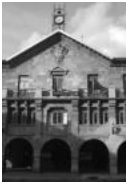
Udalaren proiektua da hau. N. GARZIA