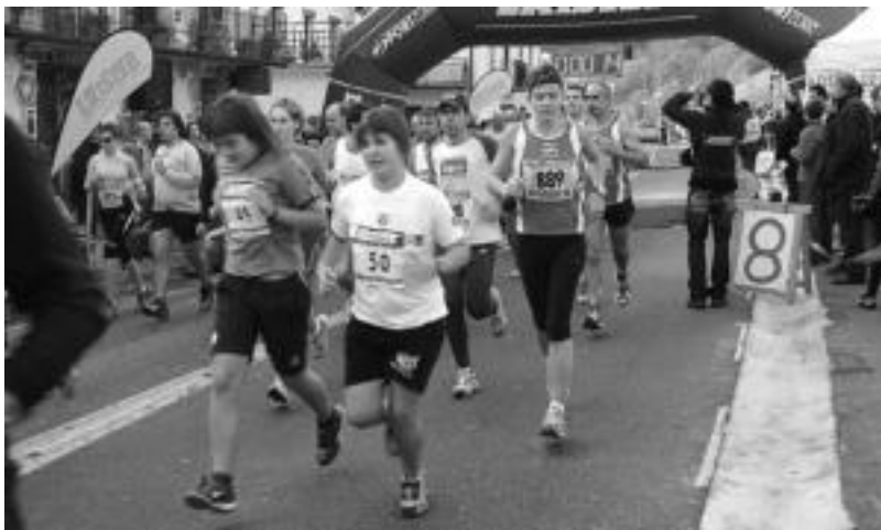
Ikaztegiatiko Herri Krosean urtero 200 lagunek hartzen dute parte. Aurretik haurrena egiten ohi dute. HITZA