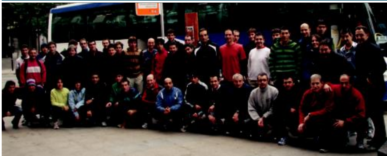
Tolosaldeko korrikalari asko Behobiara joateko urtero bezala autobusez egin zuten bidea. Irudian, autobusean sartu aurretik, lasterketa gunera iristeko irrikaz. JOXEMI SAIZAR

SAIOA 'Rogamar' diskokoak eta abesti ezagunenak izango dira 'Mundua Tolosan' ekimenaren baitako kontzertuan 4