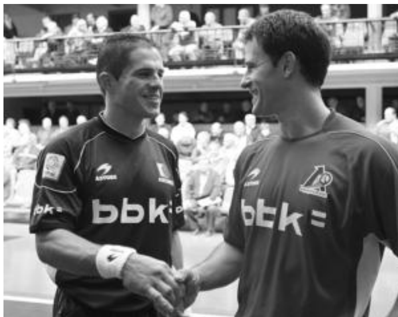
Barriolak eta Olaizola II.ak behin baino gehiagotan aritu dira elkarren aurka, lau t'erdian. MADDI SOROA

Sailkapenean, bigarrenak Aste honetako partida eta gero, al diz, Aurrera eta Cantolagua bigarren doaz, 20 puntuekin. Datorren ingandean Ansoaingo Gazte Berriak taldearen aurka ariko dira.