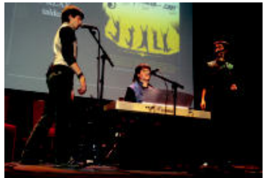
T-Klax taldekoak Antzoki Zaharreko saioaren une batean. EU NOSELLAS

Musika • Lizartzako eta Tolosako bikoteak bere mailan lehenengo postua lortu zuten Gipuzkoako Kantu Txapelketan