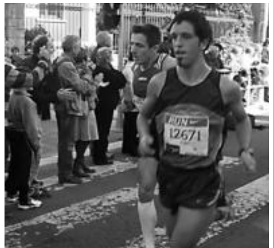
Eskualdeko korrikalariak Behobia-Donostian. A. OTEZABAL

Emakumezkoetan, berriz, Loitzun Artola ibartarra izan da eskualdeko azkarrena. Bere denbora ordu bat, 26 minutu eta 48 segundokoak izan zuen.