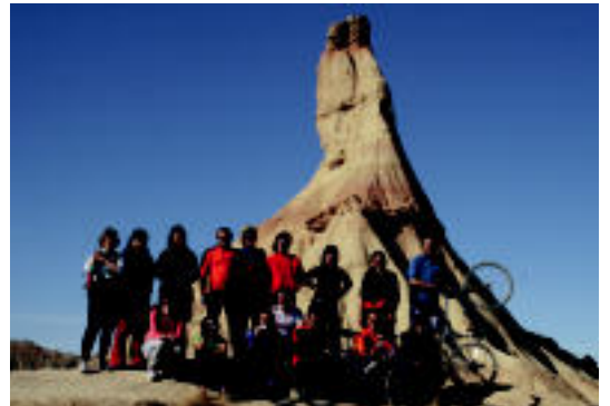
Indio zaharrak sasoian zegoela erakutsi zuen. Aldamenean, «tribu» guztia Lurrezko Gazteluaren babesean. A. IMAZ