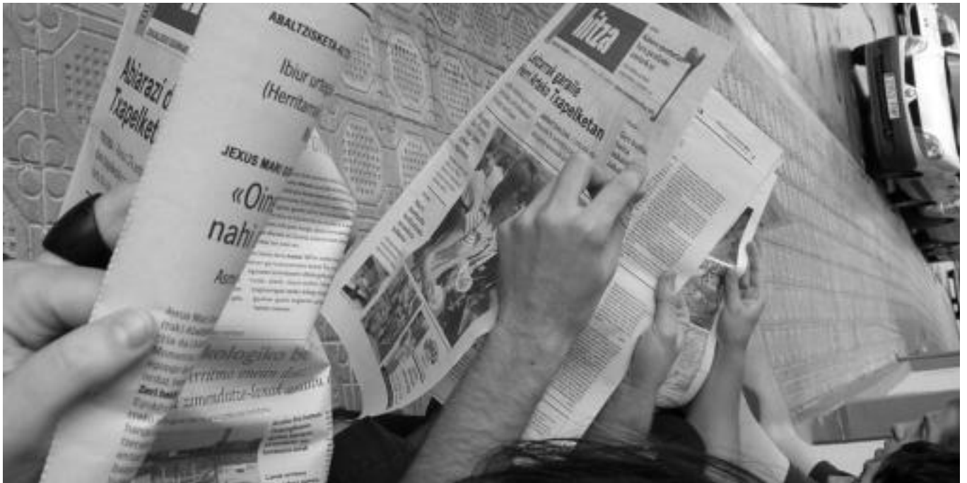
Gaurtik aurrera, egunkaria egiteko modua aldatu egingo da HITZAren erredakzioan, eta itxura berria izango dute bai papereko edizioak eta baita webguneak ere. NEREA URBIZU