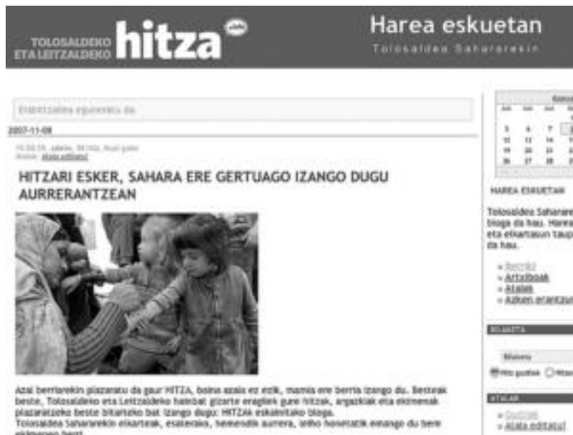
Toლოსaldeko eta Leitzaaldeko hainbat gizarte eragilek bloga izango dute gaurtik aurrera HITZAren webgunean. HITZA

maiztasun zehatz batekin aritzeko beharrik ez du eskatzen atal honetarako, eta nahi duenak nahi duenean sar dezake albiste, argazki edo bideo bat atal honetan, erakutsi edo salatu nahi duena argitaratzeko.