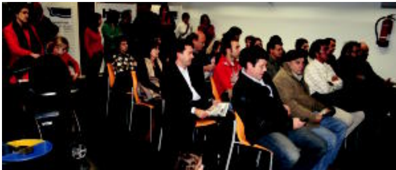
Eskualdeko udalen ordezkariak, euskalgintzako kideak eta gizarte eragileak elkartu ziren atzo aurkezpenean. A. IMAZ