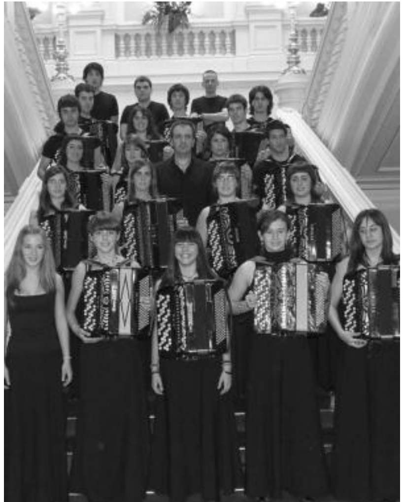
Praga Nazioarteko Akordeoi Orkestra Lehiaketan parte hartu zuen taldea. HITZA

Azken hilabeteetan egin dako lan handiarekin lortu duten esker onak Tolosaldean musikari handiak daudela erakusteaz gain, gozoz eta ilusioz aritzearen garrantzia agerian utzi dute.