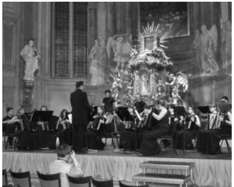
Pragan bertan, lehiaketaren aurreko egunean, eskaini zuten kontzertua eliza dotore batean. HITZA