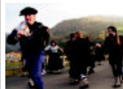
Kalejira egin zuten gazteek.

TOLOSA 27 urtez musika eskolako irakaslea izan eta gero agur esan dio lanbideari 5