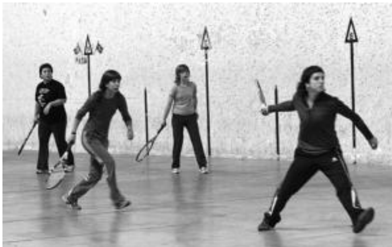
Mutilak eta neskek ariko dira aurten ere Berrobiko Frontenis Txapelketaren baitan. MADDI SOROA

Mutilek banaka eta binaka jokatuko dute eta neskek binaka, abenduaren 7an erabakiko den Frontenis Txapelketan