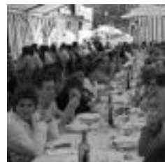
Babarrun jatea plazan. HITZA

Aurtengoan, bi harakinek hildako txerria nola zaitzen den erakutsiko dute eguer-