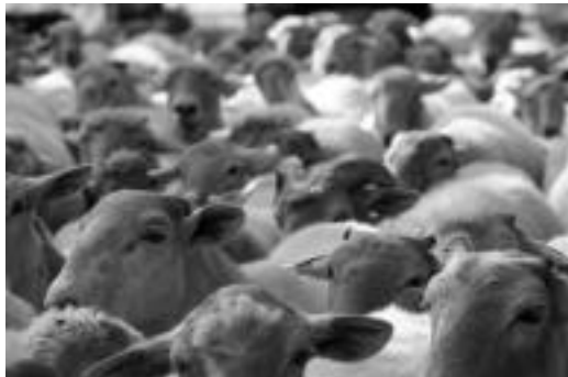
Artalde bat Bedaio inguruan. IÑIGO TERRADILLOS

mingain urdinaren gaitza ezagutu. Komunikabideen bidez jakin du ez duela pertsonengan eraginik. Hala ere, uste du kontsumoa jaitsi daitekeela, erosleen mesfidantzarengatik. Bestalde, Foru Aldunditik esan dute txertoak jarriko dizkietela abereei, baina horren berri ere komunikabideetatik jaso dute baserritarrek.