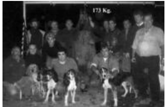
173 kiloko basurdea ehizatu zuen ehiztari taldea, joan den ostegunean, zakurrekin. HITZA

Basurde honekin txorixoak egitea pentsatu dute, eta ehiztarien artean banatuko dute guztia.