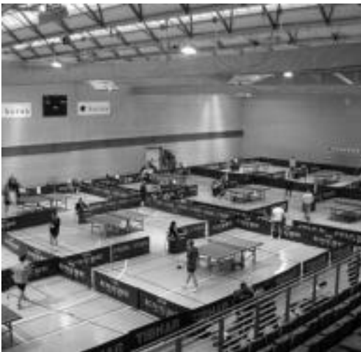
Adin guztietako 50 jokalarik hartu dute parte. TXEMA ARMENTIA

Antolakuntza eta parte-hartze aldetik «oso arrakastatsua» izan da txapelketa