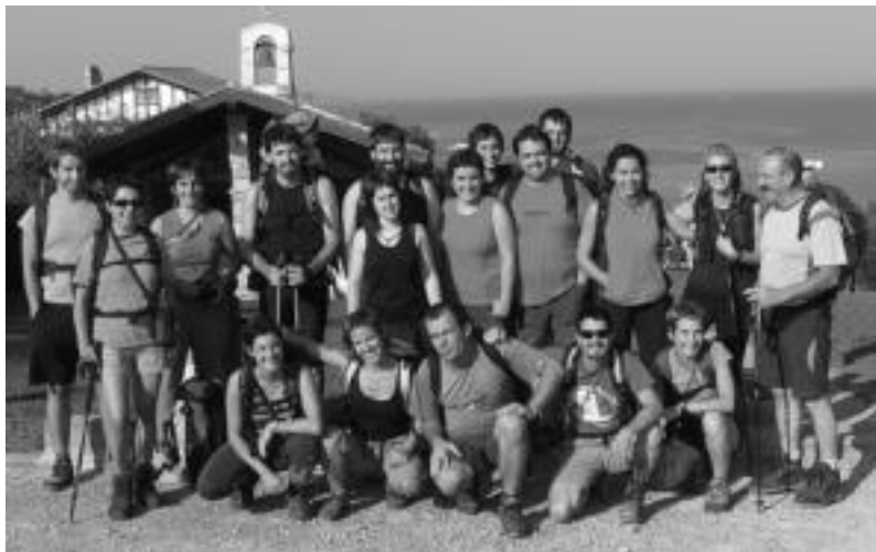
Haitzetan Raju eta Bai Euskal Herriari taldeek lehen irteera Lapurdiko kostaldera egin zuten irailean. HITZA

Herriko bi taldek elkarlanean egun pasa antolatu dute 'Euskal Herria ezagutzuz, Lurraldetasuna sustatuz' lelopean