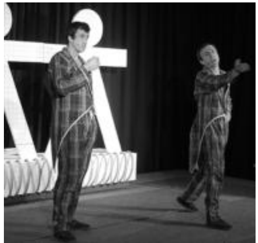
Ez dok hiru taldeak Larru haizetara obra antzeztuko du. JOXEMI SAIZAR

Amasako Kultur Etxean egin diren ekitaldiek ondorengoa eman dute: Klima aldaketa eta etxebizitza hitzaldira 15 lagun