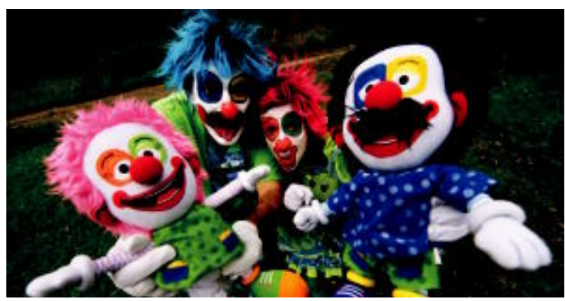
Pirritx eta Porrotx bezain alaiak dira pailazoen panpinak.

TOLOSALDEA-LEITZALDEA ▶ HITZAren eskutik, Pirritx eta Porrotx pailazoen panpinak eta 'Mari Motots' ikuskizunaren DVDa eskuratzeko aukera izango da