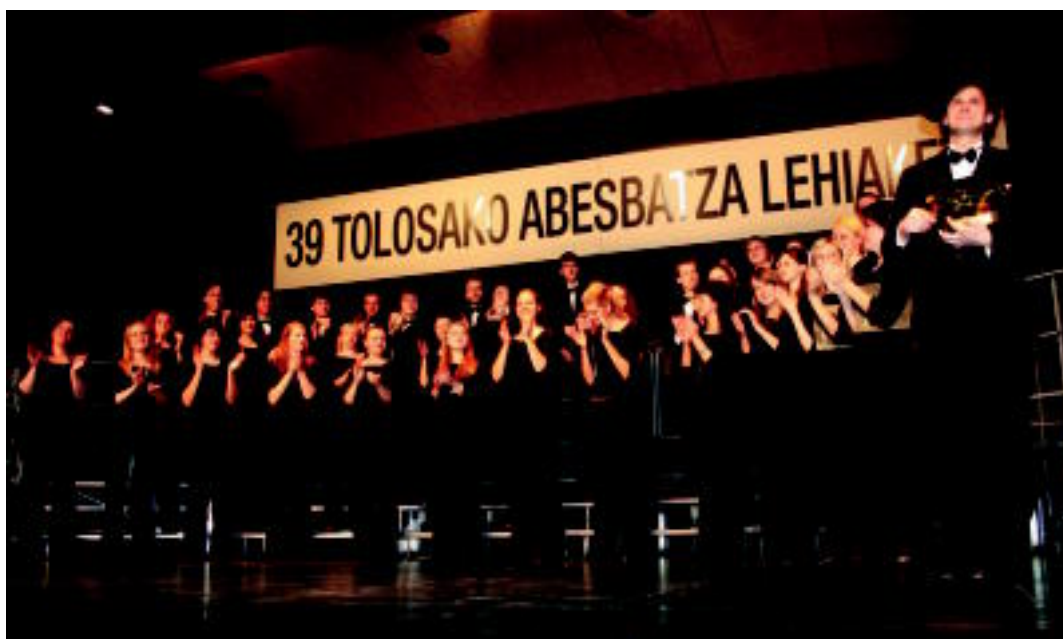
Letoniako Mixed Choir of Latvian Academy of Music abesbatza, saria jasotzerakoan.