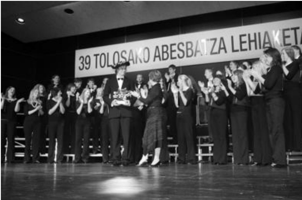
Letoniako Mixed Choir Of Latvian Academy of Music-ek irabazi du Tolosako 39. Abesbatza Lehiaketa; irudian, saria jasotzen. ANDER OTEZABAL

Mixed Choir of Latvian Academy of Music abesbatza 1945ean eratu zen, bere abeslariak Letoniako Musika Akademiako abesbatza zuzendari-zako eta musika pedagogiako departamentutako ikasleak dira. Abesbatzaren helburua Letoniako haur eta heldu abesbatzetako liderrak izango diren abesbatzetako abeslari gazteak osatzea da.