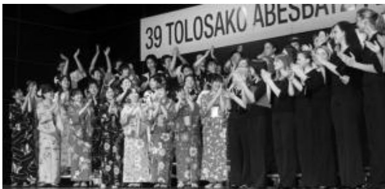
Ahots nahasietan, Polifonia atalean Letoniako eta Japoniako abesbatzek irabazi zuten. ANDER OTEZABAL

09:30ean hasiko da eta goiz osoan zehar jokatuko dute. Antolatzaileek txapelketa honetan parte har dezaten dei egiten die inguruko xake zale-tuei. Jokatuko nahi duenak nahikoa du igandean Urdiña-Txiki hurbiltzearekin. <<