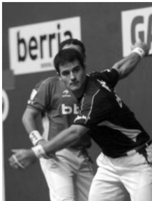
Barriola, igandeko partidaren une batean.

Horrelako garaipena lortu ondoren konfiantza askorekin aurre egiten dio txapelketari leitzarrek. Hurrengo partida Olaizolaren aurka izango da. Honek Irujori irabazi zion eta orain bi pelotarietako ligaxkako burua lortzeko jokatu dute.