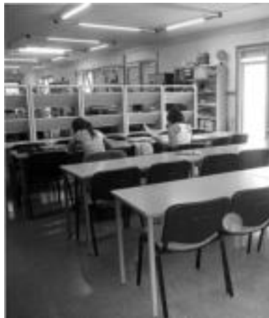
Ikasteko txokoa. Liburutegiaren bukaeran ikasteko txokoa dago, erakustoki batzuegandik bereizituta. Eskolako lanak eta talde lanak egiteko ikasleak txoko honetan biltzen dira. N. GARZIA