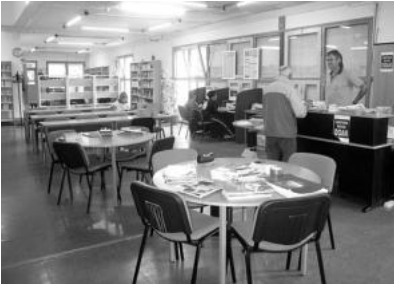
Mailegia. Liburutegia hiru zatitan banatuta dago: umeen txokoa, liburuak eskatzeko gunea, eta ikasteko txokoa. Liburuak eskatzeko gunea erdialdean dago. Bertan liburuen inguruko informazioa ere eskatu daiteke, edo aldizkariak begiratu. Erabiltzaileentzako 2 ordenagailuak ere hor daude. N. GARZIA