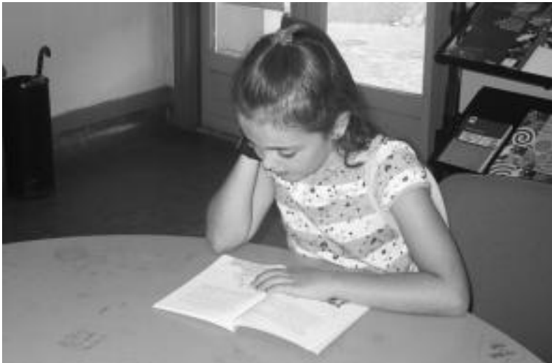
Gazteek zaharrek baino gehiago irakurtzen dutela dio Huarte liburutegiko arduradunak. N. G.

Nafarroako Gobernuak. «2 ordenagailuetara ohitu gara, batzuetan jendeak zain egon behar izaten duen arren».