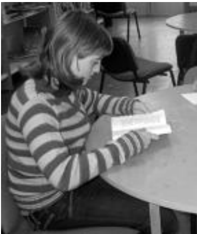
Haurren txokoa. Liburutegian sartu eta lehenengo zatia haurren txokoa delakoa da, eta bertan haurrek haientzako egokiak diren liburu eta aldizkariak eskuragarri dituzte. N. GARZIA