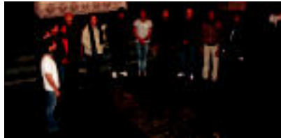
Cameraata Vocale Sine Nominis ahots taldea, Santa Klaran entzagetan. N. URIBU