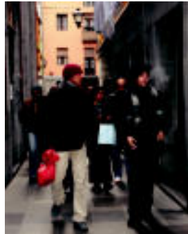
Kubatarrak Tolosako kaleetan zehar, entsegura bidan. N. URIBU