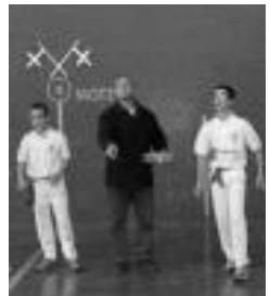
Nafar Jokoak, Leitza. HITZA

ketari dagokionez, bertan larunbatean eta igandean jokatu zituzten 4 partidak ere irabazi egin zituzten.