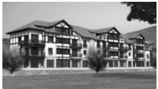
Orendaingo etxebizitzaren itxura, atzeko aldetik.

Sustapen hau kooperatiba-erregimenean egingo da, eta Arrasateko Arrasate Inbertsioak eta zerbitzuak gestoretzak kudeatuko du. Etxebizitzetako adjudikaziodunak hautatutakoan, kooperatibako kide izatera igaroko dira, eta kide guztien artean zuzendaritza-batza osatuko da. Jauregialde kooperatiba izango da etxebizitzasustapen honen enpresa sustatzailea, eta etxebizitzek Orendaingo Udalak bideratutako prezio tasatua izango dute. Etxe-sustapen hau Kutzak finantzatuko du, eta ordaintzeko baldintzak adjudikazio guztiek ordaindu ahal izateko modukoak izango dira.