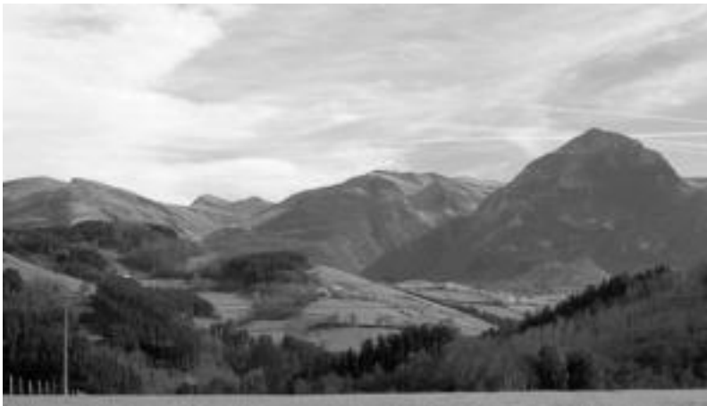
Orendaindik ikusten den ikuspegi ederra. Etxebizitza berriak Eskolapioetako egoitza zaharra dagoen lekuan eraikiko dituzte. N. URBIZU

Eskolapioetan, udaletxearen atzealdean udaberria aldera 19 etxebizitza tasatu egin behar dituzte; izena emateko epea abenduaren 31n bukatzen da