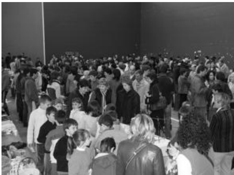
Iragan urteko Kultur Asteko azken egunean azoka jendetsua egin zuten Berastegin. INEREA LIZARTZA

Hilaren 9tik 18ra ospatuko duten arren, Gaztainondo Elkartearen onddoen erakusketa egongo da hilaren 5etik 11ra