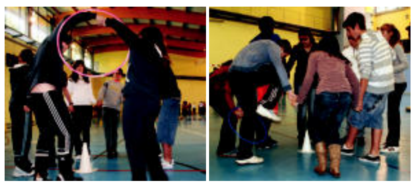
Eskuak askatu gabe taldeko guztien arteko uztai pasatzea izan zen jolasetako bat. I. GARCIA

ANOETA ▶ Xiba proiektuaren baitan, Anoetako Ikastolako, Tolosako Hirukide eskolako eta Alegiko Aralar Institutuko DBH3ko ikasleak jolasean aritu dira