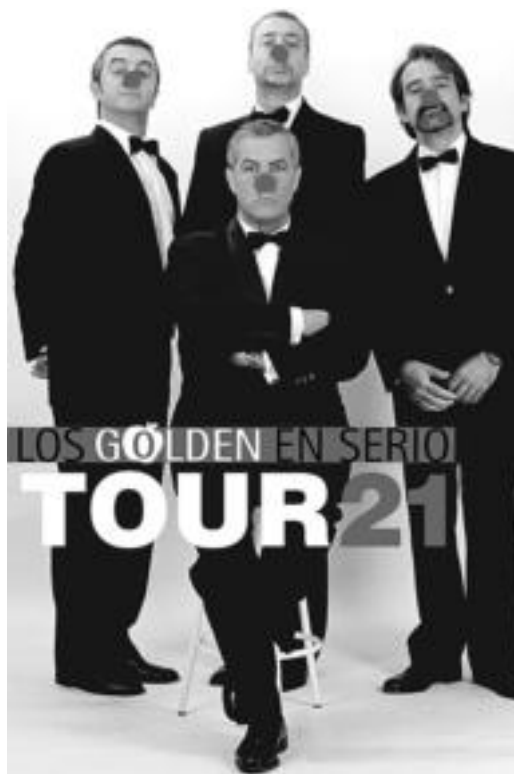
Golden Apple Quartet taldearen bira berriaren kartela. HITZA

Beraien errepertorieta nota nagusia Godspell musika (beltz izpirituala) zen, horrekin hasi zuten bere musika ibilbidea; beranduago estilo guztietako eta ikuslego guztientzako emanaldiekin zabaldu zuten. Argiz eta soinuz betetako beraien emanaldietan, umorea batetik bestera gailentzen da. Entzulegoaren arrakasta handiarekin kontaktzen dute eta diotenez, beraien dira harritzen diren lehenak.