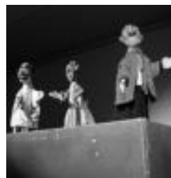
lazio Titirijai.

Zine foruma. ▶ Los climas , azaroaren 8an. ▶ Muerte en venecia , azaroaren 15ean. ▶ Esto es ritmo , azaroak 22. Zinema. ▶ Sin reservas , azaroaren 9tik 12ra. ▶ Promesas del este , azaroaren 16tik 19ra. ▶ Tinko , azaroaren 19an. Haurrentzako zinema. ▶ Erase una vez... un cuento al reves , azaroaren 11n, 17:00etan. ▶ Lassie , azaroaren 18an. Antzerkia. El jefe de todo esto , azaroaren 10ean, estreinaldia. Mundua Tolosan. ▶ Cesaria Evoraren kontzertua, azaroaren 13an. ▶ Carlos Nuñez , azaroak 23. Sentsibilizazio Astea. Azaroaren 16 eta 17an, Gaingaitzen elkarteak antolatuta. Nazioarteko Txotxongilo