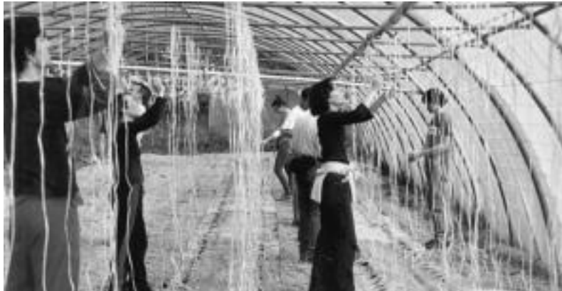
Aurreko ikasturte batean ikasleak negutegi batean praktikak egiten. HITZA

Ikastaro trinkoa da, hau da, 360 ordukoa. 250 euro ordaindu behar dira ikastaroa egiteko. Hainbat baserriar ekologikoekin harremana egiteko aukera izango dute ikasleek, beraien lurretara joango baitira klaseak hartzera. Beste kla-