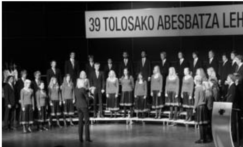
Suediako Stockholms Musikgymnasiums Kammarkör taldea, atzo Leidor aretoan. ESTI EZEIZA

Haurren abesbatzak izango dira gaur goizean entzungai; arratsaldean folklore eta polifonia ataleko saioa izango da