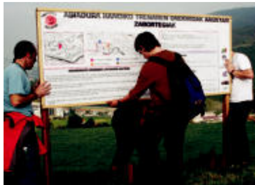
Informazio panelak jartzen kalteak jasoko dituzten eremuetan. HITZA