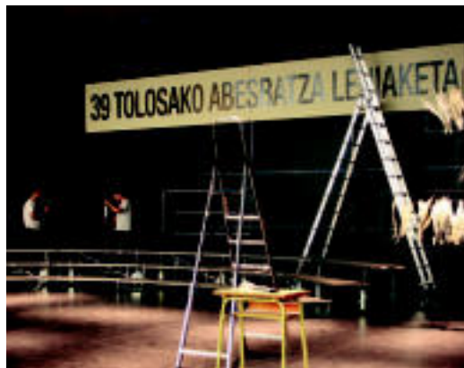
Azken ukituak eman dizkiote Leidorri; konba akustikoa jarri dute. i. r.

KALITATEA ▶ lazko mailari eustea izango da TEEren helburua ▶ 2-3