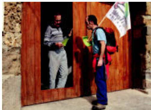
Baserrietan informazioa zabaltzen izan dira.