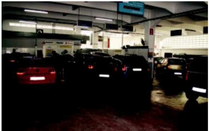
Autoak taller batean ilaran, egun hauetako zubiaren aurretik azken ukituak jasoz. ASIER IMAZ

Kia, Hunday...? Marka horiek bigarren mailan uzten ditut.