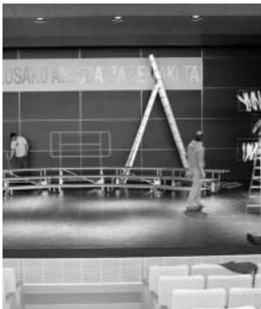
Kontxa akustikoa ipini dute Leidor antzokian.