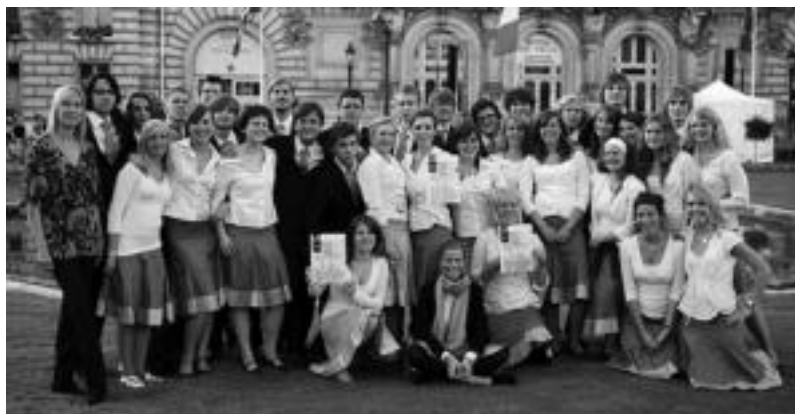
Suediatik dator, gaur ariko den Stockholms Musikgymnasiums Kammarkör abesbatza. HITZA