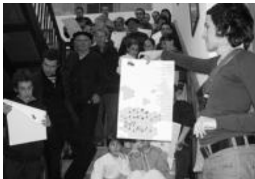
Herenegun egindako aurkezpenean, kartela erakusten.