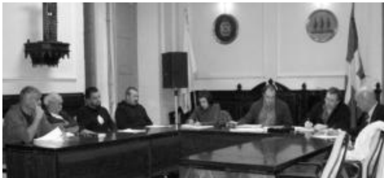
Herenegungo osoko bilkuran PSE-EEren zinegotziak bakarrik eman zuten mozioaren kontrako bozka. n. u.

AHTren aurkako jarrera erakutsiz eta arrazoituz, hainbat konpromiso hartu ditu «herritarren borondatea betetzeko»