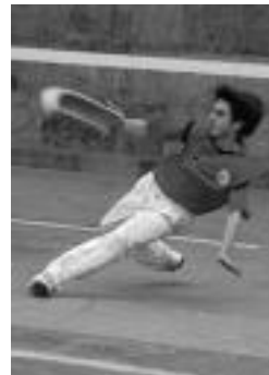
Iazko finaleko irudi bat.

Iazko bi finalistak elkar ikusiko dute berriro ere aurtengo finalean. Txapelketako antolazaleek azaltzen dutenez, gaur egun antolatu daitekeen errebote partidarik onenetakoa da bihar bi talde horiek jokatu dutena, punta-puntan baita biltza azken urteotan. Kapito Harri taldea izan zen iazko ezusteko txapelduna, Luzeaz Gazte faboritoari 13-5 irabazi eta gero.