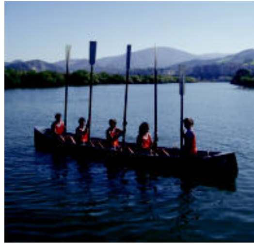
Hirukideko batel irabazlea.

TOLOSA ▶ Pio Baroja II. Bandera jokatu zuten pasa den igandean; Orixek eta Hirukidek parte hartu zuten; Hirukidekoak izan ziren garaile