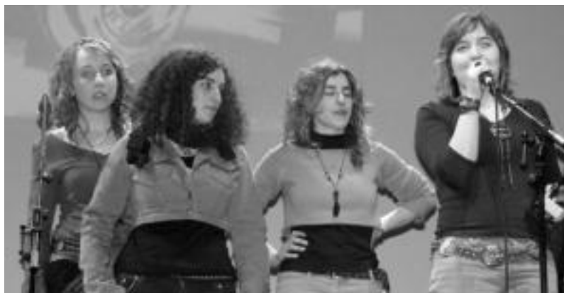
Zugarramurdi taldeak irabazi zuen lehenengo urtean bere kategorian. Kideetako bat Amasakoa da. HITZA

Lehenengo kanporaketa joan den larunbatean egin eta gero, bigarrena gaur izango da, Gurea Aretoan, 18:00etan