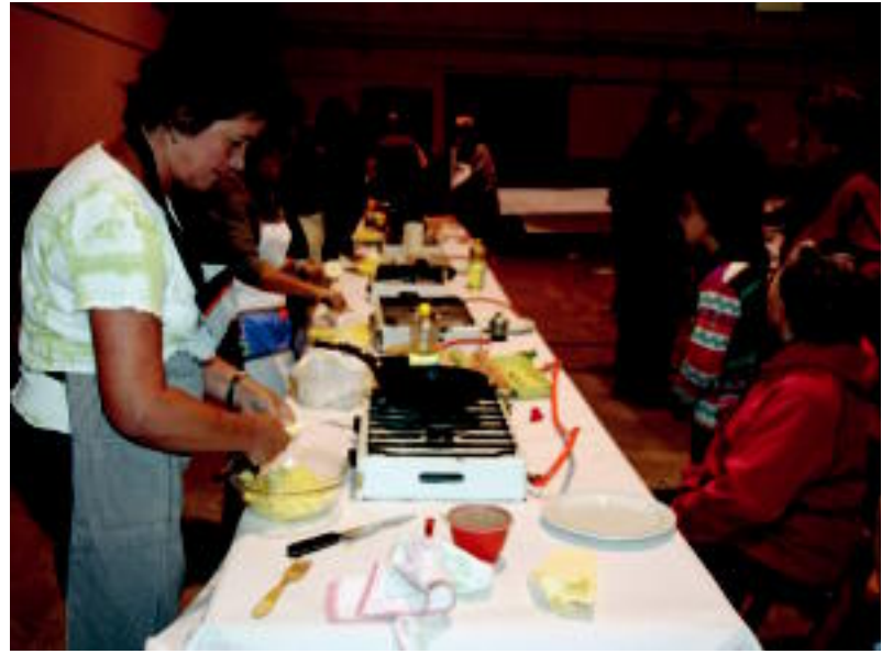
12 patata tortilla inguru prestatu zituzten. Ikusleak ere izan ziren, usaina areagotuz, gero eta gehiago. N. U.

TOLOSA ▶ Ttonttor elkarteak antolatutako XX. Kultur Astea aurrera doa; gaur, bihar eta etzi ere izango dituzte ekitaldi ugari