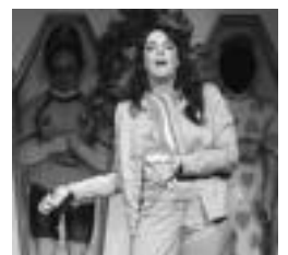
Antzezlanaren une bat. HITZA

mal... que marido ya tuve antzezlanarekin zera gertatu zaigu, ezin izan dugula alde batera utzi, jendeak eskatu egiten baitugu». Honela, aurten beste antzezlan bat estreinatu duten arren, hainbat lekutan oraindik ere hau eskatzen diete. «Aktoreak dagoeneko oso eroso daude antzezlan honekin eta beti aretoa betetzen dugu».