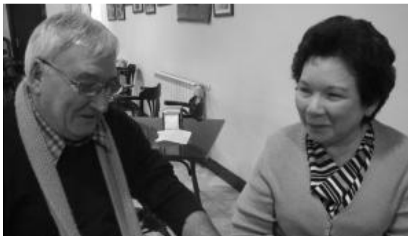
Pako Larrañagaren gurasoak Alegiara etorri ziren, egin zuten bidaia aprobetxatuz. I. TERRADILLOS

Filipinetako ituna onetsi du Espainiako ganberak, alegiar jatorriko presoari Espainiako kartzeletako araudia aplikatuz