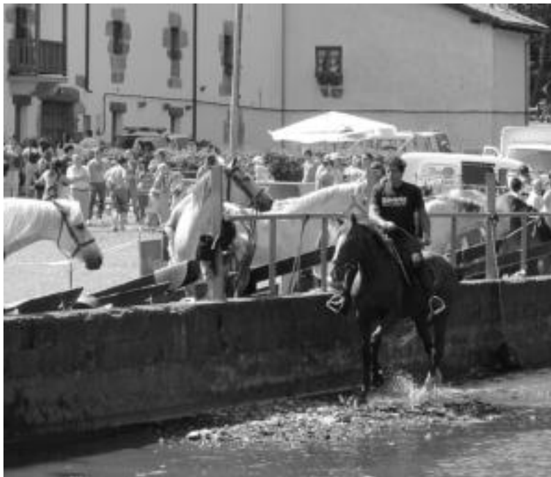
Aurrera Perra Taldeak hainbat ekitaldi antolatzen ditu urtero, argazkian azkeneko Zaldi Eguna. ESTI EZEIZA

09:00etan abiatuko dira Inguruartetik, eta Goizuetara 13:00a aldera iristeko asmoa dute; bazkaldu ondoren itzuliko dira, 20:00a aldera Leitza egoteko