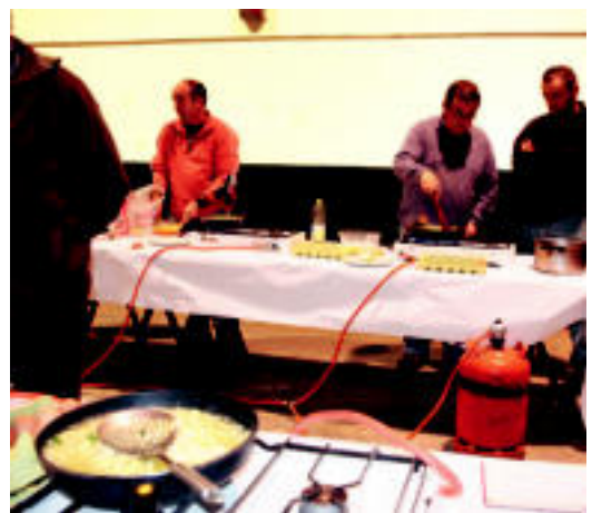
Patata tortillak, gutxinaka itxura hartzen. N. URBIZU