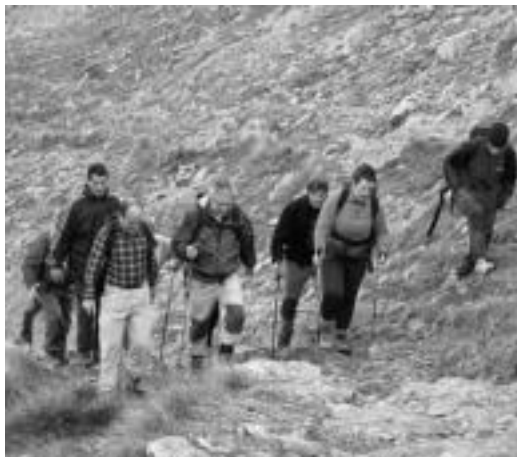
Pasa den urteko Mendi Asteko une bat.

Ostiralean eta larunbatean ikastarok eta klase praktikok izango dute lekua. Ostiralean mendiko medikuntza eta mendi sorospenei buruzko doako ikastaroa izango da, udal txean bertan. Euskaraz emango dute, eta kiroldegian (943 65 13 33) eman ahalako da izena hilaren 24ra arte. Larunbatean, bestalde, eskalada saio praktikoa egingo dute Santa Barbaran (Hernani). Hau ere doakoa izango da. Edonork har dezake parte, gaztetxoek (10 urtetik aurrera), gazteek eta helduek.