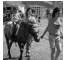
Egun-pasa egingen dute. E. EZEIZA