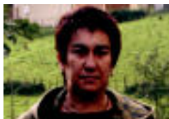
Agirre eta Adurriaga. A. IMAZ