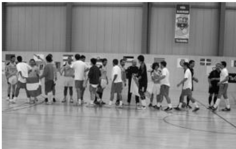
Andaluzia eta Galiziako jokalariek elkarri eskua emanaz finalerdietako bigarren partidan. ASIER IMAZ

12:00etan jokatuko dute finala; aurretik, hirugarren eta laugarren postuak 10:30ean jokatuko dituzte, Usabalen