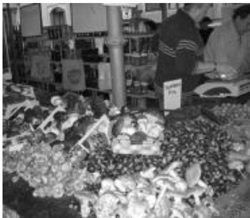
Perretxikoez merkatuko izar izaten jarraitzen dute oraindik. P. ALBERDI