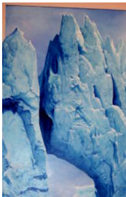
Aranburu Jauregian inauguratu zuten atzo arratsaldean Ipuinartean II erakusketa. Eskubiko argazkikoa bezalako lanak daude ikusgai. A. MAIZ