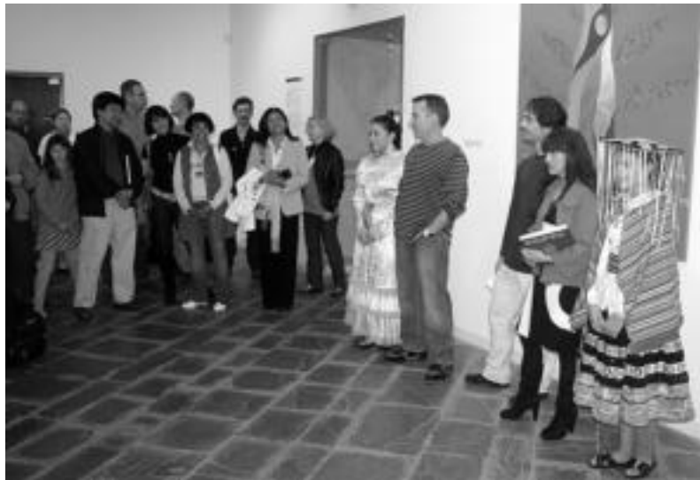
Jende ugari bildu zen atzo Aranburu Jauregian inaugurazio ekitaldian. ASIER IMAZ

‘Ipuinartean II’ kulturaniztasuna bultzatzea helburu duen erakusketa eta liburua aurkeztu zituzten atzo arratsaldean