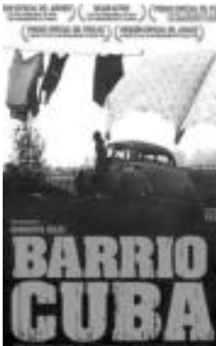
Barrio Cuba filma. HITZA

Film laburrak eta luzeak ostegunera arte ikusi ahalko dira, 20:00etan, dohainik