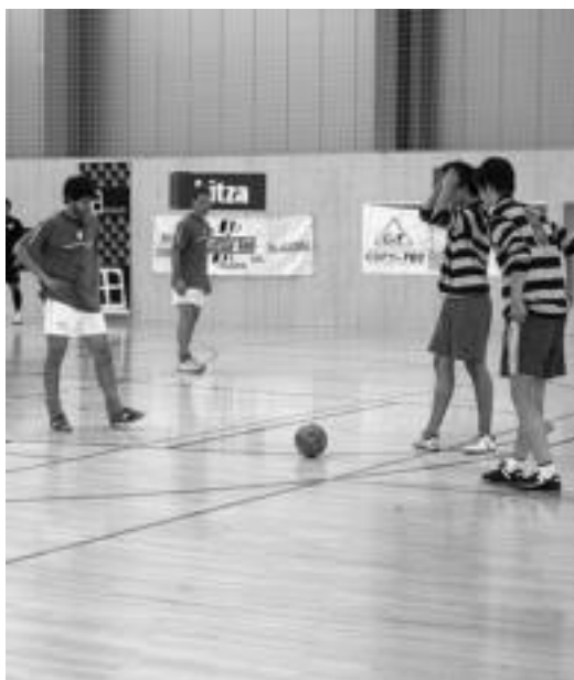
Euskal Herriaren aurka, Pakistaneko bi jokalarik falta jautzeaz. A. IMAZ

Adiskidetasun Txapelketaren irabazlea eta lehen laurak nortzuk izan diren, gaur erabakiko da. Lehen partida, 10:30ean jokatuko dute. Bertan Extrema-