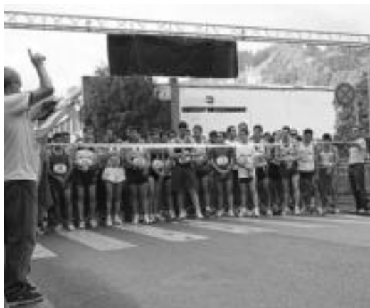
Joan den urtean 416 korrikalari atera ziren Herri Krosan. M. SORGA

Azpimarratzekoak, aurten, Tolosako XX. Herri Krosa eta Ogiyik karri etzun semia antzezlan dira. Biharko Herri Krosa aurten San Blasera behin igoko da. Izena Shanti kirolak dendan edo lasterketan bertan 11:00ak baino lehen eman behar da eta guztira 10 kilometro egin behar dira.