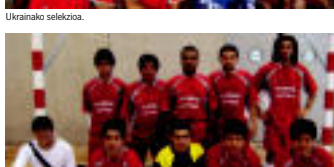
Esperanza latina selekzioa.