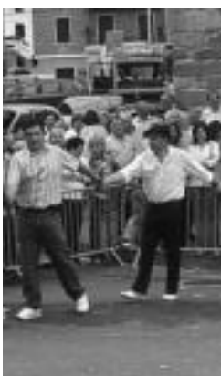
Helduentzako dantza ikastaroa izango da Alegian. HITZA

Alegiko dantza taldeak helduentzako euskal dantza ikastaroa antolatu du. Bertan, Fandango, Arin-Arin eta beste hainbat dantza ikasiko dituzte helduek. Asteartero 19:00etatik 20:00ak arte izango dira klaseak eta izenematea Kultur Etxean egin behar da hilak 20a baino lehen. Ikastaroaren lehenengo eguna hilak 23a, asteartea, izango da.