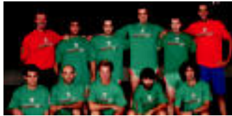
Euskal Herriko selekzioa.

Urriak 12-13-14 (bihar, etzi eta igandea).