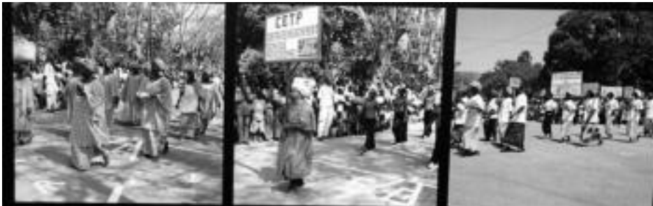
Argazki eta testuen bitartez, emakumeen hainbat arlotan duten parte-hartzearen berri jaso daiteke erakusketan. HITZA