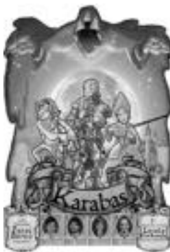
Karabas ipuin musikala.

Taldearen lehen proposamena Galipotx izeneko obra izan zen eta izugarritzko arrakasta lortu zuten. 15.000 ume, gura-