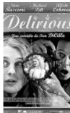
Delirious filmeko kartela.

Erligioaren bi ordeko post-modernoek, kirol ospeak eta ospe artistikoek alegia, abeslarienganako eta aktoreenganako lilura ia mistikoen inguruan hausnartzera eramaten dute zuzendaria. Gidoi azkarreko filma da Delirious , erantzun bizkorrez josia. Halaber, oso eszenaratzeko bizia du, soinu-banda hunkigarria eta ak-