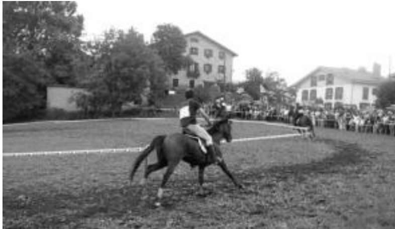
laz jende ugari joan zen zaldi lasterketa ikustera. I. GARCIA

Sari nagusia jasotzeko talde horretan izango da Kastañares ere. Baina, esan bezala, ez da faborito argirik izango eta horrek interesa gehitzen dio probari. Bestalde, aipatzekoa da gero eta emakume gehia-