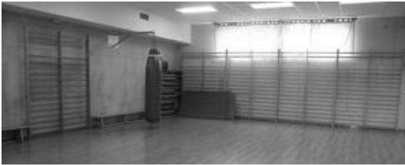
Yoga, pilates, mantentze-gimnastika eta horrelakoak gela honetan emanen dituzte.