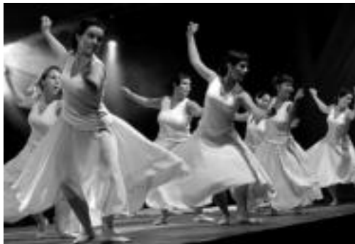
Alurr dantza taldeak bihar Iruran eskainiko du emanaldia. HITZA