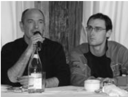
Egaña eta Arzallus ariko dira bertso afarian. I. AZPILIKUETA