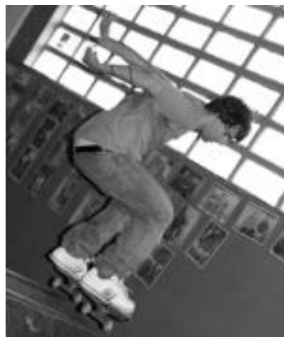
Gose taldearen kontzertua izango da urriaren 12an, eta 6. Skate txapelketa, 20an.