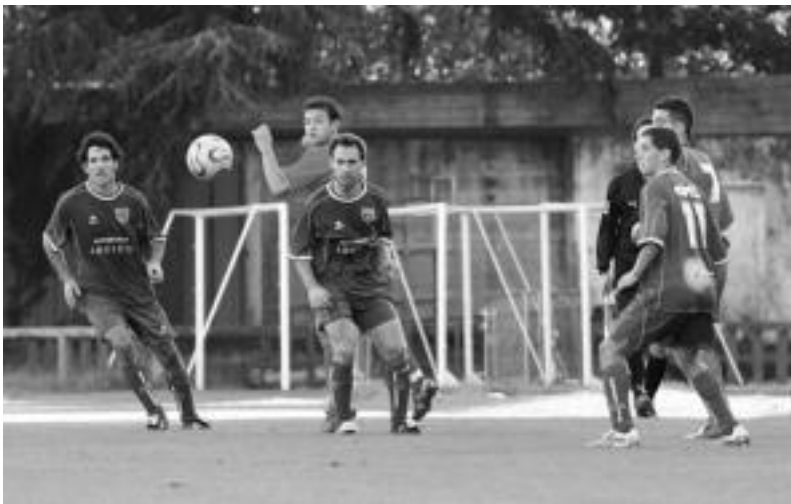
Tolosa CF taldeko jokalariek Berazubiko futbol zelaiaren jokaturako partida batean. M. SOROA

Mutilen taldeak 1-0 galdu zuen Zamudioaren aurka igandean; neskek berriz, 2-3 Zestoaren kontra, larunbatean