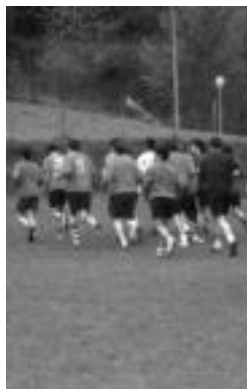
Aurrerakoak entrenatzen. n.g.

Aurtengo denboraldia hasi denetik 3 partida jokatu ditu Aurrerak, lehenengoa 1-0 galdu zuen (Lagunak taldearen aurka) eta bigarrenean berdindu egin zuen Amaia taldearen aurka (0-0). «Orain maila altua-