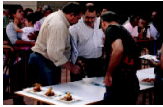
Lan zaila izan zuen epaimahaiak pintxo irabazlea hautatzerakoan. A.I.

▶ HITZAK ez du bere gain hartzen egunkarian adierazitako esanen eta irizien erantzukizunik.