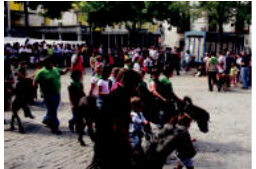
Gorritiren animaliek in aritu ziren gazteboenak jolasean. A. OTEZABAL