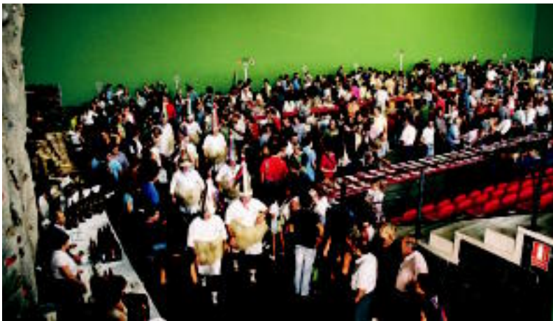
Asteasuko frontoian «giro ona» izan zen egun guztian zehar joaldunek lagunduta.