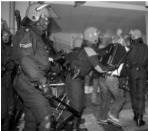
Ertzaintza jendea bultzaka banandu nahian.

Ertzainek porrekin hainbat lagun jo zituzten larunbatean, haietako bati buruan zauria egin zioten, «hiru grapa jarri behar izan zizkiotelarik»