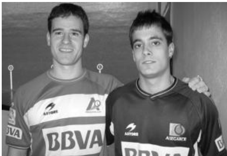
Arrabola, zikloia... eta horrelakoak izan dira hedabideetan pilotarietaz hitz egiteko aukeratutako irudiak.