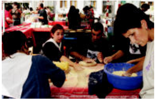
Talo postuak ere ez ziren faltatu azokan. A. IMAZ