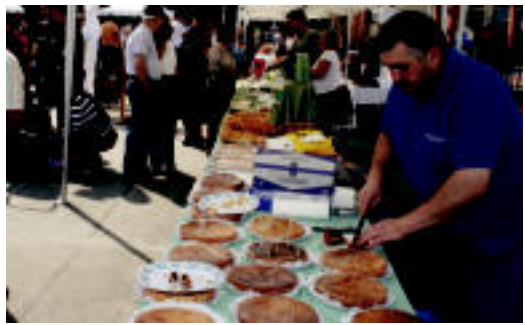
Artisau postuez gain, gozogintza landu zuenik ere izan zen. A. IMAZ

P ipar usainak hartu zuen herenegun Ibarra. Egun osoan zehar herri txokotan postu ezberdinak jarri zituzten, protagonista nagusia Ibarra piparra izan zelarik. Eguraldia lagun zutela, jende ugari hurbildu zen herrira, bertako postuak-eta ikustera. Artisautza postuekin batera jakiak saltzen zituzten postuak izan ziren nagusi. Mokadutxoak dastatzeko aukera ere izan