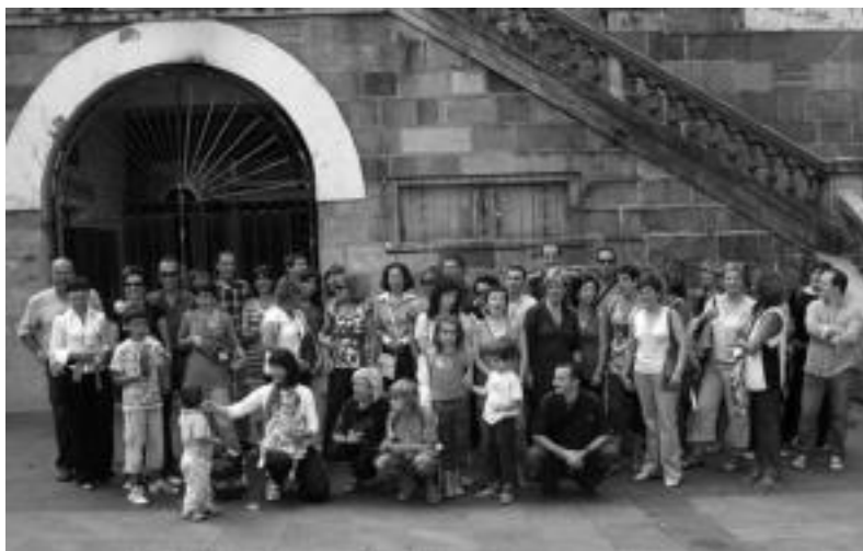
Jende ugari ibili zen kalejiran goizean zehar, Alde Zaharreko kaleak alaituz. HITZA

70 lagun inguru bildu ziren Zerkausian egin zuten bazkarian; Kultur Astea amaitu arren, ekitaldi gehiago ere izango dira