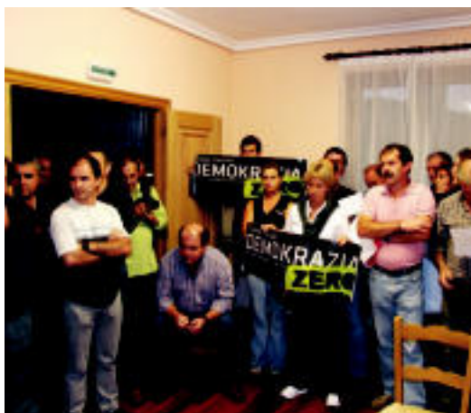
EAE-ANVn hartutako erabakia salatu zuen udalbatzarrean. HITZA

PROTESTA ▶ EAE-ANVren ordezkariak nahiz jarraitzaileak hartutako erabakia salatu zuten ▶ 6