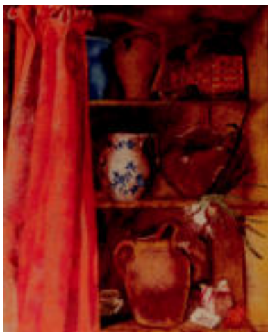
Upategi. Hainbat upategi ikus daitezke: batzuk jakiekin eta beste batzuk pitxarrekin. J. ALKORTA