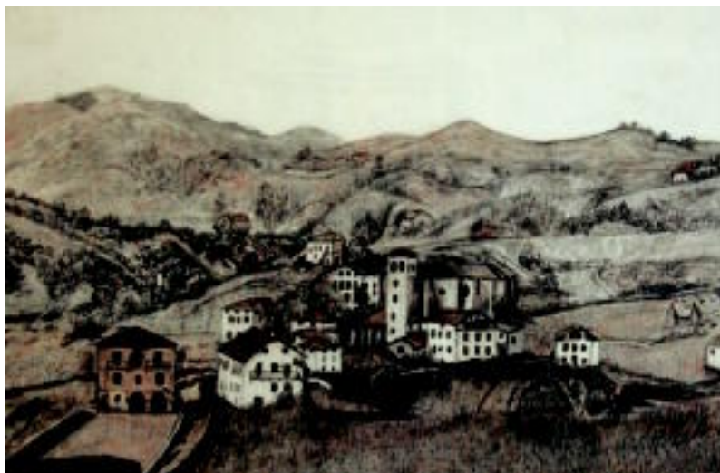
Ikatz-marrazkia. 1916. urteko Zizurkilgo ikuspegia irudikatu du Juani Alkortak. Egutegi batean ikusi zuen irudia eta hura arkatzarekin egin zuen, zuri-beltzean, alegia. J. ALKORTA