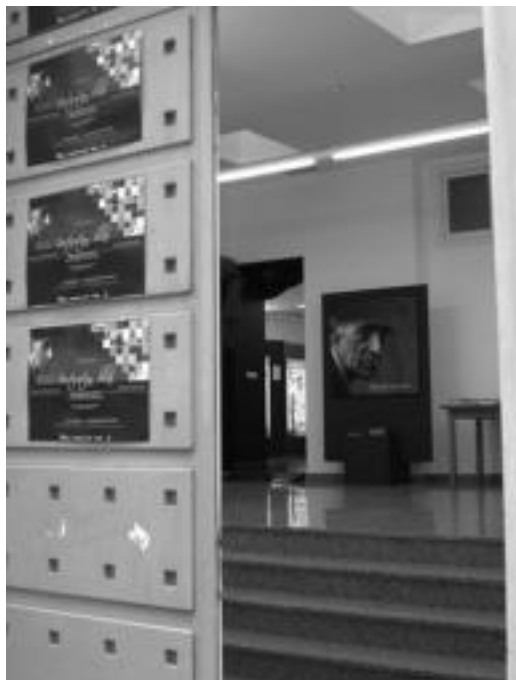
Iruñeko Tafalla Jauregian jarri dute erakusketa, kale Nagusian.