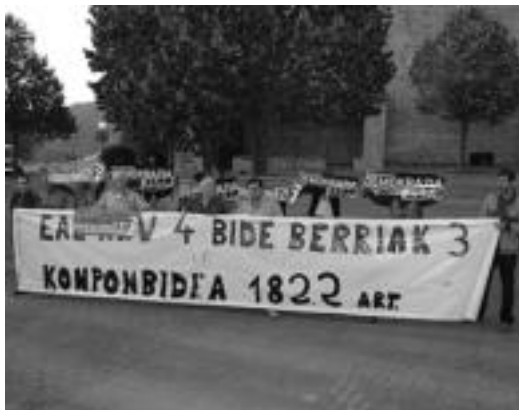
EAEk elkarretaratzea egin zuen udalbate kanpoan. HITZA