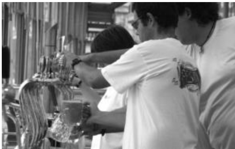
200 lagun aritu dira lanean garagardo azokan; argazkian, horietako bi, garagardoa zerbitzatzeko. ESTI EZEIZA