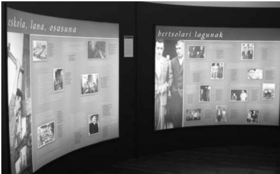
Erakusketa argazkian agertzen diren bezalako paneletan oinarritzen den arren, ikus-entzunezko materiala ere badago. N. GARZIA