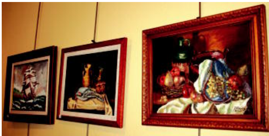
Erliebean. Pasta berezi batekin egin ditu hainbat margolan. Lana ematen du teknika honek, baina artistaren arabera ez da zaila berarentzat. Geruza asko behar ditu, eta lehortzen utzi behar zaio. Hala, margolana hiru dimentsiotan gelditzen da. J. A.