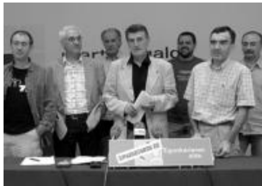
Maiatzean auzipetuek agerraldia egin zuten Espainiako Auzitegi Nazionalak hartutako erabakia gaitzesteko.