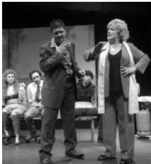
Lapur zuloa antzezlanoa une bat. HITZA

20:00etan hasiko da ikuskizuna; komedia beltza, garratza eta atsegina batzen ditu