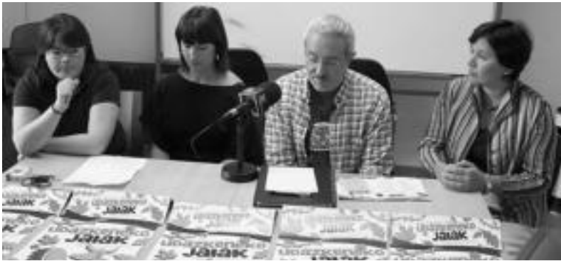
Alde Zaharra Dendak eta Ezpeletako kideak aurkezpenean.

Alde Zaharra Dendak eta Ezpeleta elkarteak antolatu dute; buruhandiak, dantzariak, txaranga eta afaria izango dira