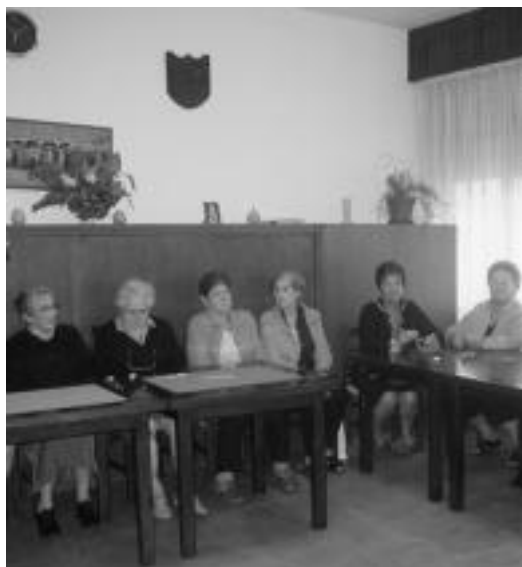
20 pertsonen parte hartuko dute ikastaroan. N. GARZIA

Zaintzailea. Etxeko lanak egin eta bi haur zaintzeko emakumea behar da. Goizeko 08:00etatik 15:00etara. Interesatuak deitu zenbaki honetara: 628 22 65 30.