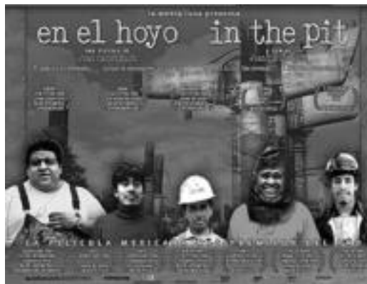
‘En el hoyo’ film mexikarreko irudietako bat eta kartela. HITZA