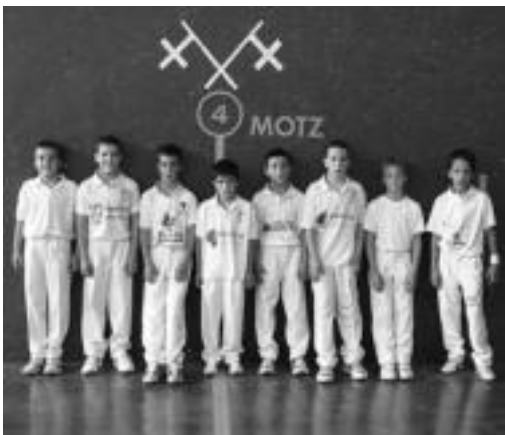
Hasiberri, benjamin eta haur-kategoriakoak lehiatu ziren. HITZA

Nagusi, kadete eta gazteen artekoak datorren asteburuan jokatuko dituzte