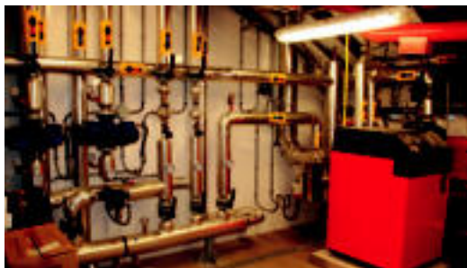
Gasaren bidezko berogailu berriaren instalazioak. I. GARCIA