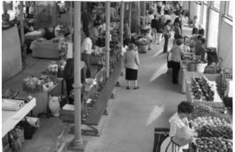
Gero eta jende gehiago ikusten da larunbatetako merkatuan, argazki kamera eskuetan duela.