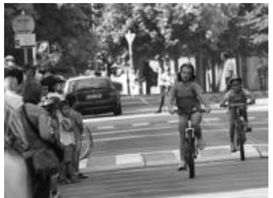
Ekintzei hasiera emanez, Pedal Eguna ospatu zen atzo Tolosan. I. T.

Tolosan eta Ibarrran gaur burutuko diren ekitaldiez gain, Asteasun ere izango da zerikusirik. Hala, 17:00etan, bizikletaren txekeoa egingo dute Kiroldegian.