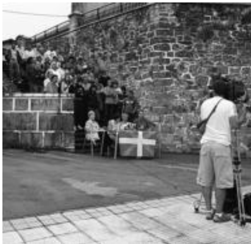
Lizartzako ezker abertzalearen prentsaurrekoa.

Herritar bat Auzitegi Nazionalan, «PPren agintarien bertsioarengatik epaituak» dutela salatu dute. «Urteetako kartzela zigorra eskatzen dute; herritarrak, bai prentsa bai zuzenean irainduak izan garenean. Herritar guztiak gara epaituak, gure hitza eta erabakiari erasotzen baitiote. Gure herrikide