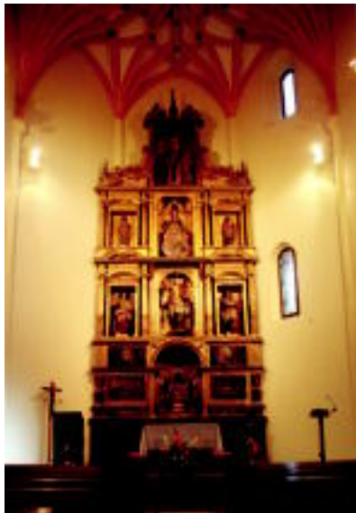
Elizari barrutik zein kanpotik berrikuntzak egin dizkote.

Eraikineren barnealdean, berogailu eta argi instalazio guztia aldatu dute. Orain gasaren bitartez funtzionatzen du berogailuak. Laster, argiak, berogailua eta kanpaiak ere ordenadore bidez erregulatu ahal izango dira. Elizaren behe solairuko egurra dena aldatu da eta zenbait harri berri jarri dituzte. Aldarearen alde batean dauden bi leihoak ireki dira ere. Sakristia ere erabat berritu da eta komuna ere jarri da. Goiko solairuan, museo txiki bat jarri dute elizak izandako irudiekin eta karraka zahar batekin, Ostiral Santuetan mezara deitzeko erabaltzen zena.