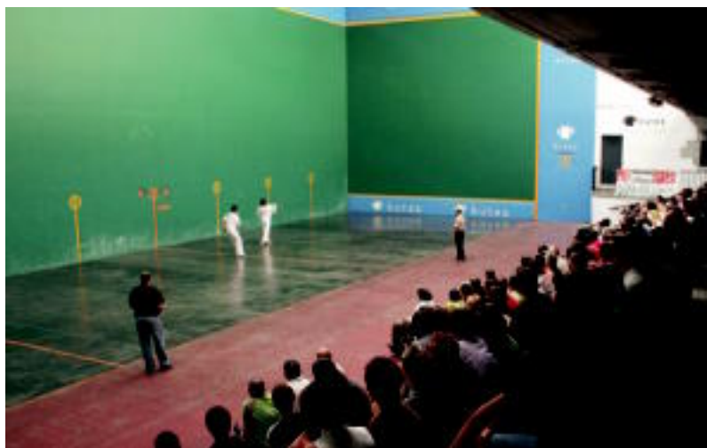
Herenegun Joxean Tolosa Pilota Txapelketako finaleko une bat.

AMEZKETA ▶ Antolatzaileek azaldutakoaren arabera, «aurtengo txapelketan ez da ezusteko handirik izan» ▶ 5