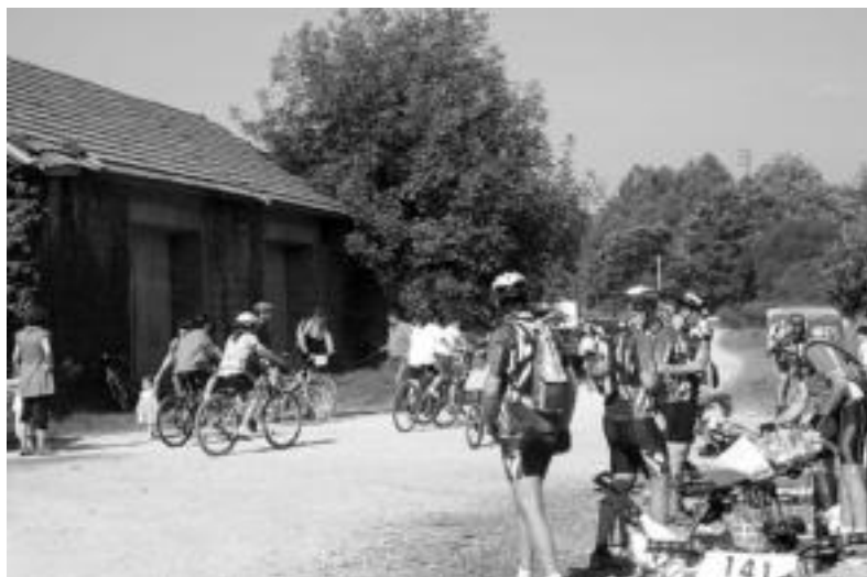
Txirrindulan ibilbiderik luzeena 40 kilometrokoa izan zen, Andoaindik Lekunberrira doana. ANDER OTEZABAL

Maratoiean eta bizikleta martxan parte hartzeko aurretik izena eman zuten parte-hartzaileen kopurua bikoiztu zen