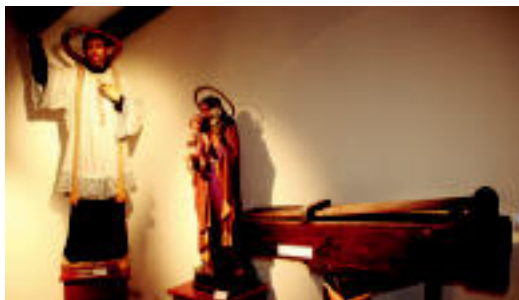
Elizaren goiko solairuan museo txiki bat jarri dute. I. GARCIA