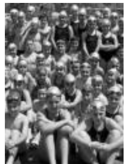
Urrian hasiko da ikastaroa. HITZA

Andoaingo AEKk alfabetatze ikastaroa antolatu du andoaindar eta Tolosaldeko herritarrentzat, bai euskaldun zaharrentzat, bai euren euskara maila hobetu nahi dutentzat. Ikastaroa astean hiru egunetan emanen dute, gutxi gorabehera 09:00etatik 11:00etara, Andoaingo AEK-aren egoitzan. Izena emateko 943 59 17 04 zenbakira deitu behar da edo Andoaingo AEKk Extremadura kaleko 5 zenbakian duen egoitzara gerturatu.