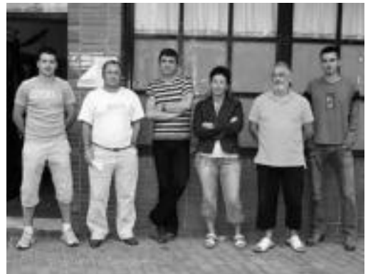
Pilota ikastaroa bultzatzen duten arduradunak eta eragileak.