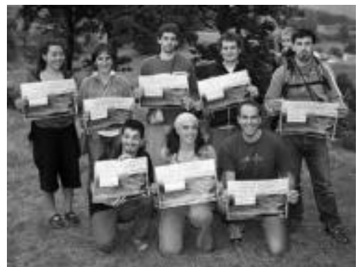
Bai Euskal Herriari eta Haitzetan Rajuko kideak Haitzetan. A. IMAZ