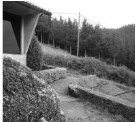
Aldabako elizaren atzetik joanda aldapa gora egin behar da. N. URBIZU

Azarnategitik, eskuineko pinuditik, Mandramuñoko bordara jaitsi eta gero, ezkerretik mendia inguratzen joango gara. Errepide batera iristean, ezkerreko hartu eta Lopetedi baserrira joango gara. Ibilbidearen azkeneko zatia errepidetik doa Aldabaraino.