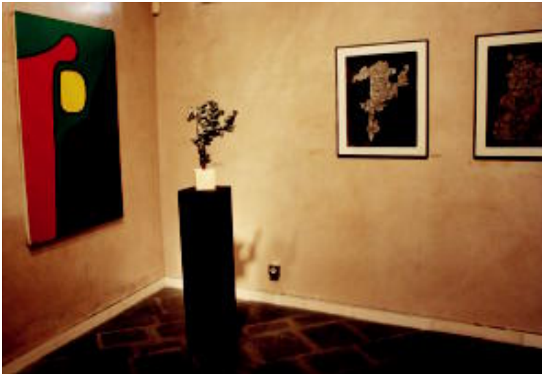
70. hamarkadatik gaur egunera arte. Eskuinean ikusten diren koadroak 70. hamarkadakoak dira, hau da, Etxeberriaren lehen emaitzak. Ondoren etorriko lirite, koadroetan ikusten direnen eskulturak, eta koloretsuak eta linealak diren ezkerreko bezalako koadroak. I. TERRADILLOS