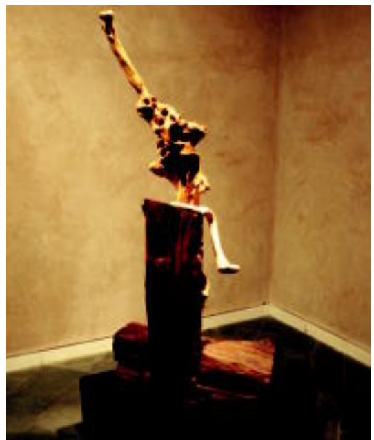
Olibondoak. Olibondoaren adarren adibide bat da hau. Heriotza, gaisotasuna, mina... denboraren garrantzia. Heldutasunaren gaia landu nahi du Etxeberriak, «gizarteak tapatu nahi duen gaia». I.T.