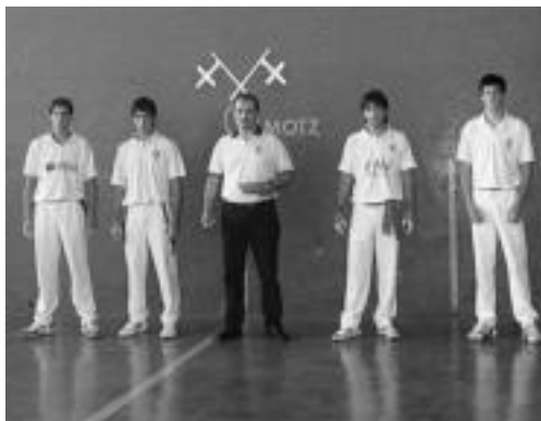
Kadeteen artean igandean jokaturako norgehiagoka. HITZA

Euskal Herriko hainbat lekutako pilotariek final laurdenak jokatu zituzten 3 egunez