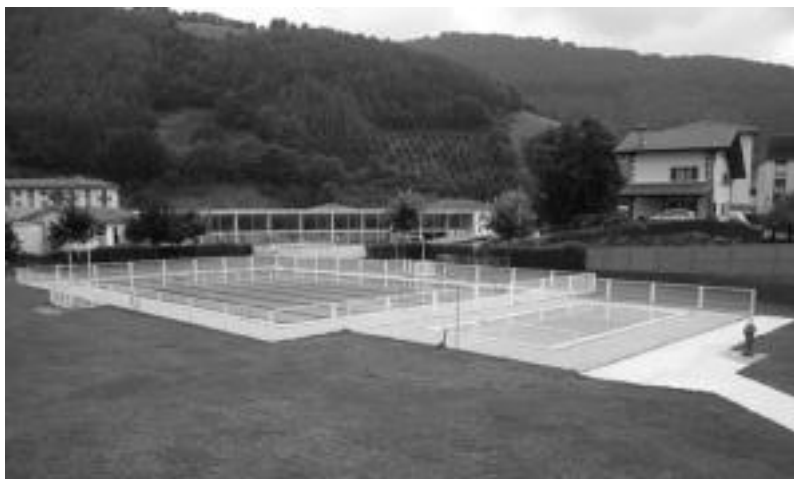
Datorren uda heldu arte igerilekuak itxia egonen diren arren, ez dituzte hustuko. N. GARZIA