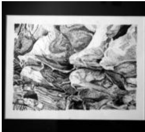
Tinta eta luma-muturra. Azken urtean Etxeberriak eginiko lanetako bat da hau. Tinta eta luma-muturrez eta ikatz-ziriz eginikoak ere baditu. I.T.