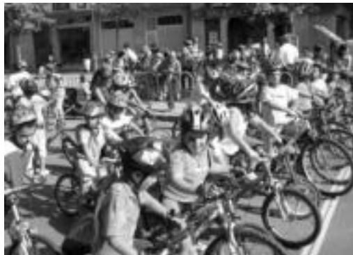
Urtero bezala, azokaren baitan pedal eguna ospatuko da. GARAZI AZKUE

Aurtengoan ere kirol taldeak aritu dira antolatzaile lanetan. Tolosaldea IKT, Hegoalde nesken areto futbol taldea, Tolosa CF txirrindulari taldea eta Judo Klub taldea hain zuzen ere. Ostegunetik larunbatera bitartean 18:00etatik 24:00etara egongo da irekita azoka. Igandean berriz, eguerdian ere zabalik izango da. 1.400 eserleku inguru prestatu dituzte lau gunetan banatuta. Alde batetik, Plaza Zahar-