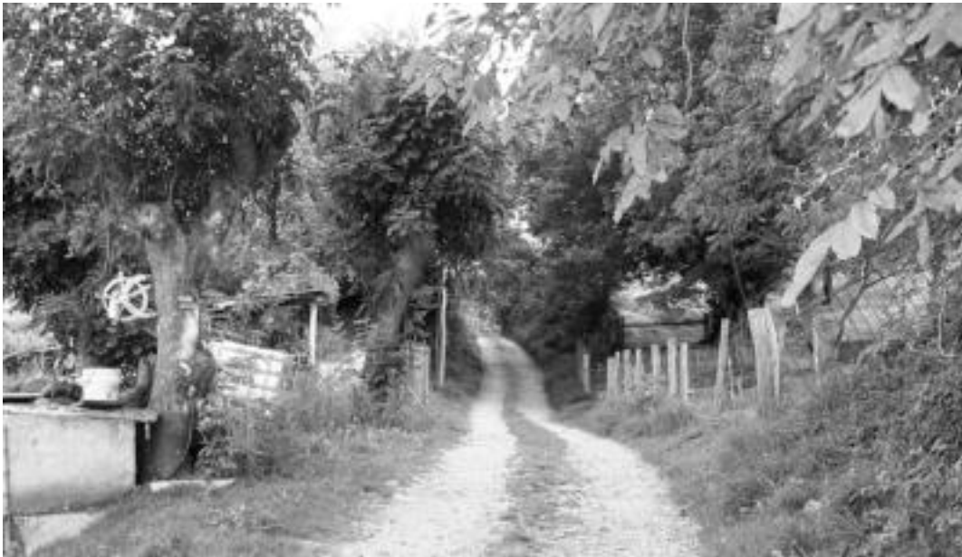
Gurpil-Haundi baserria ezkerrean utzita eta zakurren kaiolak ezkerrean, irudiiko bidea hartu behar da. N. URBIZU