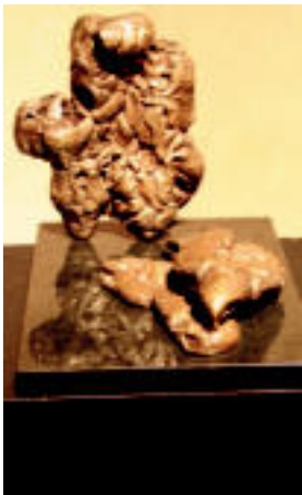
'Arimaren garrasia'. Gerra Zibilean fusilatutako ziztutenei omenaldia egiten dien lana da. I.T.