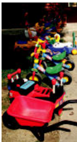
Ikaztegiatoko txikiak eskolaren atarian utzi dituzte jostailuak. N. U.

Txikiak ere hasi dira margoak eskuen artean hartzen eta adimena zorrotzen, ahots berriak entzuten eta ezagutzen, eta aurpegi berri asko ikusten. Batek baino gehiagok egin du negar, berritasun horren aurrean egonik, baina guraso batzuk ere bertan geratu dira, haurarentzat horren gogorra ez izateko, eta behar izanez gero, haurra hartu eta etxera eramateko.