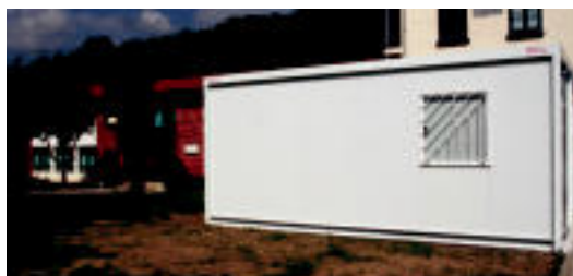
Ikaztegiatoko 3. zikloko ikasleak etxe aurrefabrikatu batean daude, eskola ondoan. Eskuinean, DBH 3. mailako ikasleak pasillotik beste ikasgela batera joaten. N. URBIZU

13:00a aldera ikasleak etxera joan ziren, eta atzo ere, urteko eskola egun guztietan bezala, aitak edo amak bazkaltzeko zer prestatu dieten pentsatzen joango ziren.