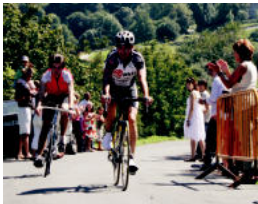
Bedaioako txirrindulari igoyeraren bi parte-hartzaile. HITZA

Orokorrean ondo joan direla azaldu dute Zizurkilgo Udaletik. «Egunez jende asko ibili da eta eguraldiak lagundu du», azaldu dute. Izan ere, abuztuan baino eguraldi hobea, festarako behintzat, egiten ari du hil honetan.