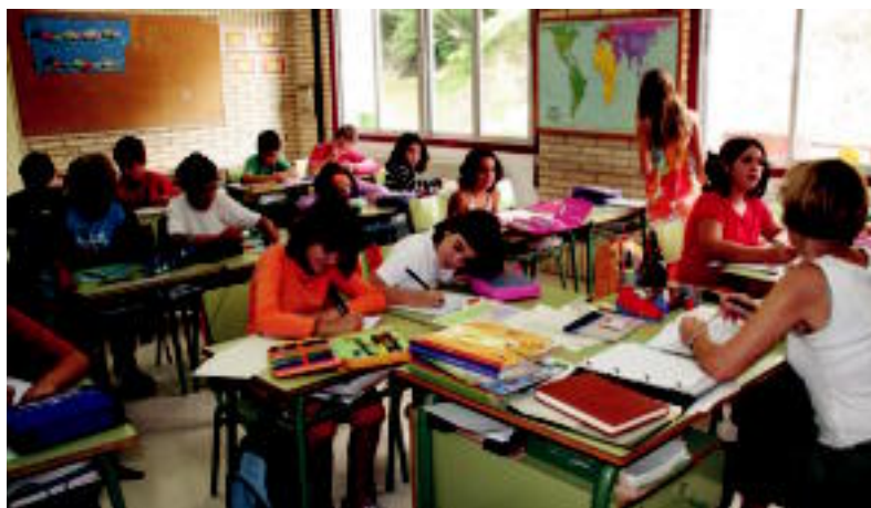
Laskorain ikastolako 5. mailako ikasleak ostegunean hasi ziren lanean. N. URBIZU