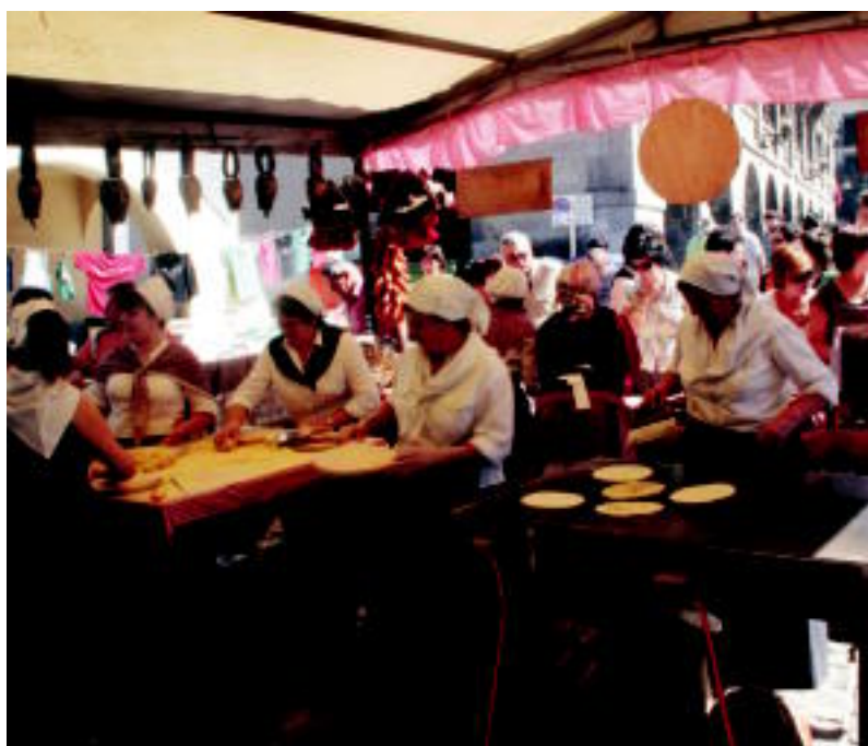
Villabonatarrek eta saralegitarrek gogor egin zuten lan euren postuetan. ANDER OTEZABAL

«GUSTURA» ▶ Plazaola Partzuergotik eta talogileak pozik azaldu dira; talo eskaintza zabala izan zen ▶ 7