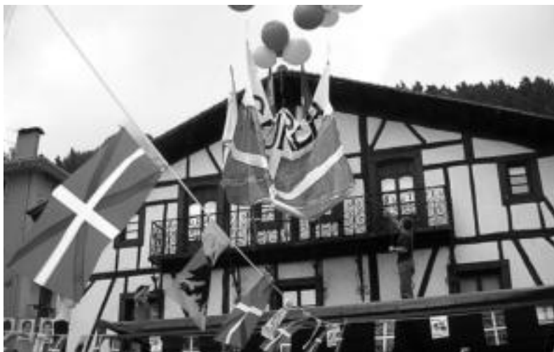
Herritarrek Espainiako banderaren aurrean Geurea ikurrina zioen pankarta jartzen ari zirenean. HITZA

EAE-ANV alderdiak lau puntu aztertu ditu. Lehendabizi, «PPren agintarien jarrera» salatu nahi izan dute, «beste behin, Lizartzara herria eta herritarrak iraitzera, gutxiestera eta burla egitera joan direlako». Gaineratu dutenez, «PP ez da ongietorria Lizartzara»; izan ere, «Azken hauteskundeetan Lizartzako herria argi eta garbi mintzatu zen eta PPK, Franco-