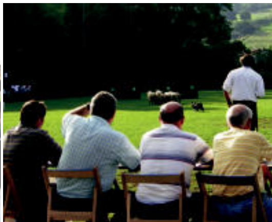
Asto lasterketak ikusmin handia sortu zuen Alkizan; ardi txakur lehiaketa izan zen, besteak beste, herenegun Zizurkilen. HITZA