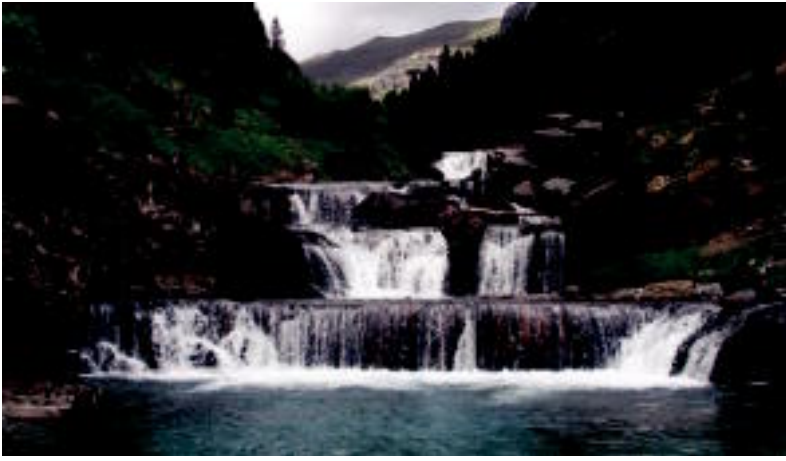
ORDESA (HUESCA, ESPAINIA) ▶