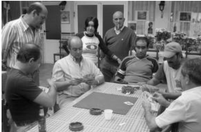
Adin ezberdinetako jende ugari hartzen du parte Kultur Astearen gauzatzen diren ekitaldietan.