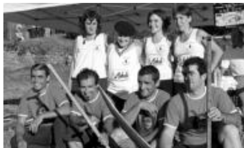
Goian, Etxeberria amasarra eta Arteaga baliarraindarra sega pikatzen. Behean, Taldekakoan irabazleak.