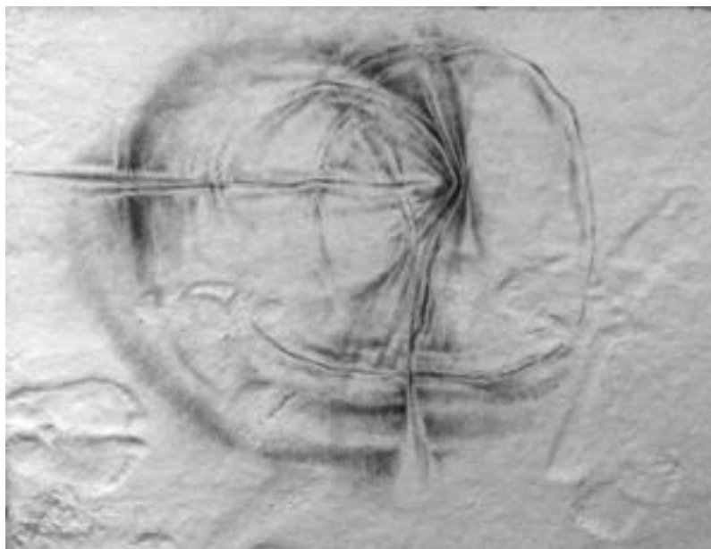
Gogoratu behar ez den iragana eta itxaropentsu datorrela dirudien etorkizuna islatzen du lanen bidez