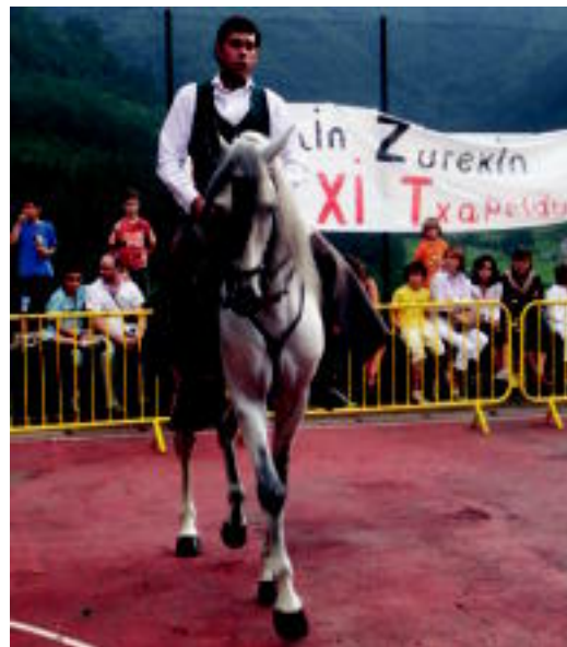
Elduainen zaldi erakustadia izan zen berritasuna. HITZA