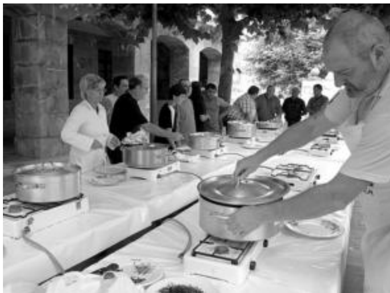
Bailarako hamar elkartetako sukaldariak gogor saiatu ziren Isats Gisatuaren Lehiaketan. A. IMAZ