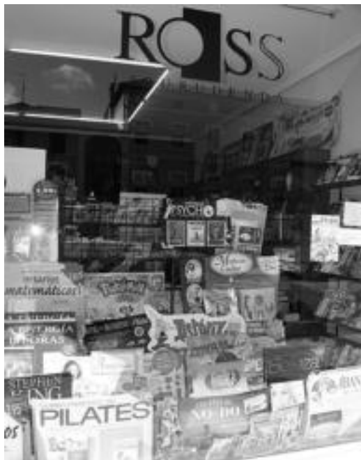
50 bilduma ezberdin baino gehiago topa daitezke liburu dendetan.