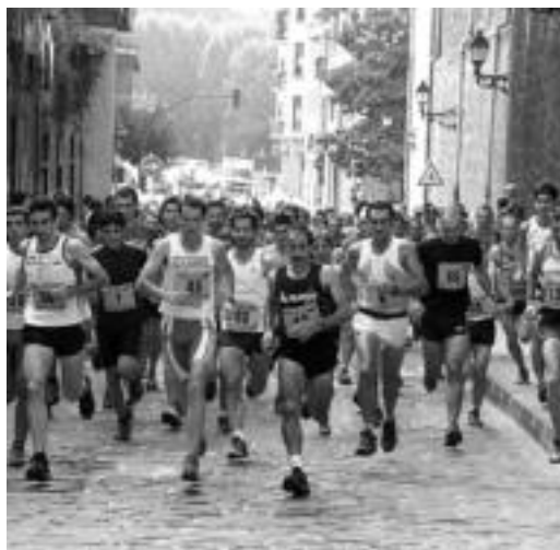
10:00etan abiatu ziren lasterkariak Ernio gailurrera. N. GARZIA

Denera, 130 izan ziren Triangulo plazatik Ernio aldera abiatu ziren lasterkariak. Ordubete eta minutu batzuk igaro zirenerako hasi ziren lehenengo parte-hartzaileak Triangu-