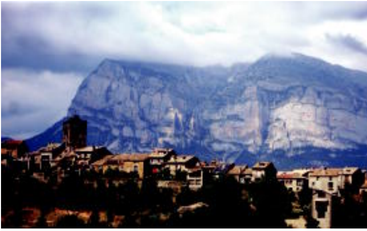
AINSA (HUESCA, ESPAINIA) ▶