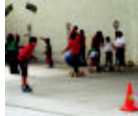
Bedaio. Bedaion Ama Birjinaren Eguna ospatu zuten atzo eta arratsaldean umeak izan ziren protagonista eta herriko frontoian jolasen ibili ziren. Gurasaok ere animatu ziren. a.u.u.