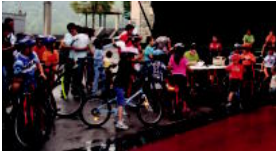
Alkiza. 30 umeek egindako orfojaren kontrako proban komposantura jain-etorria egin behar izan zuten. a.u.u.

Zuzurkil buruhandien ondoren lore lasterketa egin zuten Jose Arregi plazan eta bazkaria egin aurretik sardinak eta sagardo dastaketa egin zuten. Moztoro gasa ere izan zuten. Eliduin meza nagusaren ondoren hamaiketako egin zuten eta arratsaldean txiki- txikienek Marsel magoaren gin-zatu egin zuten. 18:30ean herritarren jaialdia egin zuten eta 00:00etan diskojaisarekin amaitu zituzten festak.