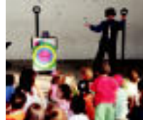
Eliduin. Hemen ere umeak izan ziren protagonista eta arratsaldean Marsel magoaren gozabeko aukera izan zuten herriko pitalekuan. Diskoiairekin amaitu ziren festak. a.u.u.