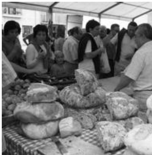
Aukera handia izan zen atzoko ezaugarrietako bat. A. IMAZ