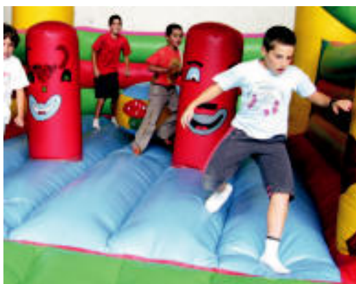
Elduainen ebeko txikieneztat puzgarriak jarri zituzten. I. GARCIA

Lizartza, Zizurkil, Elduain, Alkiza, Izaskun eta Bedaion ekitaldi ugari gaur ▶ 4-5