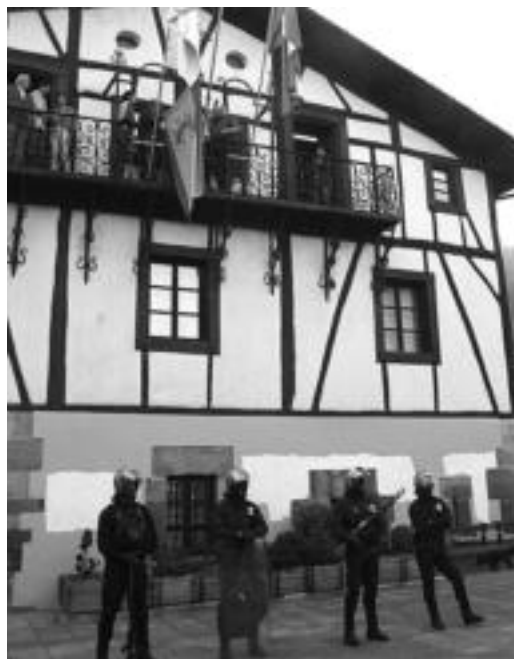
Ertzaintza prest. Espainiako bandera jartzen ari zirenean giza hesia osatu zuten ertzainek.