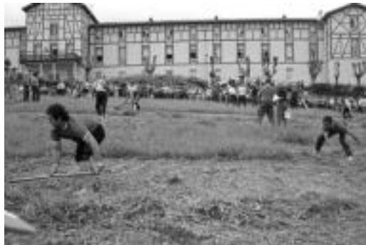
Iaz Tolosan jokatu zuten I. Taldekako Segapikatze. E. EZEIZA

Arratsaldekoan berriz, 17 talde lehiatuko dira. Gizonezkoek 200 metroko saila ebaki beharko dute, eta emakumeek 120koa. Parte-hartzaileek edozein motatako sega erabili ahal izango dute.