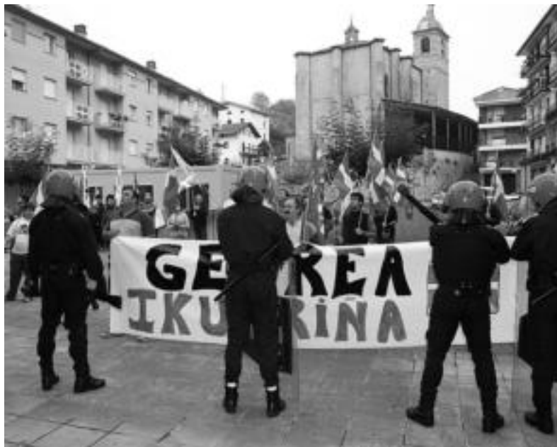
Herritarren protestak. Geurea Ikurrina lelopean elkartu ziren 55 lagun inguru. Herritar hauek oso haserre agertu ziren; «osoko bilkuran parte hartzen ez digute utzi eta balkoian Espainiako bandera jartzeke garaian, txaloka eta barrezka herria irainduz ibili dira». A. IMAZ