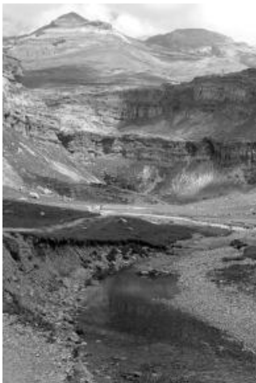
Ordesa bailara, Monte Perdido mendirako bidean. HITZA

Dagoeneko badituzte Mendi Astean izango diren bi ekitaldi lotuta. Alde batetik, Angel Cuervo tolosar bidaiariaren Mekong ibaia, bizitza tsuna-