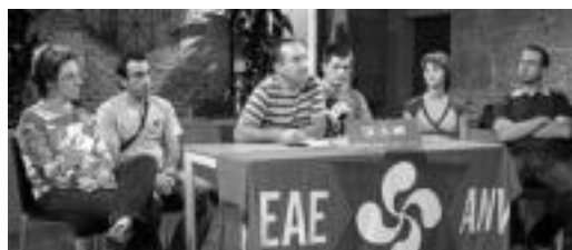
EAE-ANVren ekimenaren aurkezpeneko irudi bat. I. GARCIA

Iaz Tolosako Udalak hiriarren sorreraren 750. urteurrena ospatu zuen. Baina ezker abertzaleak ospakizun hura erre-