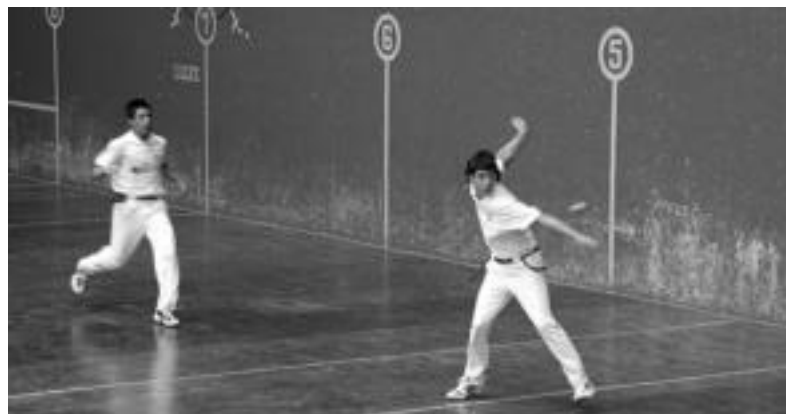
Amezketako pilotalekuan jokatuko dituzte finalerdiak, gaur eta bihar 21:00etatik aurrera. ASIER IMAZ

Jaunarena kadeteetan eta Telletxea gazteen lehiatuko dira, «maila orekatua» izaten ari den buruz buruko txapelketan