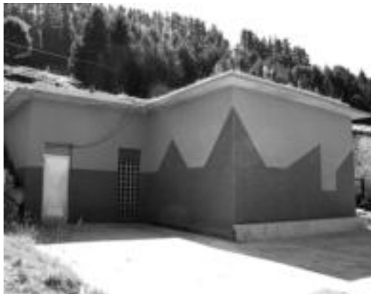
Belauntzako ur depositu berria. A. IMAZ

Proiektuaren helburuari dagokionez, «alde batetik, Tolosaldeko udalerrri honen ur hor-