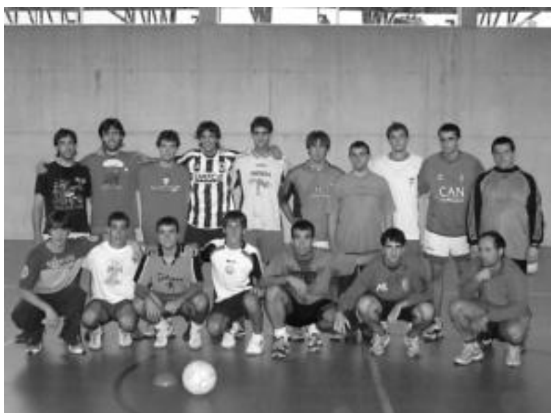
Aurrera taldeko futbolariak asteazkenean kiroldegian entrenamenduko atsedenaldi batean. N. GARZIA

Denboraldi osoan zehar 30 norgehiagoka jokatuko dituzte leitzarrek, 16 futbol talderen artean eta azkenekoa 2008. urteko apirilaren 20an jokatuko dute