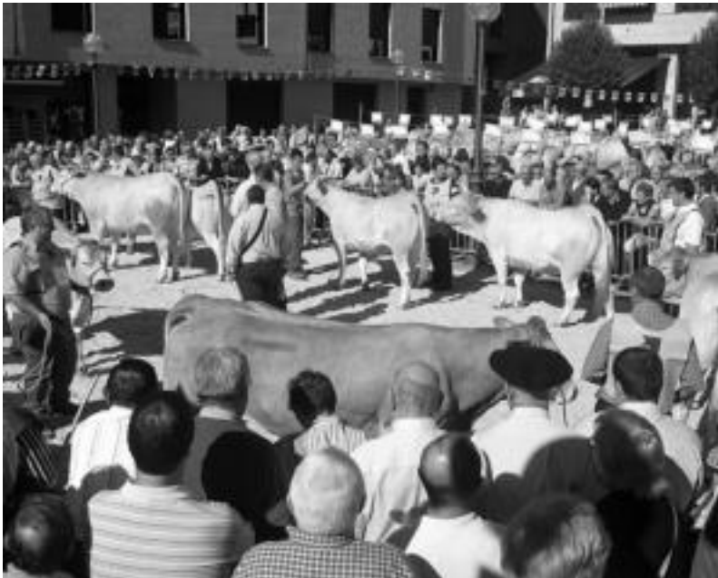
Ordiziako Garagartza plazan ganadu lehiaketako erakustaldia egiten, ATZO. I. GURRUTXAGA