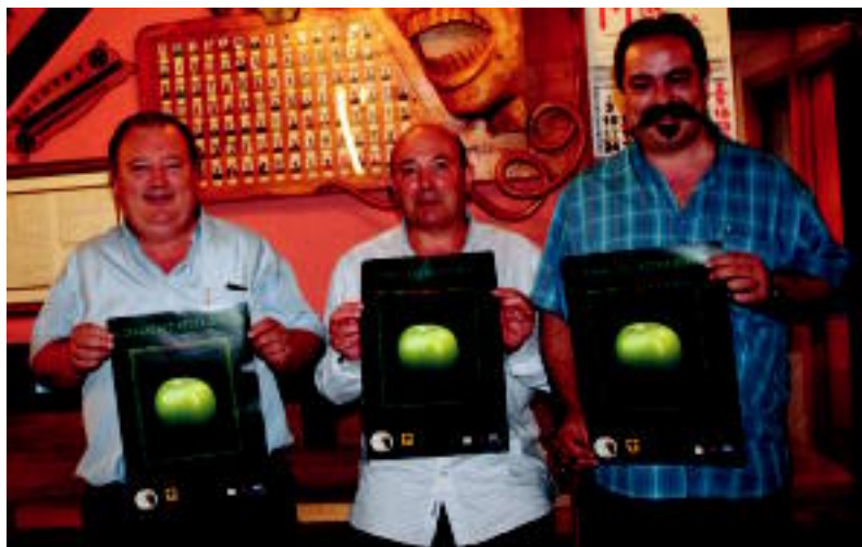
Irrintzi elkarteko kideak azoka berezia iragartzen duen kartelarekin elkartearen bertan. I. GARCIA

Artisau eran eta kalitatezko produktuak izango dira plazan; elkartearen arteko XIII. Isatsa Gisatu Lehiaketa ere egingo dute