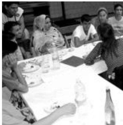
Tolosan, abuztuaren 25ean antolatutako saharar egunean, jolasak eta bazkaria izan zituzten.