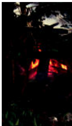
Sutea arratsaldean piztu zen. n. u.

«Hasieran ezin nuen sinetsi», aitortu du aizkolariak ▶ 6