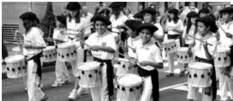
Beste hainbat ekitaldiren artean, Ibarrako jaietako danborradan hartu dute parte sahararrek. G. EIZAGIRRE