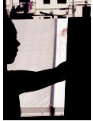
Pirritx eta Porrotx pailazoen Mari Motots emanaldia eman zuten plazan; alboan, haurren txupinazoa. i. g.