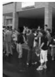
Aralar institutua. J. GOIKOETXEA

10:00etan hasi eta bi orduz egongo dira, eta irailean goizez izango dira eskolak