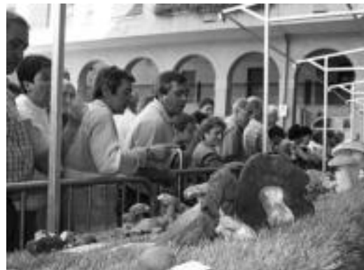
Jose Migel Barandiaran plazan kokatutako perretxiko erakusketa ikusten.