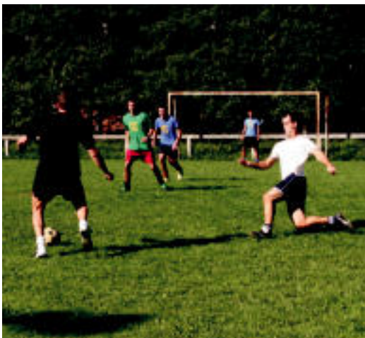
Atzo arratsaldeko futbol partidaren une bat. i. GARCIA