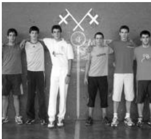
Alduntzin, Jaunarena, Goikotxea, Aranburu, Olazabal eta Iriarte. n.g.

Halere, Nafarroako Herri Arteko finalean baino lasaiago