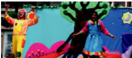
Kiki, Koko eta Moko Hernialden izango dira abuztuaren 14an.

09:30. Diana trikitilariekin. ▶ Goizean Aresoko txekorra erreko dute plazan. 14:00. Herri bazkaria Pake Toki eta Larrea elkarteek antolatuta, Peñagarikano eta Irazu bertsolariak alaituta. 18:00. Amateur mailako pilota partida; Irazu eta Peña botilero.