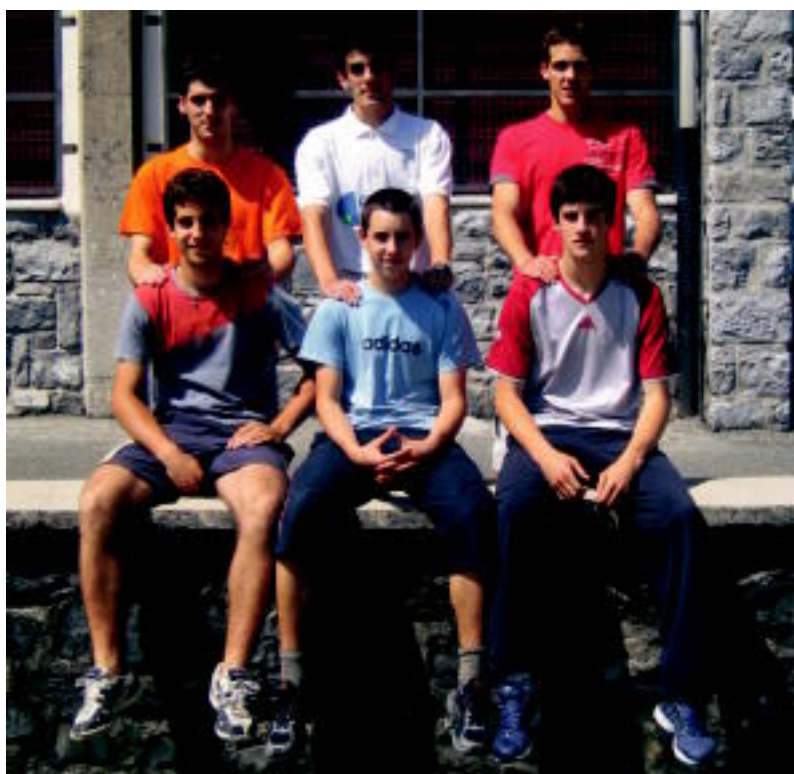
Euskal Herriko Herri Arteko Txapelketako finala jokatuko duten sei pilotariak.