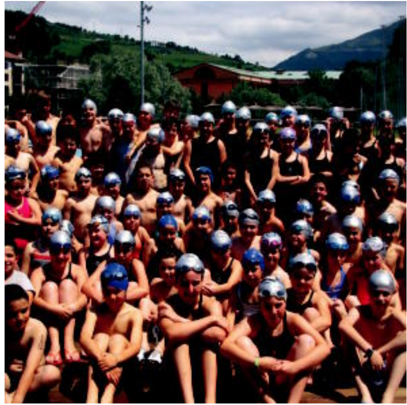
Tolosaldea IKT igeriketa taldeko igerilariak, Usabalen aritu ziren Gipuzkoako Txapelketan.

TOLOSALDEA ▶ Usabal kiroldegian Gipuzkoako Txapelketa jokatu berri dute eta Tolosaldea IKT Gipuzkoako hirugarren talderik onena izan da