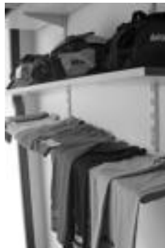
HITZAKO produktuak. I.T.

▶ Bigarren saridunak Zumaiaiko Talasozelai talasoterapia zentroan bi pertsonentzako zirkuitua irabaziko du. ▶ Hirugarrenak Tolosako Denak tabernan lau pertsonentzat afaria lortuko du. ▶ Argazki Lehiaketan parte hartzen duten guztien artean HITZAKO produktuak zozketatuko ditugu. Halaber, botoa ematen dutenen artean ere zozketatuko ditugu HITZAKO produktuak.