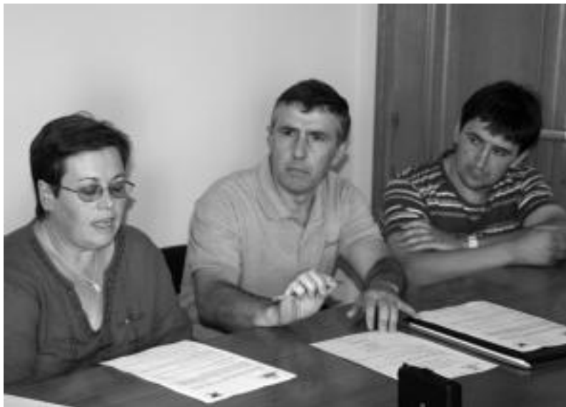
Bide Berriak Hautesle elkarteko kide eta Leaburu-Txaramako Udaleko hiru zinegotziak. A. IMAZ

Alkaterik gabe jarraituko du Udalak, horretaz gain, bilkuran Bide Berriakeko 4 kidek udal karguei uko egin zioten