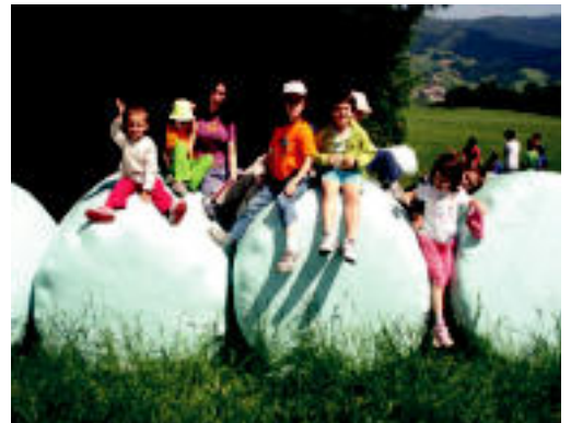
Haurrak Udaleku Irekien mementu batean.