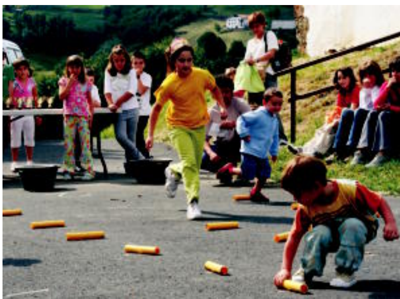
Gazteboentzako jolasak izan ziren atzo arratsaldean Asteasun. ASIER IMAZ

ALBIZTUR ▶ Santa Marina auzoan ospatzen dute gaur, ekitaldiz beteriko festa eguna ▶ 5