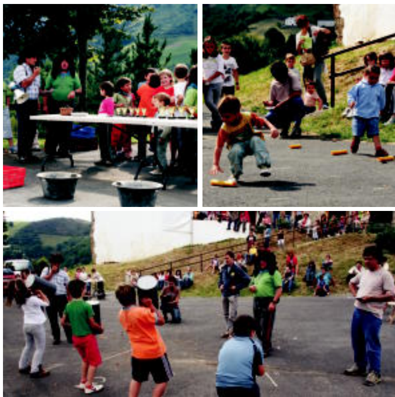
Epaleia eta aurkezlea gertu zituztela lau taldetan ibili ziren haurrak lehia Asteasuko goiko bailaran. A.I.

Asteartean hasi ziren santamañak Asteasun, atzo haur jolasak, toka txapelketa eta trikitixa izan zituzten