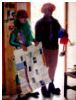
Klownak. Bi klownek bazkalondoa alaitu zuten. N. G.