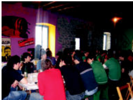
Bazkaria. Antolatzaileek azaldu dutenez, 70 lagun inguru elkartu ziren atzo bazkaltzera, lehengo urteko kopuru bera mantendu da, beraz. Bazkaria Gaztetxekoek prestatu zuten. N. G.

Gauetz Atekabeltz Gaztetxeko tabernan lanean herriko koadrilak aritu zirela azaldu dute antolatzaileek. «Beti Gaztetxean ibiltzen garenek gauean atsedean hartzea erabaki dugu eta horretarako herriko koadrila ezberdinak ariko dira tabernan lanean».