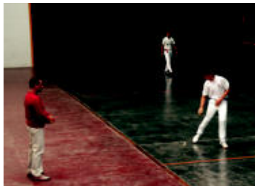
Gazteen mailan 3 partida jokatu zituzten atzo goizean. A. IMAZ

Herenegun eta atzo egun guztian zehar izan zen pilota partidak ikusteko aukera