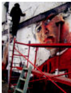
Grffiti. Horma batean graffiti bat egin zuten. N. G.