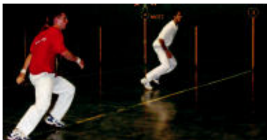
Olazabal eta Iriarte Jauregi eta Uribarrenen aurka lehiatu ziren. HITZA

Leitzak Euskal Herriko Herri Arteko finala jokatu du datorren larunbatean, Arrasaten, Berrizen aurka, herenegun Leitzako Amazabal Pilotalekuan Maezturi gailendu ondoren.