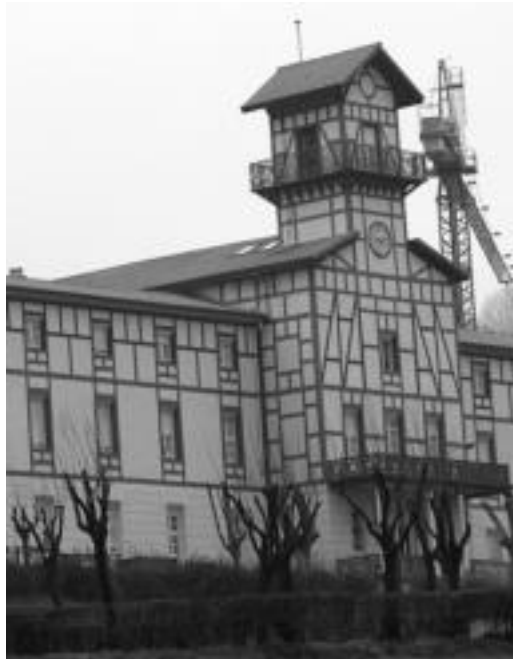
Adinekoen egoitzetan plaza bat izateko eskubidea dute orain. E. EZEIZA

Dekretuak dakarren berrikuntzetako bat da, gurasoak hiru urtetik beherako seme-alabak zaintzeko langileak kontratatzeke laguntzak emango direla. Baina, aldaketa nagusienetakoa da, lehen, lan eszedentziak eta lanaldi murriz-