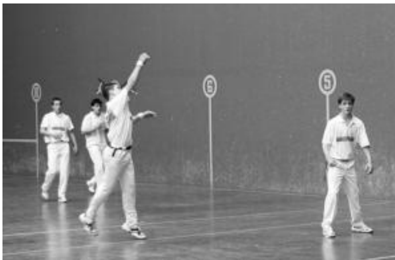
Herri Artekoa hasi zenetik hainbat herrik parte hartu dute, baina finala bi herriek jokatuko dute soilik. n.u.

Leitza (Nafarroa) Maeztu (Araba) herriaren aurka lehiatuko da Amazabal Pilotalekuan, 19:30ean, hiru norgehiagokatan