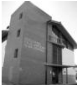
Eguneko zentroa. N. URBIZU

Ahots Atsegin, hitzek berriak dioten moduan, eguneko zentro honek bi zutabe ditu nagusi: gimnastika egitea egunerokotasunean erosoago edo gero eta zailagoa ez izateko, eta helduekin hartu-eman, jarrera