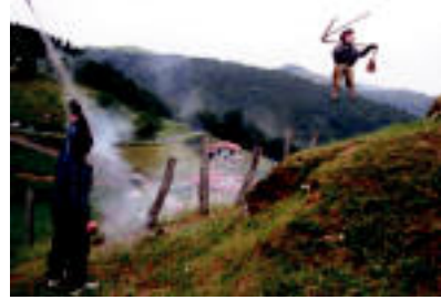
Txupinazoarekin batera igo zen Tranzazulo. i.e.