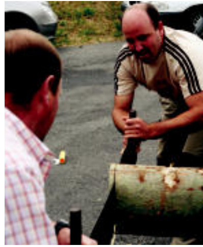
Trontzalariek ikuskizun ederra eman zuten. i.e.