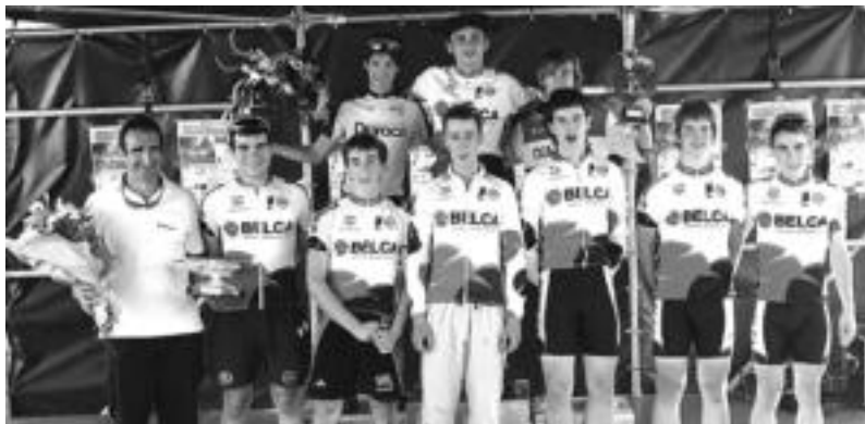
Belca taldeko txirrindulariak Ezkion, sari banaketaren unean. JUAN MARI TOLIN