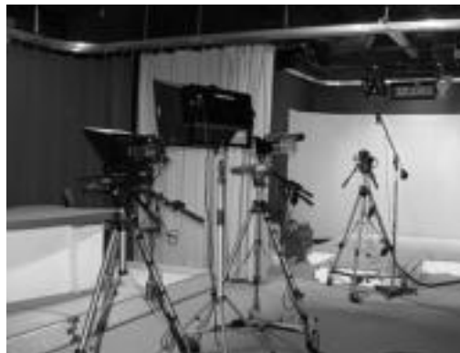
Denera lau lizentzia banatu dituzte eskualdean. HITZA

Tolosako Komunikabideak SLk, Gipuzkoa TV SAk, Zabalik 2000 SLk eta Grupo de Medios Audiovisuales de Gip. SLk jaso dute gurean