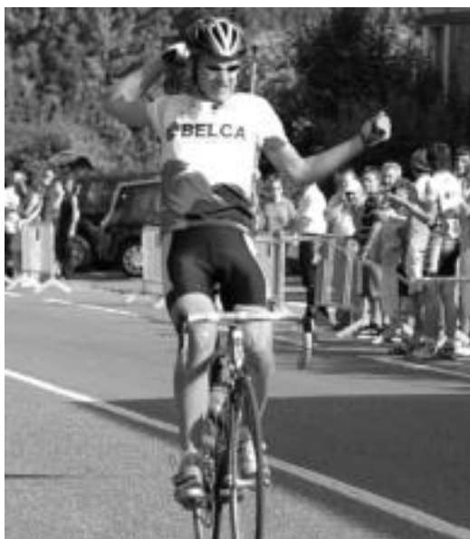
Aitor Ocampos Ezkioko helmugan, larunbatean. JUAN MARI TOLIN

Larunbatean, Alegian, kadeteetan bigarren postua lortu zuten; Ezkion, junior mailakoan, garaipena eta taldekakoa