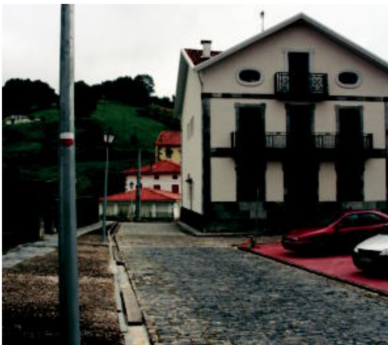
Bidaniko plazan dagoen bidea hartu behar da: handik gora jarraituz, ez dago galtzeko arriskurik. N. URBIZU