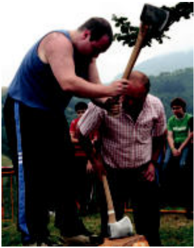
Aizkolarietako bat esfortzu bizian. i.e.