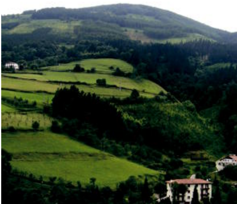
Otsabio mendian trikuharri bat dago. Lizartzatik mendiak honako itxura dauka. ASIER IMAZ

Altzo inguruan Lizartza aldera joaz Otsabion aztarnak aurki daitezke; Bidegoian aldean, berriz, Erniorako bidea