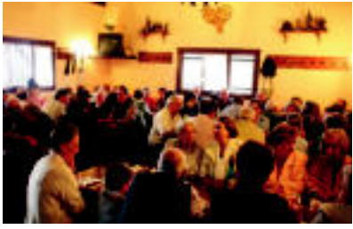
Elkartea beteta, hamaiketakoaren orduan. i.e.