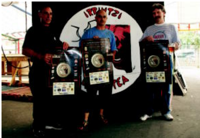
Irrintzi elkarteko kideak Garagardo Azokaren kartelarekin. I. GARCIA

Gaur hasiko da, 18:00etan, Irrintzik antolatzen duen XI. Garagardo Azoka