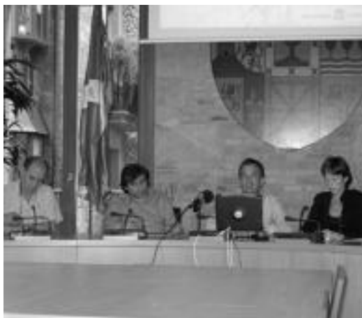
Udaleko ordezkariak Plan Orokorren aurkezpenean. E. EZEIZA

Duela bi hilabete, hau da, maiatzean egindako Osoko Bilkuran onartu zuten behin behinoko Tolosako hiri ordenazioko plan orokorra. Orain, egitasmen inguruko informazioa udaltxeko bigarren solairuan egongo da ikusgai irailaren 30era arte. Herritarrek beraien iritzia eman ahal izango dute epe honetan, eta dituzten zalantzak galdetu. Honetarako ordua eskatu eta teknikoekin ere hitz egin dezakete. Bestalde, Udaletxean dagoen erakusketan, modu ulerterraz eta grafikoan azaltzen dira proiektuak arautzen dituen gairik garrantzitsuenak. Lehenengo gelan bideo bat ikus daiteke, honetaz gain, gai hauek biltzen dituzten bederatzi panelak ere kontsul-