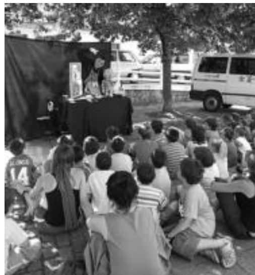
Txotxongilo emanaldiko uneetako bat. HITZA