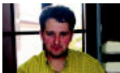
Mujika eta Roteta. i. e.

Hori eta hobi septikoa egokitzea dira proiektu nagusiak ▶ 2