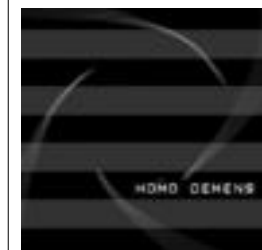
Diskoaren karatula. HITZA