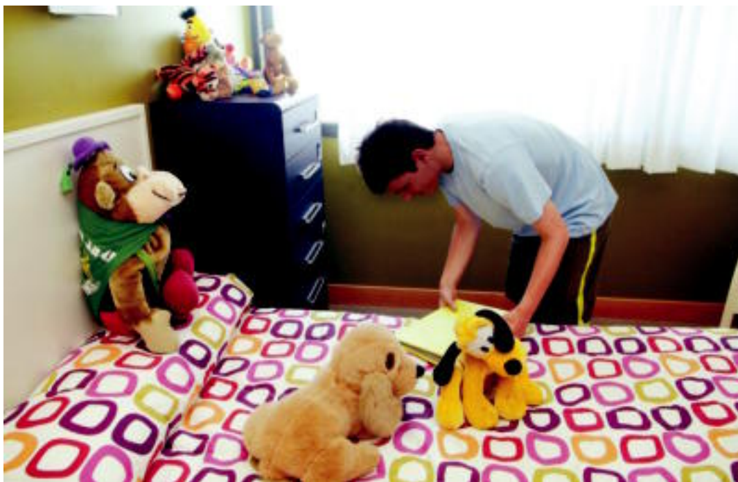
Gela, eremu pertsonala.

Horrenbestez, oso antzera pasatzen dute eguna etxebizitza babestu hauean bizi diren pertsonak eta beste edonork. Lanegunetan, 9:00etatik 17:00etara, ohiko zereginak egiten dituzte hemen bizi direnek, beren eguneko zentroetan edo tailer okupazioaletan. Etxera itzultzean, ia familiakoa den bizitza islatzen saiatzen dira. «Horretarako, pertsona bakoitzaren gaitasunak, interesak eta indarguneak baloratzen saiatzen gara, etxeko bizitzan parte har dezaten. Asteburuetan eta jaiegunetan grina handiagoaz egiten dugu komunitatean parte hartzeko lana. Horretarako, norbanako bakoitzaren adin kronologikora hurbiltzen saiatzen gara, eta, beraz, haien adin errealekin bat datozen jarduerak egiten ditugu, eta ez adimen-gaitasunak islatzen duen adinarekin bat datozenak. Ez dugu nahi ostatu hutsa ematea, alderdi hori oso garrantzitsua izan arren; bizitza-proiektu bat garatu nahi dugu. Horretarako, norberak behar eta interes pertsonalak bete ditzan nahi dugu, ahal den erarik pertsonalitatearekin, eta behar eta interes