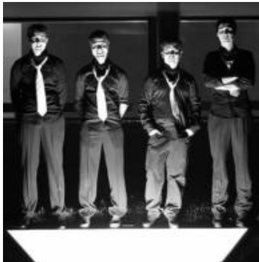
Homo Demens taldea Tolosako lau gaztek osatzen dute. HITZA

Duela hiru urte hasi ziren, bakoitza bere instrumentuarekin, batzuek gainera, «ia jotzen jakin gabe» elkarrekin biltzen eta jotzen. Hala, hasieran, bes-