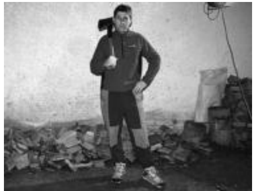
Mujika 2. geratu zen Gipuzkoako Bigarren Mailako Txapelketan. A. I.

Gipuzkoako Aizkolari Txapelketa Usurbilen jokatu zuten larunbatean