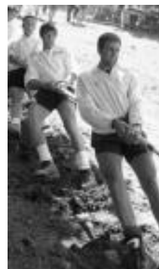
Areso, lehenengo urtean. HITZA