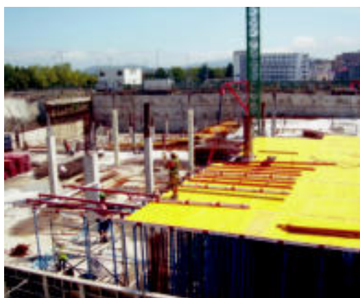
Lanen egoera ekainaren erdialdera.

Kutxaren Gizarte Ekintzak 45 milioi euro bideratu ditu Institutu Onkologikoaren egoitza berria eraikitze eta hornitzeko, eta, orain arte bezala, giza baliabide eta baliabide teknologiko aurreratuak edukiko ditu tumore-gaixotasunak detektatzeko eta tratatzeko. Gainera, Institutu Onkologiko