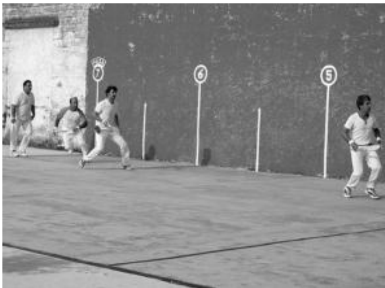
Berazubi pilotalekuan izako final-laurdenetako partida batean. E. EZEIZA

Herenegun hasi zen jokatzeko Tolosa CFk antolatutako 39. Paleta Txapelketa; 14 bikote ariko dira lehian