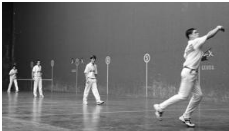
Kadeteen arteko norgehiagokan Arbizukoek (gorriz) irabazi zuten, partida borrokatuan. N. URBIZU

Euskal Herriko herrien arteko txapelketak jokatu zituzten, Arbizukoak hiru mailatan nagusituz, Arrasateren aurka