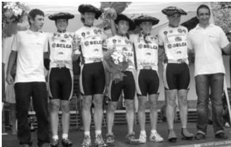
Belca taldekoak, herenegun, sari banaketaren uean. HITZA

Ordiziatik Amezketarako 35 kilometroko ibilbidea egiteko 46 minutu eta 41 segundoko denbora behar izan zuten