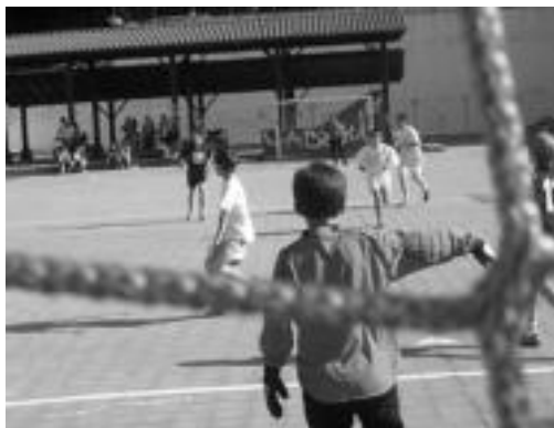
Emeterio Arrese parkean jokatuko dute futbol txapelketa. I. TERRADILLOS

Zabalik dago parte hartu nahi duten neska eta mutilentzat izena emateko epea