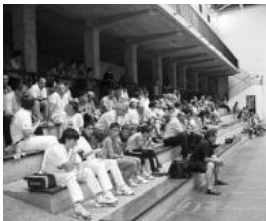
Frontoian, arratsaldeko finaletan bildutakoak. N. URBIZU