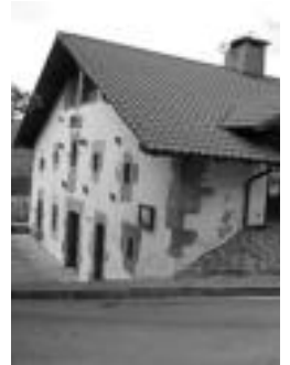
Belauntzako jatetxea. HITZA

Hiru urteren ondoren, Belauntzako jatetxea iragan larunbatean zabaldu zuten. Hala eta guztiz ere, etzi, igandea, hamaiketako berezi bat prestatzea otu zaie, denboraldi berriaren inaugurazio modura. «Sukaldariak urte luzeetako esperientzia du eta honi esker eguneko menua zein jaki berezietan bere jakitura aportatzeko aukera du». Urteko egun guztietan zabalik egongo dela jakinarazi dute, goizeko 09:00etatik gaueko 22:30ak bitarte.