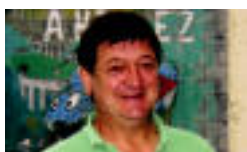
Lazkano eta Arrastoa. I. GARCIA