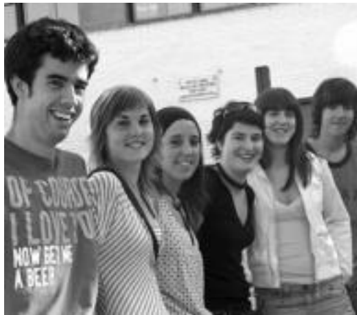
Dina Bilbao Bidai Beka Ibarra eta Belauntzako gazteak irabazi dute, bi mutil, eta gainontzekoak neskak dira.

Besteak beste, glaziar hauek bisitatuko dituzte: Anniviers