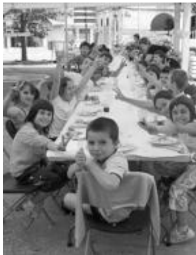
Frontoian haur parkea egon zen txikientzat egun guztian; indarrak berreskuratzeko berriz, bazkaria. A.I.