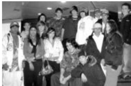
Gazte Forum programan irabazlea izan den Tolosako taldea.

Gazte Forum programa gazteekin (11 urtetik 18 urte bitartekoak) lan egiten duten Gipuzkoako gizarte hezitzaile taldeek parte hartzeko programa bat da. Hain zuzen ere, honetan datza ekimen honek: taldeekin