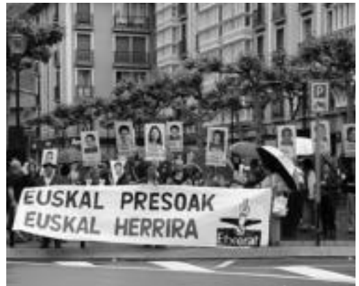
Bi eskualdetako hainbat herritan egingo dira elkarretaratzeak. N.U.