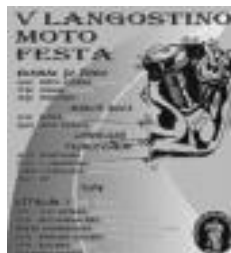
Moto festako kartela. HITZA

09:00-10:00. Gosaria eta topaketa Ibarrako San Bartolome plazan burutuko da. 10:30. Motorrekin bira, bidean hamaiketako egingo delarik. 13:00. Ibarrara itzulera. 14:00. Bazkaria eta festa amaiera.