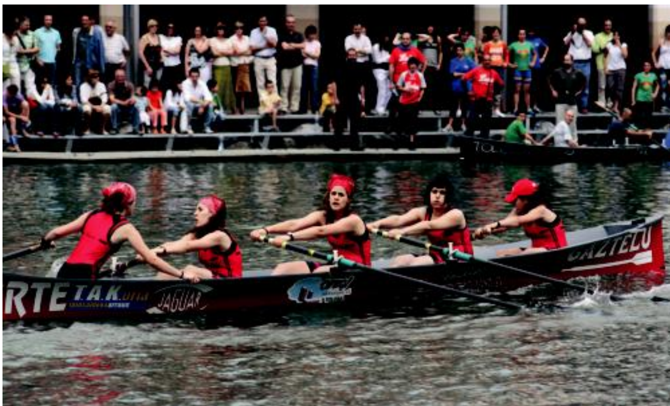
Goitik behera eta ezker-eskuin: Eskopetariak, Bordondantzariak eta batel estropaden finalak, herenegun. IBON AZPILIKUETA