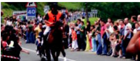
Igandean, eskopetarik desfila egin zuten Tolosako kaleetan barna. Abaltzisketan, jende ugari bildu zen zaldi-karretan. IKUSGAI BELAUNTZA