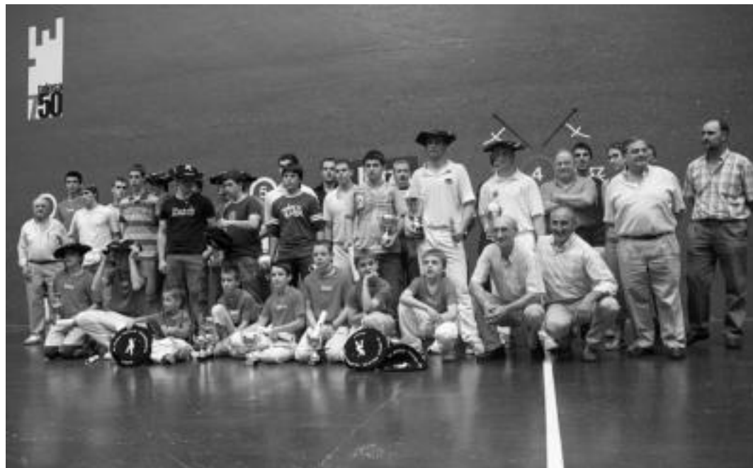
IV. HITZA Pilota Txapelketako irabazleak eta txapeldunordeak lehiaketako antolatzaileekin batera. I.T.