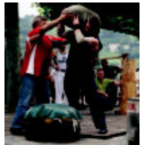
Anoeta. San Joan eguna ospatzeko bazkaria egin zuten igandean Anoetako adinekoren.