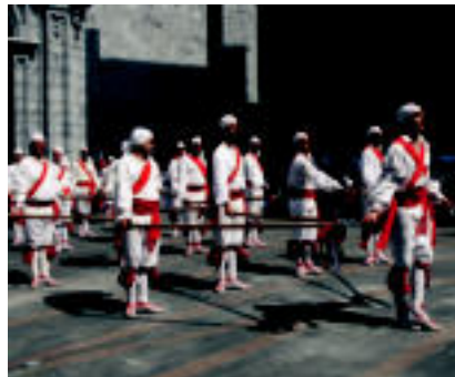
Tolosa. Gozetik hasi ziren igandean bordondantzariak beraien emanaldiak eskaintzen, horietako bat Santa Maria elizaren aurrean egin zuten.