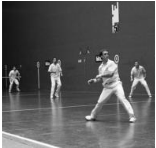
Nagusien mailako finala, Beotibarren. I.T.

Aurtengo txapelketak horrela esan dio, bada, agur hurrengora urtera arte. Orduan ere izango da ikuskizuna.