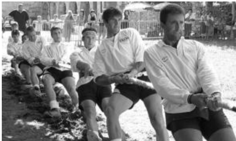
Areson lehengo urtean 560 kilotako kategorian zilarrezko domina lortu zuen Areso taldeak. J. ASTIBIA