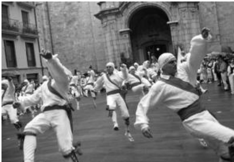
Urtero San Joan egunean, San Juan plazan bordondantza dantzatzeko Udaberrikoek. JAIONE ASTIBIA

50 urte bete dituen Udaberri Dantzari Taldeak protagonismo berezia du sanjoanetan