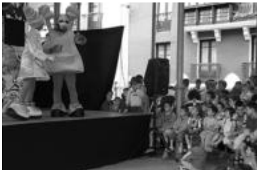
Zerkausion 'Amama Pantxika' haurrentzako emanaldia. E. EZEIZA