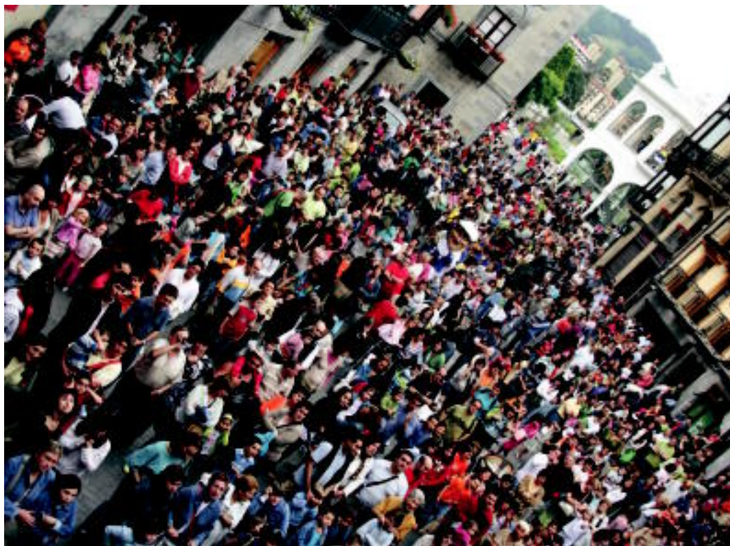
Suzirian jendetza bildu zen, hiru eguneko festa giroa iragarritz. ESTI EZEIZA

Europar Berrazterekin Hm.O eta auzerako autoen LIKIDAZIOA ELGOIBARREN