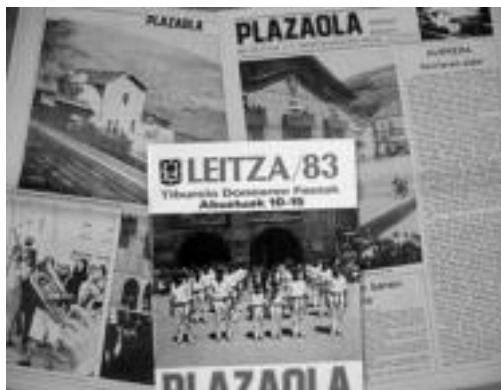
1980. urtean atera zen lehengo alea, egunkari formatoan. J.A.

Azalaren lehiaketa antolatu du Aurrerak eta gertakizunak, txisteak... ere bidali daitezke