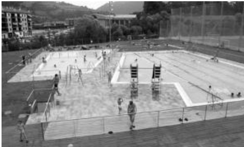
Tolosako Usabal kiroledegiko kanpoaldeko igerilekuak, iazko udako egun batean.

«Haserre» agertu dira Tolosa Lantzen SAren erabakiaren aurrean, «ordaintzaile bezala eskubidea» dutela esanez