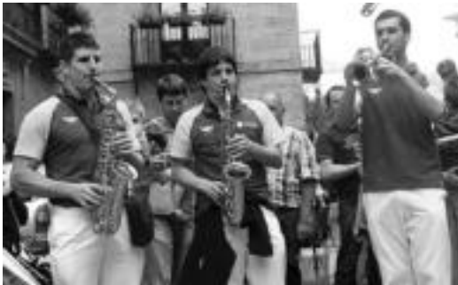
Txarngak alaitu zuen txupinazoaren aurreko itxaronaldia.