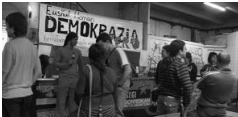
Atzo arratsaldean egin zuten txosna gunearen irekiera. E. EZEIZA

Bestalde, jaia dirua eta handikeriarekin ez dutela lotzen, «beste batzuek bezala», eta «jai kristauak alde batera utzi eta benetako jai herrikoiak» bultzatzen dituzte.