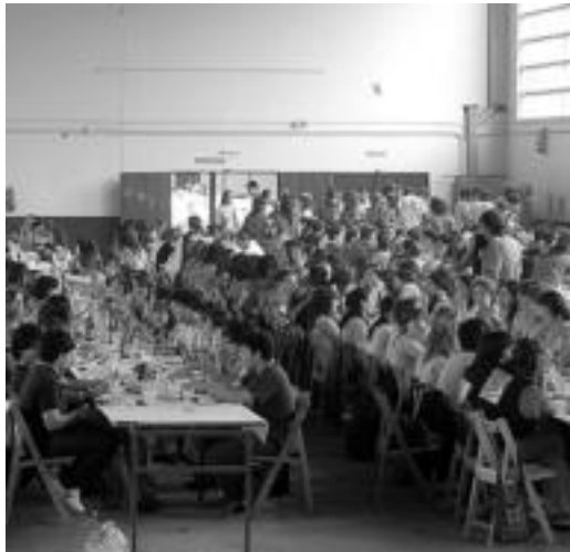
Euriagatik, Ferialekuan izan zen joan den urteko bazkaria. MADDI SOROA

Urtero bezala, Tolosako zenbait koadrila arduratu dira gaurko egitaraua osatzeaz. Denara 81 koadrilek, 700 lagun inguruk hartuko dute parte bazkarian. Hasteko 11:00etan Bonberenea txaranga kalejira abiatuko da giroa berotzen joateko. Ondoren, 12:00etan koadrilak Plazan Berrian elkartuko dira eta bertan jatekoa eta edatekoa izango dute zain. Gainera, antolatzaileek dei berezia egiten diete koadrilei, zuzenean bazkaltzera joan beha-