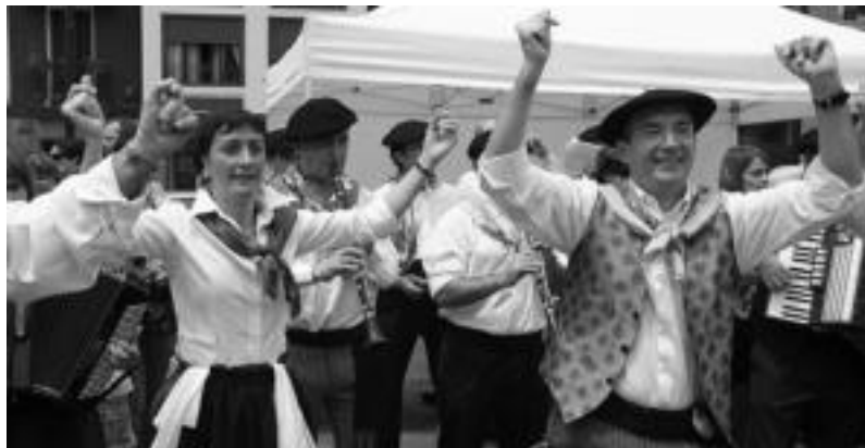
Iragan larunbatean eginiko Udaberriko belaualdien erromeriako une bat. N. LATABURU