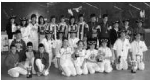
Finalak joakatu zituzten pilotari guztiak. HITZA

Gipuzkoako Eskolarteko Paleta Txapelketan hainbat herritako eskolek hartu dute parte eta emaitza onak lortu dituzte bertan. Lau taldek jokatu zituzten finalak. Alegiko San Joan eskolako C taldea Asteasuko Pello Errota eskolako A taldeari irabazi zion alebin mutiletan. Tolosako Laskorain Ikastolako A taldeak Anoeta Herri Ikastola-