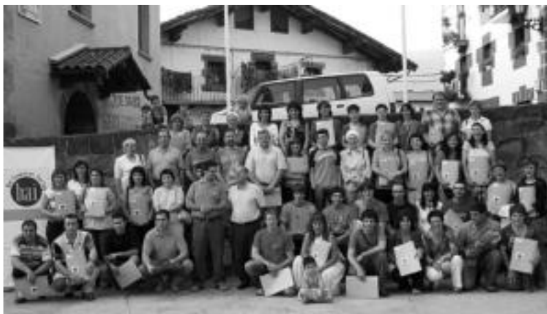
Bai Euskarari ziurtagiria eskuratu zuten 58 gizarte eragileak, 2006. urtean. J. ASTIBIA

Orotara 50 eragile izanen dira aurten ziurtagiria eskuratuko dutenak; ekitaldia plazan izanen da, 20:00etan