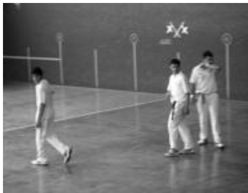
Herri Arteko Txapelketa, joan den asteburuan.

Honetaz gain, Elgeta, Urretxu eta Lizarrako finaletan ariko dira Aurrerako pilotariak