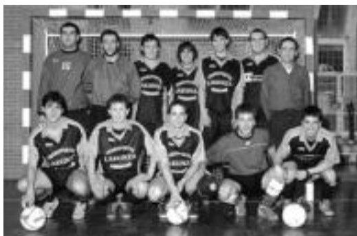
Transportes Lakunza taldeko kideak. HITZA

Erronka izango da taldearentzat, mailaz igozteak zenbait aldaketa ekarriko dituelako. «Alde batetik, fisikoki hobeto prestatu behar gara, partidetan denbora gelditzen baita baloia kanpora joaten denean eta horrek partidaren iraupena luzatu egiten du», dio entrenatzaileak. Bestalde, ohikoa denez, mailaz igozteak talde ho-