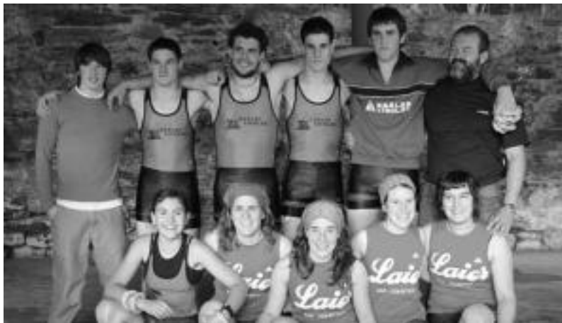
Erlojupeko estropadetan nesketan Laier izenko taldea izan zen garaile, eta mutiletan, Gaztelu. E. EZEIZA