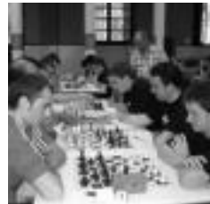
14 talde lehiatu ziren. HITZA

Txapelketa etxeoket irabazi zuten, Tolosa-Ibarrako lehen taldeak alegia. Txapelketa bikaina egin zuten, txanda bat bera ere galdu gabe. Bigarren Sociedad Ajedrecistica Logroñesa taldea sailkatu zen, iazko txapelketa. Eta hiruga-