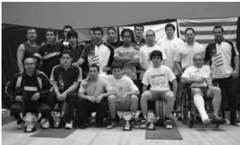
Lehiaketan parte hartu zuten hiru herrialdeetako pultsulari eta entrenatzaileak. HITZA

Irabazlea Katalunia izan zen eta Galizia gelditu zen hirugarren; «maila handiko» lehiaketa ikusi ahal izan zen