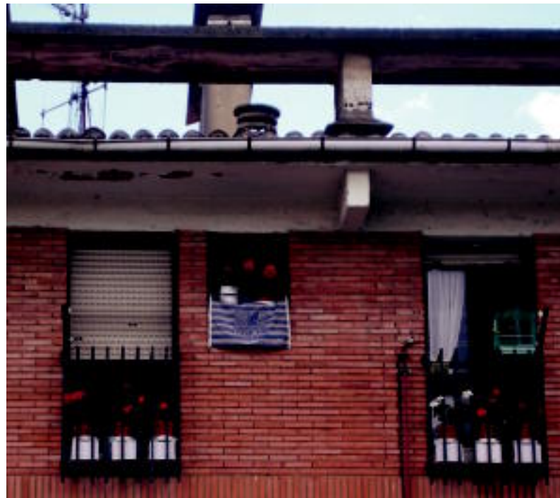
Tolosako Kondoko Aldapako etxe honetan Realaren aldeko bandera ikus daitezke lore artean. J. SAIZAR

TOLOSALDEA-LEITZALDEA ▶ Nahiz eta Lehen Maila galdu, Realaren aldeko bandera asko ikus daitezke eskualdeko etxebizitzetan