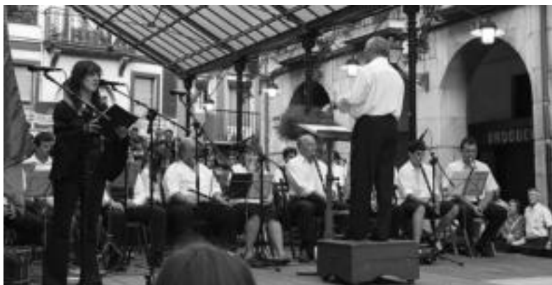
Herenegun arratsaldeko txistularien alardeko une bat, Berdura Plazan. IÑIGO AZPIRIKUIETA

Tolosako Orfeoia, dantzariak eta abeslariak ere hartu zuten parte