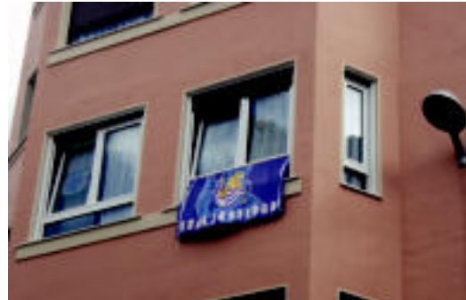
Gorriti plazan ere bada Realaren aldeko sentimendua. J.SAIZAR

▶ HITZAK ez du bere gain hartzen egunkarian adierazitako esanen eta iritzien erantzukizunik.