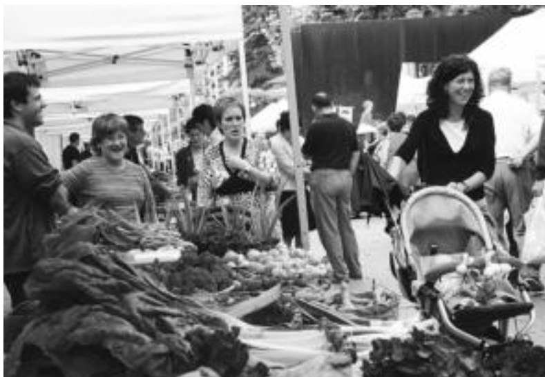
Azoka Berezia. Giro polita sortu zen Triangulon, Azoka Bereziko postuen inguruan: barazkiak, frutak, baserriko produktuak, artisau gailuak, produktu ekologikoak,... Makina bat aukera zegoen postuetan. Goiz partea lasaia izan zen arren, orduak aurrera egin ahal jende gehiago hurbildu zen. N. LATABURU

Tolosan ez ezik, Ibarra ere izan zuten zer eginik, Gazte Festen bigarren egunean. Biharamunarekin batzuk, freskoago beste batzuk, ekitaldietan guztiak hartu zuten parte, giro ona nagusituz.