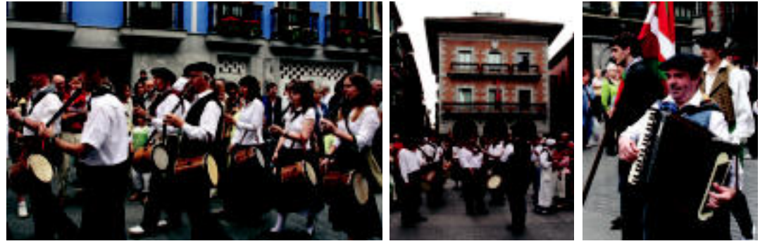
Plaza Zaharrean egin zuten hitzordua, udaletxe parean; bost belaunaldi bildu ziren bertan: musikari, dantzari,... N. LATABURU