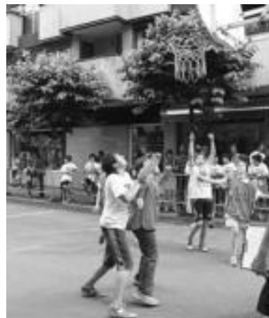
3x3. Saskibaloitxapelketa egin zuten kalean; infantilak eta alebinak goizean aritu ziren; kadeteen txanda, berriz, arratsaldean heldu zen. N. LATABURU