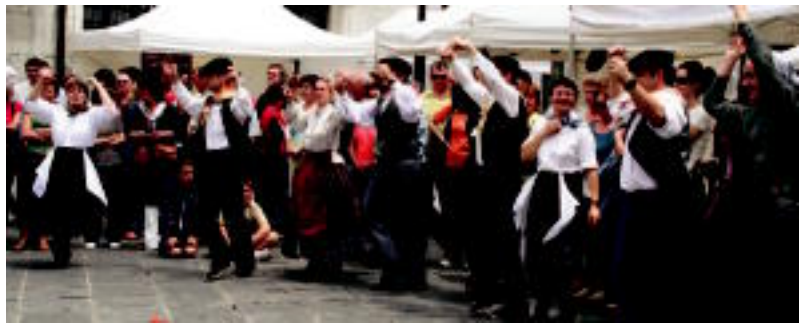
Alde Zaharreko kaleak dantzan zeharkatu ostean, Triangulon bildu ziren dantzariak. N. LATABURU

100 dantzari inguruk osatu zuten erromeria. Plaza Zaharra izan zuten abiapuntu. Alde Zaharreko kaleetatik barrena murgilduz. Amaierarako, berriz, Trianguloa aukeratu zuten, Azoka Bereziaren giroarekin uztartu zirelarik. Lehen belaunaldiak, ez horregatik motelena. Bedaioko ingurutxoak aurkeztu zuen; bigarrenak, berriz, Larrain-Dantza dantzatu zuen. Hirugarrenaren txandan, Iturengo Soka-Dantza, Iribasko ingurutxoak eta Imotzeko esku dantza eskaini zuten dantzariak. Laugarren belaunaldikoek Lapurdiko ihauteria dantzatu zuten eta, azkenekoen, Fandangoa eta arin-arina eskaini zuten.