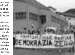
Ekitaldi politikoren ostean, manifestazioa egin zuten Lizartzan.