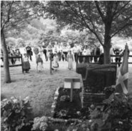
Naparraren oroimenezko eskultura Igarola baserrian.

Sendiak, «gorputza itzultzea lortu arte» borrokan jarraituko duela esan zuen