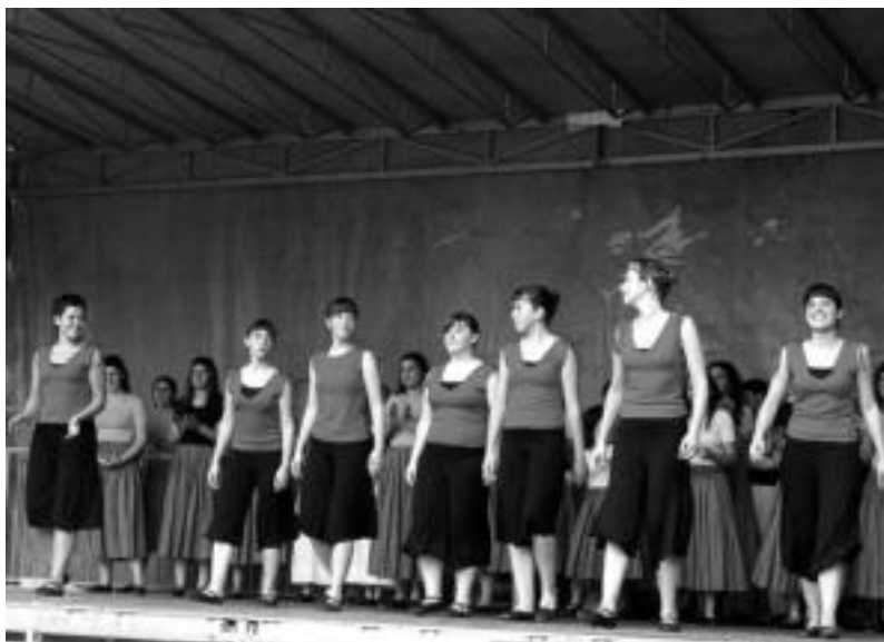
Ibarra Gazte Festak. Alurr dantza taldekoek emanaldia eskaini zuten arratsalde partean; bertan, jende ugari bildu zen herriko dantza taldea ikusteko. ESTI EZEIZA

Bigarren saria. Aldaba Zahar elkarte (Aldaba).