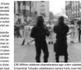
EAE-ANVren aldeko ekarretaratzeak egin zuten udalete aurretik, Ertzaiztat Tolosako udaletearen sarrerara hartu zuten bitartean.