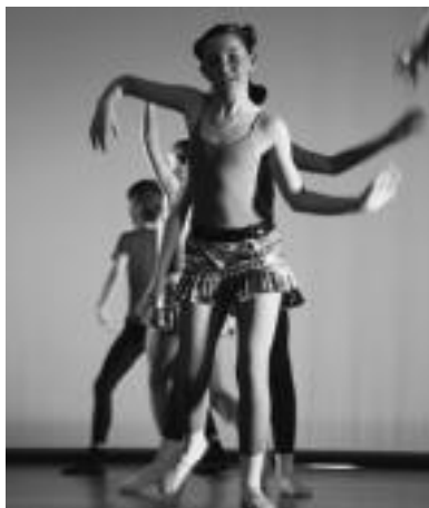
Dantza ikuskizuna. Dantza ikuskizun ederra eskaini zuten dantza tailerrekoek, Leidor aretoan eginiko emanaldian. ESTI EZEIZA