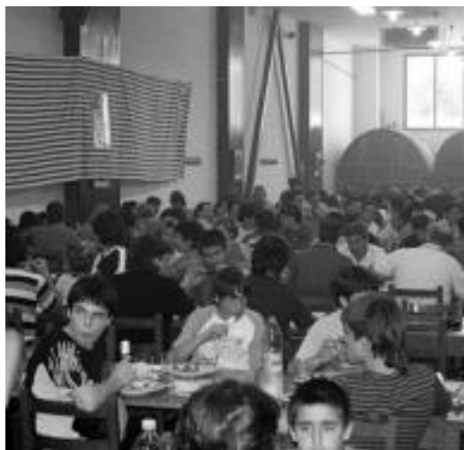
Villabonako Kirol Elkartean denboraldi amaierako bazkaria.

Kirol Elkarteko jokalariek, gurasoak eta entrenatzaileak mahai inguruan