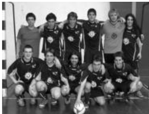
Denak Pizzak talde tolosarrak mailaz igoetzea lortu du. HITZA