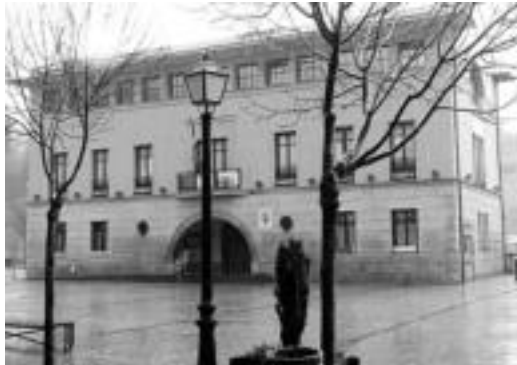
Gaur egingo dute Udalen osaketa, Ibarra, esaterako. A. IMAZ

EAE-ANV bere datuen arabera lortutako zinegotziak beraien eserlekuak eskatzera joango dira gaur, 10:00etako osoko bilkurara. Aurretik, 09:30ean elkarretaratzea egingo dute. Ezker abertzaleak eta Bai Asteasuri zerrendako kideek bilera egin dute. Iñaki Aménabar Bai Asteasuriko zerrendaburuak azaldu duenez, «guk