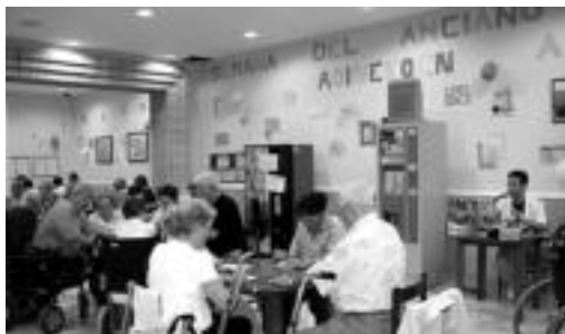
Adinekoen astearen baitan, bingoan aritu ziren atzo. E. EZEIZA