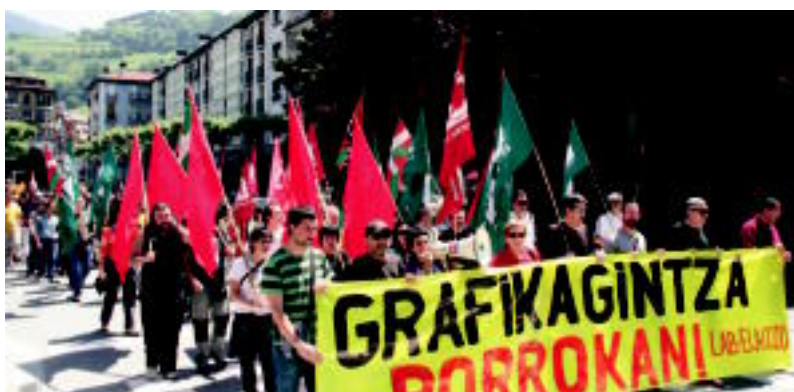
Triangulotik abiatu zen atzo manifestazioa Grafikagintza borrokan lelopean. N.L.

«Adegik jarrera aldatu ez duela eta», ELA, LAB eta CCOO mobilizazioekin jarraituz deitu dituzte alorreko langileak