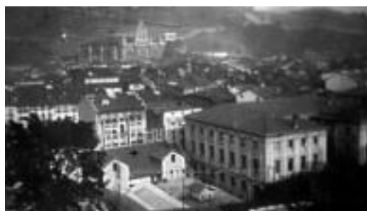
1907.ean, egungo Musika Eskolaren ondoan, seminario txikia. HITZA