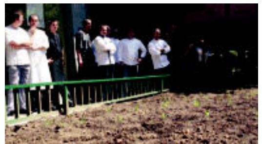
Sukaldari onenak. Tolosako hainbat jateko sukaldari ere izan ziren, eta haien txandan zulo batzuk bete zituzten. Hauetako babarrun batzuk baliteke haien lapikoren batean bukatzea... N. LATABURU