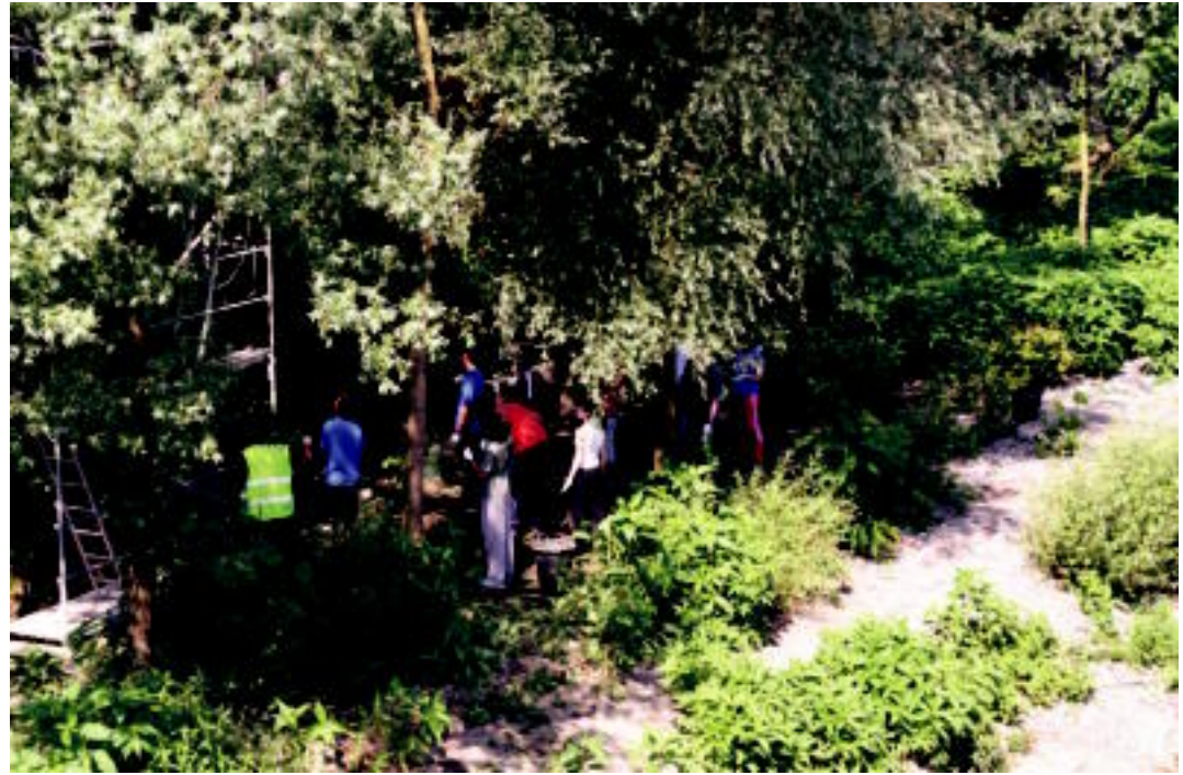
Ikasleek atzo goizean Berazubiko zubiko erreka ingurua garbitu zuten. I. TERRADILLOS

TOLOSA ▶ Ikastetxeetako ikasleek Oria ibaia garbitzen igaro zuten goiza, Aste Berdearen baitan Udalak antolaturiko ekitaldien harira