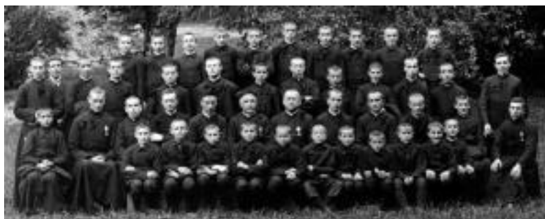
1915. urtean eginiko argazkia. Ikasleak eta apaizak ageri dira. HITZA

Tolosan, 2007ko ekainaren 6an. BEHIN BEHINEKO ALKATEA