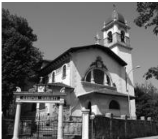
Egun Sakramentinoen egoitzak duen itxura. i. t.

Tolosako fundazioak laster batean hartu zuen seminario txikiaren itxura. 1907ko abenduan jadanik 70 eserleku zituen eta beste 170 eskatu zituen kaperarako. 1908ko urtarilaren 6an, kapera eta egoitza estreinatu zituzten, eta urte horretako urriaren 24an hasi ziren klaseak.