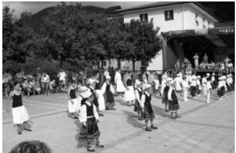
Alurr dantza taldeak Altzonen eskainitako emanaldiaren irudia. Ibarren 250 dantzari espero dituzte. N. URBIZU

Baserriarrez jantzita joatea eskatu dute antolatzaileek, haurrek berriz dantza emanaldiak eskainiko dituzte