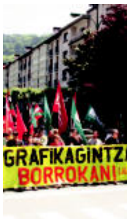
Atzoko manifestazioa.

LEHENDABIZIKOA ▶ Euskal jaien kutsua eman nahian, baserritarrez jantzita joatea eskatu dute ▶ 6