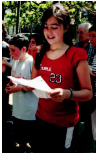
Bertsoak. Hirukide-Eskolapiotako ikasle batzuk babarrunari bertso batzuk prestatu zizkieten, eta gero, mikrofonoen beharrik gabe bertan abestu zuten, Gernikako Arbolako lorategian. N. LATABURU