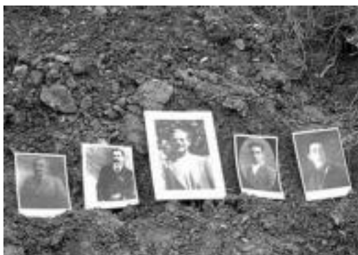
Fustiñanan eraildako gizonen argazkiak.

Indusketen helburua gorpuak identifikatzea da. «Familiak hori nahi dute. Gu familien menpe gaude, eta haiek eskatzen dutena egiten dugu. Familiak ados ez badaude, ezin da ezer egin. Indusketak modu arrazional batean egin behar dira, ez egin egiteagatik».