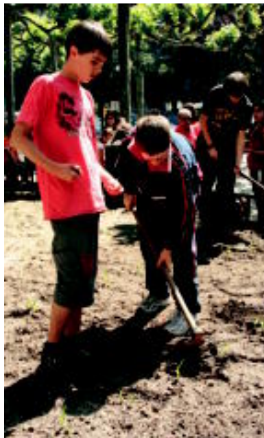
DBHko ikasleak. Tolosako Hirukide-Eskolapioko DBH 1. mailako ikasleak ere ereiten aritu ziren. Bakoitzak 2-3 zulo bete zituen. Irailean ereindakoa babarrunez josita ikusiko dute. INIGO TERRADILLOS