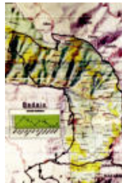
Banaturako triptikoa. HITZA

6-8 ordukoa izango da eta 07:30ean abiatuko da frontotik. Punturik garaiena Artubi da, 1.265 metrorekin. Izena bertan, www.bedaio.com -en edota bedaioerrota@hotmail.com -en eman daiteke. 5 euro balio du izen-emateak.